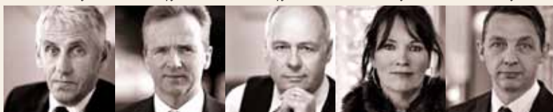
Guðmundur Baldvínsson útfararþjónusta