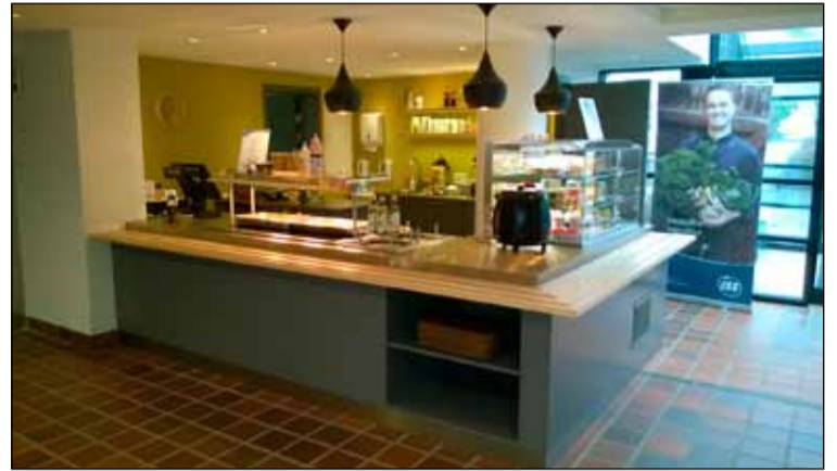
Glæsileg aðstaða í hinu nýja veitinga- og kaffihús.

Í Gerðubergi er fjölbreytt starfsemi þar sem meðal annars er bókasafn, viðamikil viðburðadagskrá af ýmsum toga allt árið um kring, útleiga á fundarsölum og félagsstarf. Undanfarna