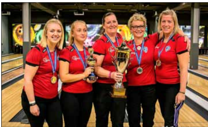
ÍR-ingar bikar- og deildarmeistarar í keilu.

Um síðustu helgi urðu svo lið ÍR deildarmeistarar í efstu deild bæði í karla og kvennaflokki. Frábær árangur hjá ÍR-ingum í keilunni sem fögnuðu 20 ára afmæli keiludeildar ÍR í vetur.