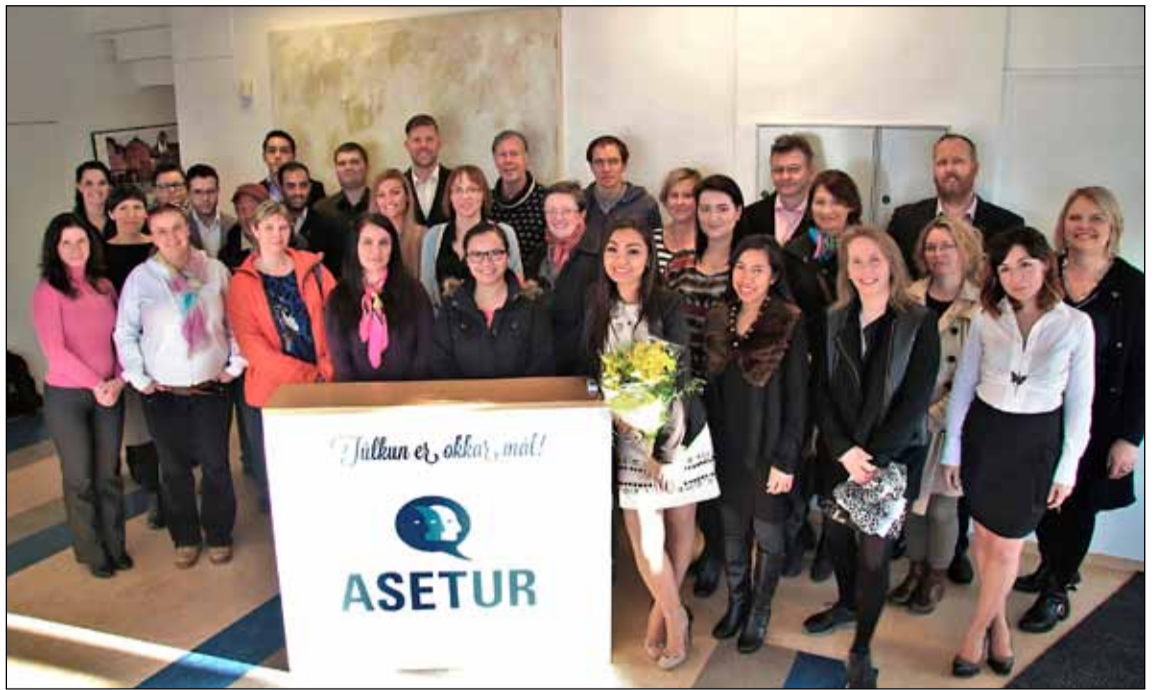
Starfsfólk hjá Alþjóðasetrinu og fleiri ásamt lógói fyrirtækisins.

Ein af sérstöðum Alþjóðaseturs er rafrænt verkþókhald sem heldur utan um öll verkefni og alla vinnutíma félagsins með aðstoð sérstaks verkskráningar-apps. „Eftir hrun fannst okkur að túlkabjónustan hér á landi hafði dregist töluvert aftur úr öðrum samskiptalausnum hvað tæknivæðingu varðar og ákváðum við að reyna að vinna upp þann mun. Bara núna á síðastliðnum tveimur árum hefur okkur tekist að gjörbylta umfangi þjónustunnar með því