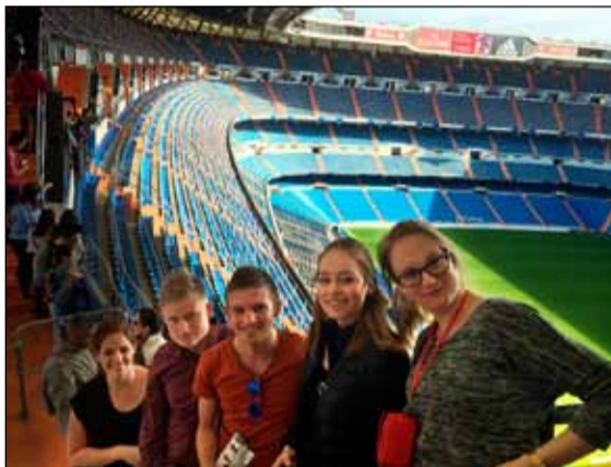
Á heimavelli Real Madrid, Santiago Bernabéu fótboltavellinum.