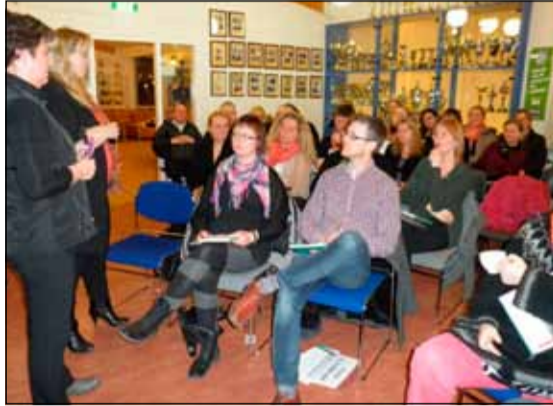
Myndin var tekin á námskeiði fyrir foreldra grunnskólanna í Breiðholti.