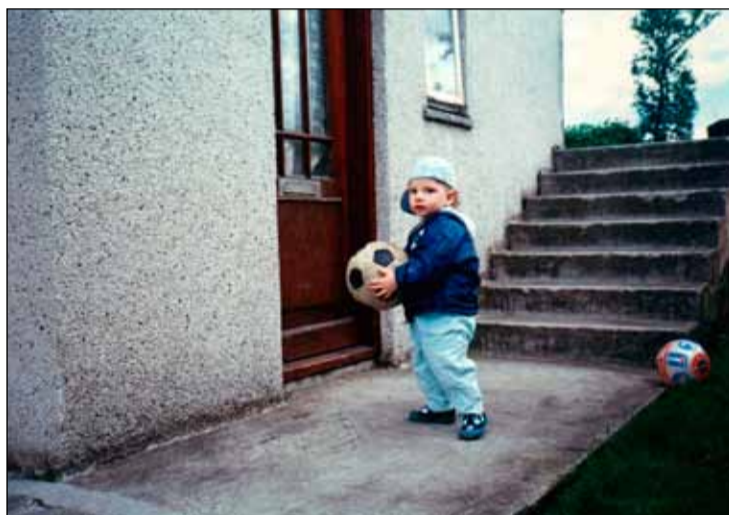
Snemma beygðist krókurinn. Með boltann á tröppunum heima í Hafnarfirði.