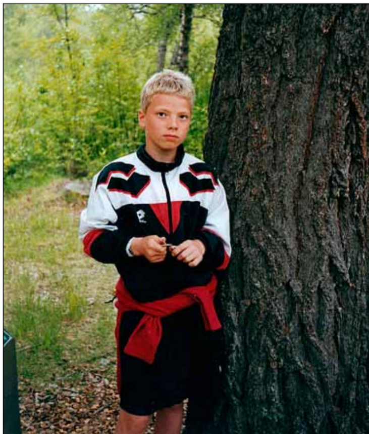
Einbeittur strákur staðráðinn í hvað hann ætlaði að verða.

sem fólk hefur á Breiðholtinu þá er þetta fyrir þá sem þekkja alveg frábært hverfi. Bakkarnir eru til dæmis hannaðir fyrir barnafjölskyldur. Ég er orðinn fjölskyldumaður og sé fyrir mér að þegar börnin fara að vaxa og fara út að leika sér þá geti maður fylgst með þeim af svölunum. Eða að fara í skólann eða þjónustukjarnann. Það þarf ekki að fara yfirgötu. Þetta er frábærlega hannað. Ég á eitt barn og annað er á leiðinni þannig að ég er ekki á förum. Alla vega ekki sem stendur. Mér finnst einhver lenska að tala illa um Breiðholtið. Ef fólk vill kalla þetta Getto þá má það gera það fyrir mér. En í því fellst stór miskilningur sem ég held að einkum stafi af fáfræði. Breiðhyllingar eru ekki að tala svona um hverfið sitt. Ég held að vandamálin í Breiðholtinu séu síst meiri en í öðrum hverfum og bæjarfélögum. Ég er búinn að vera í Breiðholtinu frá því 2001 og hef aldrei lent í neinu misjöfnu eða orðið var við það. Ég held að ég verði alltaf viðloðandi ÍR. Það er mitt félag. Ég verð alltaf ÍR-ingur jafnvel þótt ég eigi eftir að flytja úr hverfinu sem ég sé þó ekki fyrir mér. Ég finn mig mjög vel hér. Ég enda kannski sem íþróttakennari í Breiðholti.