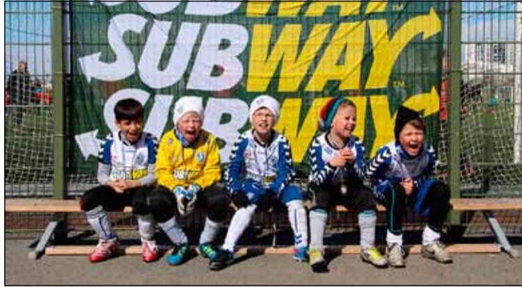
Ungir fótballamenn úr Breiðholtinu.

Samstarf Subway og ÍR spannar nokkur ár í meistaraflokkum félagsins og er það öllum mikil ánægja að nú sé höfðað til yngri kynslóðarinnar með móti sem þessu, og frekara samstarf er framundan þar sem einnig mun fara fram í fyrsta sinn Subway mót í 5. flokki karla, fimmtudaginn 9. maí. Þar er einnig búist við um 400 þátttakendum, svo allt í allt má reiknað með um 800 drengjum sem taka þátt í Subway