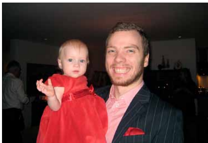
Fjölskyldumaður með dóttur sína á góðri stundu.