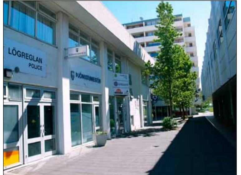
Hverfisstjóri Breiðholts hefur aðsetur í þjónustumiðstöð hverfisins sem er við göngugötuna í Mjóddinni í Breiðholti.

Hlutverk þessa tilraunaverkefnis er að leiða samstarf og tryggja samhæfingu borgarstofnana í Breiðholti á sviði velferðar, menningar, menntunar, umhverfis, frístunda, íþróttar og lýðheilsu. Heildstæð þjónusta borgarinnar verði íbúum hverfisins til hagsbóta. Verkefnið byggir á valdreifingu en hugtakið vísar til þess að fólk tekur stjórn á eigin lífi og auðgar og bætir líf sitt. Í því felst að efla hæfni sína, öðlast aukna þekkingu, þroska og skilning á umhverfi sínu og leggja rækt við samfélagið. Mikilvægt er að skapa aðstæður og umhverfi til þess að styrkja valdeflingu með aðgangi að þekkingu og upplýsingum og að til staðar sé vettvangur og farvegur fyrir fólk til að hafa áhrif. Valdefling eykur lífsgæði fólks, hver og einn hefur jafnt getu til að gefa sem þiggja. Hugtakið valdefling er nátengt hugtökunum notendasamráð og lýðræði. Þetta kemur m.a. fram í