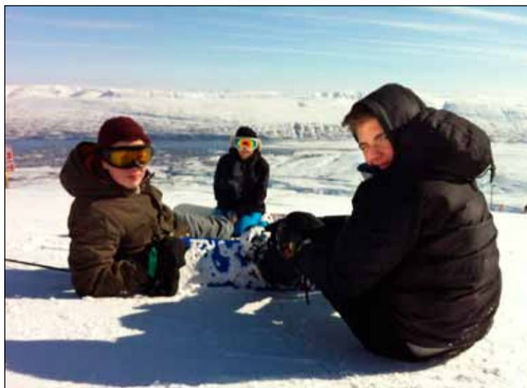
Á Bahamas eða í Hlíðarfjalli. Sólin er allsstaðar eins enda sú sama. Krakkar að hvíla sig í hlykkjóttir brekku og búa sig undir næsta rúnt.

Það var handgangur í óskjunni í skíða og brettaleigunni þegar allir kepptust við hvað mest þeir máttu að troða sér ofan í þrönga skíðaskóna og stilla snjóbrettin rétt svo hægt væri að bruna af stað út í ævintýrin sem biðu handan við hornið. Eftir fimm klukkutíma af stanslausum ferðum upp og niður hlykkjóttar hlíðarnar var kominn tími til þess að gefa skíðunum og brettunum frí rétt yfir há nóttina, ekki dugir að jaska útbúnaðnum út strax á fyrsta degi. Unglingunum var veittur frjáls tími til þess að dýfa þreyttum líkamanum ofan í heitar laugar sundlaugarinnar á staðnum, það var kærkomin slökun fyrir líkama og sál eftir afrek dagsins. Að loknu sundi var svo kominn tími til að seðja hungrið, ítalskar pizzur, hamborgarar frá Norður-Ameríku eða al-íslenskur ís frá Brynju urðu fyrir valinu hjá flestum. Eftir saðsaman matinn höfðu flestir orðið sér út um auka