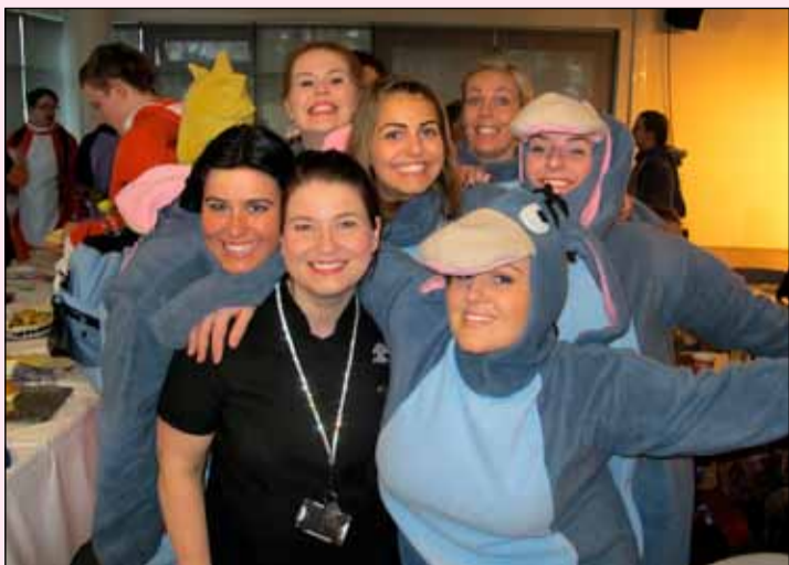
Útskriftarnemar FB fögnuðu og kvöddu kennara sína á dögnum. Nú hefst síðasta prófatörn þeirra og óskum við útskriftarnemum og öðrum nemendum góðs gengis í prófunum.