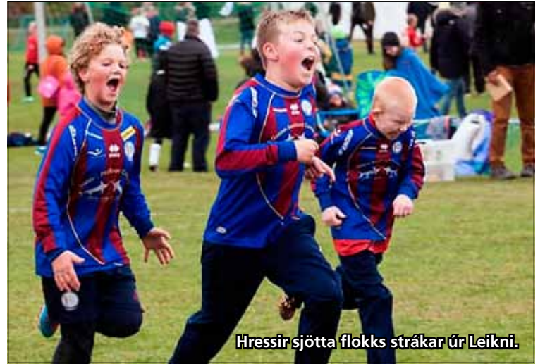
Hressir sjötta flokks strákar úr Leikni.

Fengu öll liðin fjögur að spila umul fótoltaleikja og skiptust á skin og skúrir meðan á leikum stóð og var fagnað og grátið í rússíbanuferðinni sem þetta mót var svo sannarlega. Vöktu Leiknislíðin öll athygli fyrir mikla samstöðu sem lýsti sér best með góðum stuðningi af hliðarlínunni þar sem lög Leiknisljónanna voru áberandi – svo sannarlega hinn rétti Leiknisandi hjá drengjunum. Að keppnisdögnum tveimur liðnum voru ansi margir þreyttir fótoltafætur sem tóku við viðurkenningum frá mótshöldurum. Allir áttu