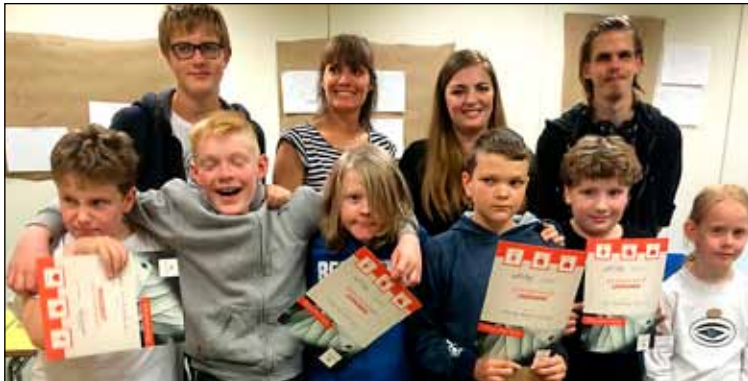
Hér eru krakkarnir ásamt leiðbeinendum með útskriftarskrirteini sín.

Krakkarnir bjuggu til líkón og frumgerðir og kynntu afurðir sínar á lokadegi námskeiðsins fyrir foreldrum og öðrum áhugasömum gestum. Það er frumkvöðlafyrirtækið INNOENT (www.innoent.is) á Íslandi sem stóð að námskeiðinu í samvinnu við FB og Fab Lab Reykjavík. Notast var við námstæki og efni INNOENT Education og felur það í sér veflægar vinnustofur,