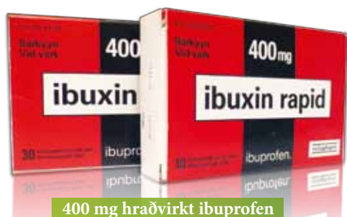
400 mg hraðvirkt ibuprofen