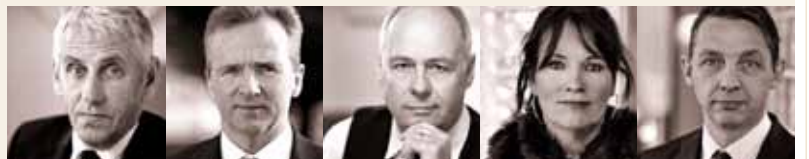
Guðmundur Baldvinsson útfararþjónusta