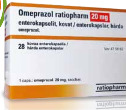
20 mg omeprazol

Nýtt apótek að Hraunbergi 4, beint á mótí Gerðubergi - kiktu í heimsókn!