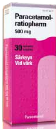
500 mg paracetamol