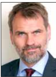
Árni Páll Árnason.

Eftir Árna Pál Árnason, formann Samfylkingarinnar.