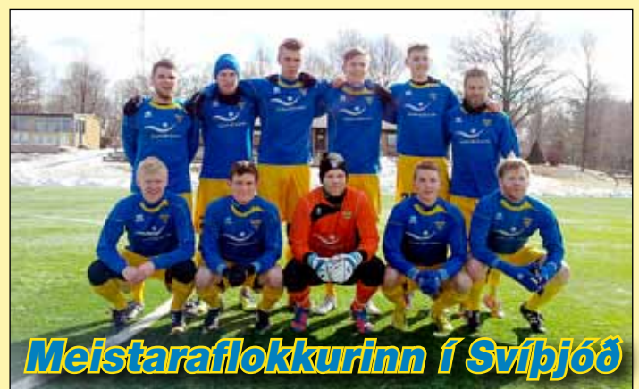
Meistaraflokkurinn í Svíþjóð

Björgunarsveitin og ferðast um landið allan ársins hring.