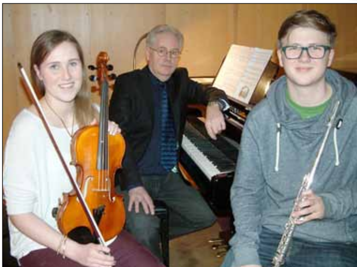
Selnestríó klárt í slaginn.

Selnestríó gerir nú víðreist en fjölbreytt samspil er ávallt til staðar í Tónlistarskóla Seltjarnarness. Í vetur hefur verið starfrækt tríó, sem haldið hefur tónleika víða á höfuðborgarsvæðinu nú í marsmánuði. Selnestríó, sem