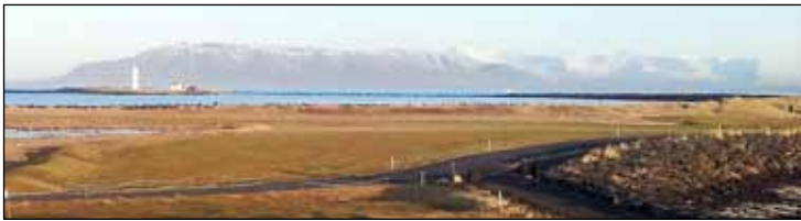
“Vetrarútsýni af Svörtubökkum: Bakkavík, Dalstjörn, Seltjörn, Gróttta, Kollafjörður, Akrafjall og Skarðsheiði”.

Til viðbótar þessu kæmi umferð vegna aukins veitingareksturs sem hugsanlega væri annað eins. Og ekki er ólíklegt að mest líf væri að færast í þá starfsemi seinni hluta dags fram að kvöldmat þegar Seltirningar eru á heimleið úr vinnu. Til baka færi þessi umferð svo á nóttinni með tilheyrandi skarkala eftir velheppnað kvöld í klúbbnum, þegar Nesbúar eru