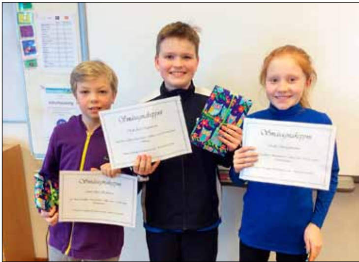
Sigurvegarar í smásagnakeppni 5. bekkjar.