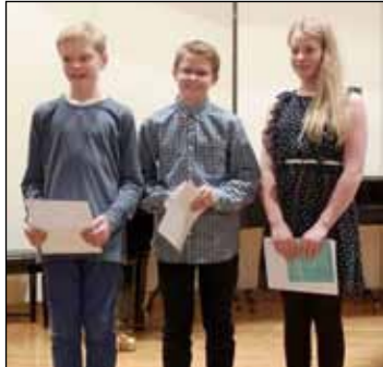
Verðlaunahafar í Stóru upplestrarkeppninni.

Keppendurnir voru þrettán talsins og komu frá Álfstanesskóla, Flata-skóla, Hofsstaðaskóla, Sjalands-skóla, Vífilsskóla og Grunnskóla Seltjarnarness, Valhúsa-skóla. Þau lásu samfelldan texta úr skáldsögunni Ertu Guð, afi? eftir Þorgrím Þráinsson, ljóð að eigin vali eftir Erlu (Guðfinnu Þorsteinsdóttur) og ljóð að eigin vali. Var til þess tekið hversu vel allir þátttakendur stóðu