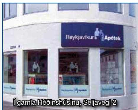
Í gamla Héðinshúsinu, Seljavegi 2