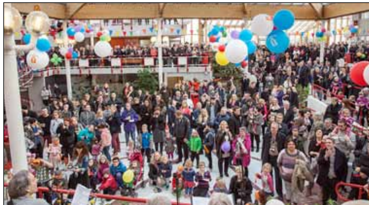
Fjöldi manns hlýddi á afmælisdagskrá á Eiðistorgi.