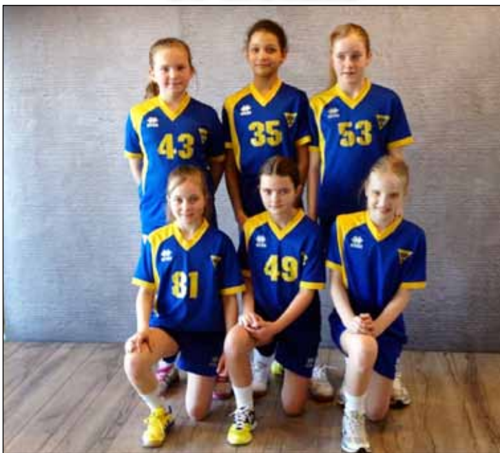
6. flokkur kvenna hefur staðið sig vel í vetur í handboltaum.

Nú er mótum marsmánaðar lokid hjá 6. fl. kvenna í handbolta. Stelpurnar eru að standa sig gríðarlega vel og hafa tekið miklum framförum. Fyrra mótið var hjá eldra árinu í Fylkishöllinni. Gróttu mætti til leiks með tvö lið, Gróttu1 & Gróttu2. Gróttu1 spilaði í 1. deilda en þær náðu sér ekki almennilega á strik fyrr en í lok mótsins en það dugði því miður ekki til þess að halda sér í deildinni.