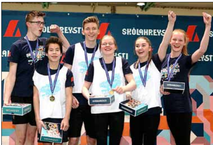
Sigurlið Valhúsaskóla sem sigraði í sínum riðli í Skólahreysti.