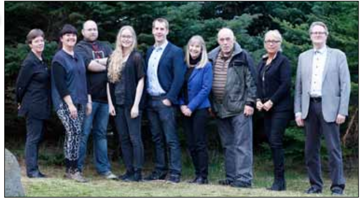
Hluti frambjóðenda Neslistans.

arstjórnina að kaupþilboðið yrði samþykkt. Bæjarstjórn hefur einnig samþykkt samkomulag um kostnaðarskiptingu við Tenor ehf. vegna verklegra framkvæmda við byggingu bílageymslu vegna lóðarinnar Hrólfsskálamels 1 til 7 sem þegar hafa átt sér stað.