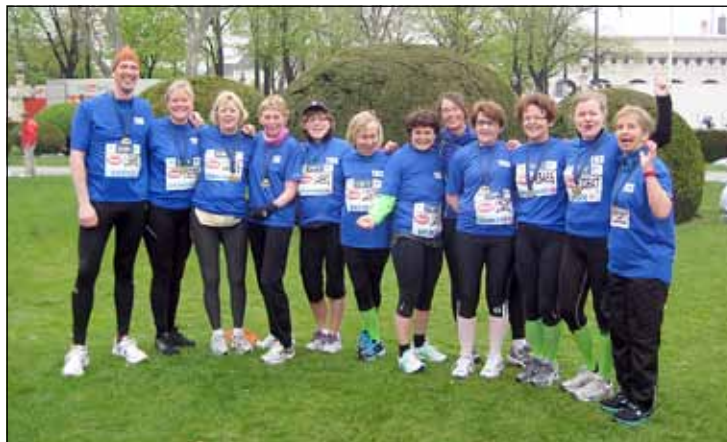
Félagar úr TKS í Vínarborg síðastliðið vor.