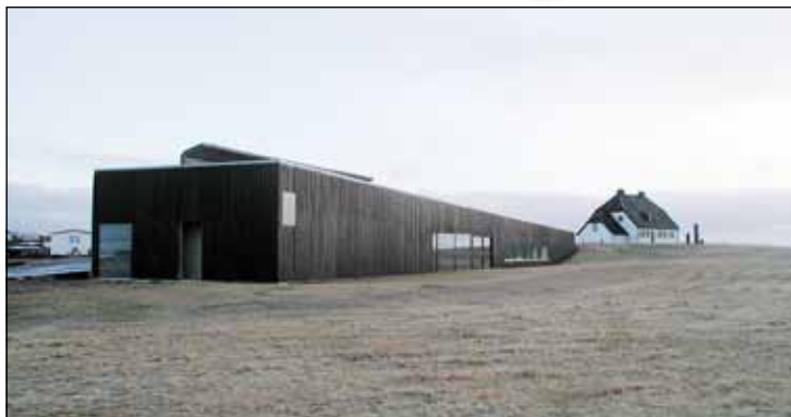
Hálfbyggt safnahús við Nesstofu.

Samkvæmt samningnum á Seltjarnarnesbær að bera ábyrgð á framkvæmdum við safnabygginguna en kostnaður við hana var upphaflega áætlaður 345 milljónir króna. Seltjarnarnesbær skuldbatt sig til að leggja til 110 milljónir króna auk lóðar undir safnið og Læknafélag Íslands 50 milljónir króna. Menntamálaráðuneytið átti að greiða 75 milljónir króna en að auki á söluandvirði fasteignarinnar Bygggarða 7 á Seltjarnarnesi að renna til framkvæmdarinnar. Bygggarðar 7 voru keyptir fyrir erfðafé Jóns Steffensen, prófessors emeritus, sem arfleiddi Læknafélag Íslands að tilteknum eignum og fjármunum í erfðaskrá sinni. Safnið á samkvæmt samningnum að starfa sem stofnun á vegum bæjarfélagsins og verða miðstöð safnastarfssemi á sviði lækna- og heilbrigðisvísinda auk þess að bera ábyrgð á söfnun, varðveislu, rannsóknunum og miðlun á þeim munum og minjum sem snerta sögu lækninga á Íslandi en þær tengjast Seltjarnarnesi með