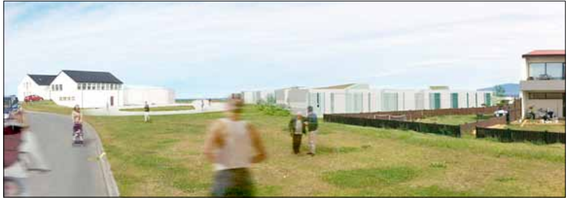
Þannig lítur hugmyndin um hjúkrunarheimili í nágrenni Nesstofu út á tölvumynd.