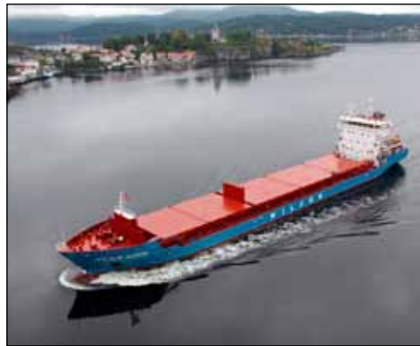
Flutningaskipið Wilson North, flaggskip Nesskippa og Wilson. Burðargeta 8.300 tonn.