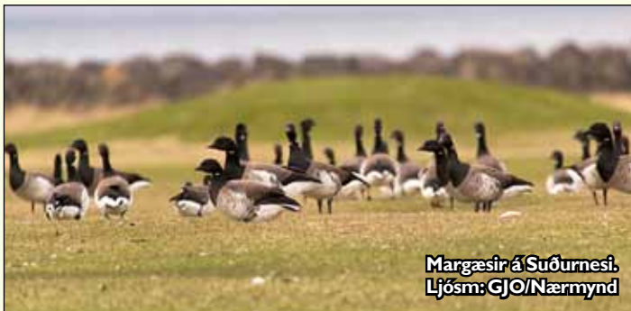
Margæsir á Suðurnesi.