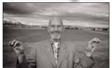
Meistari Ottó.

Hægt er að glugga í myndsaft Guðmundar á heimasíðu hans nærmynd.is og einnig má nálgast sumar myndirnar á nkgolf.is.