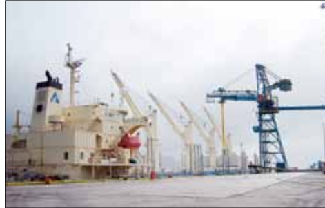
Gr Leader: Umboðsþjónusta við súrálsskip er ríkur þáttur í starfsemi Nesskippa

til gerðum tankskipum sem við höfum aðgang að frá norsku samstarfsfélagi okkar. Þá er flutningur á fiskimjöli og brotamálum ríkur þáttur í okkar starfsemi. Þá sinnum við alltaf með reglulegu millibili svokölluður „project“ flutningum sem þá tengjast einkum einstökum verkefnum eða framkvæmdum.