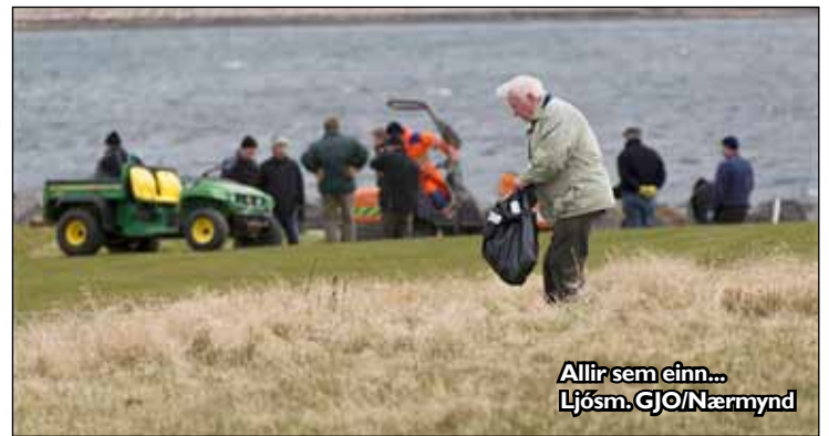
Allir sem einn...

að það eru allir alltaf hjartanlega velkomnir.