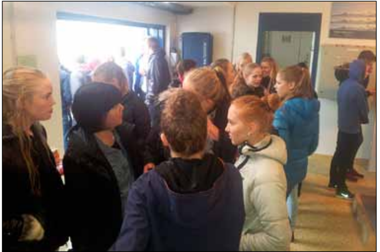
Myndin var tekin af heimsókn 10. bekkinga í Hitaveitu Seltjarnarness fyrir skömmu.