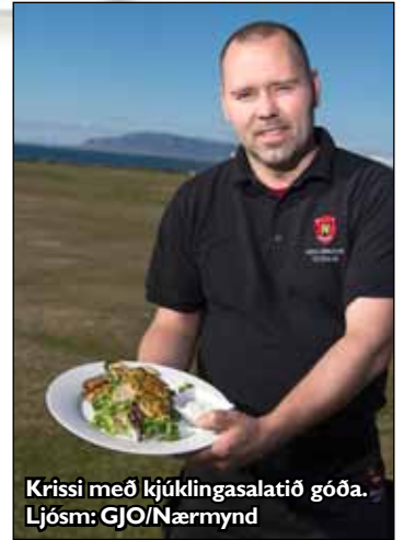
Krissi með kjúklingasalatíð góða.

Matseðillinn er fjölbreyttur en meðal vinsælustu rétta eru NK-borgarinn, Biðlista-samlökan og Kjúklingasalat Krissa. Bæði matur og drykkur eru á hóflegu verði og útsýnið algjörlega frítt. Þegar vel viðrar má njóta veitinganna úti á palli og það er bæði endurnærandi fyrir líkama og sál að bregða sér úr skarkala bæjarlífsins í hádegis- eða kvöldmat til Krissa. Munið