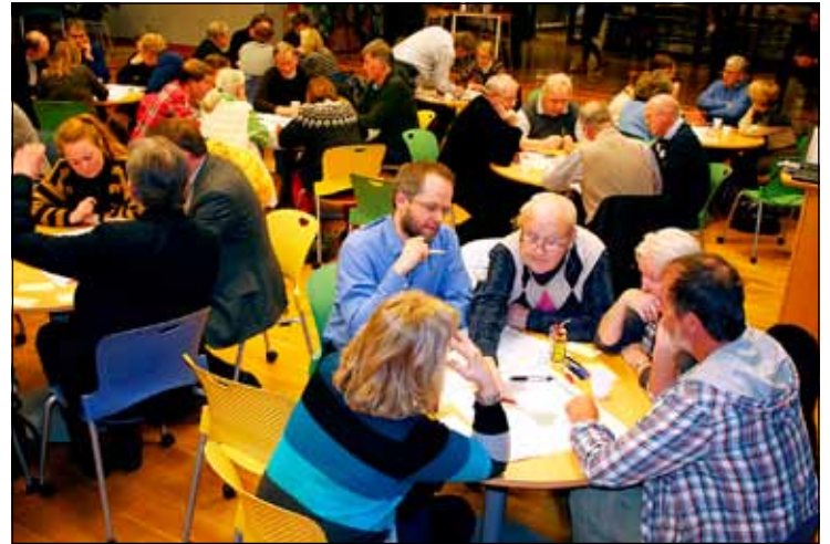
Áhugasamir þátttakendur á umhverfisþingi.