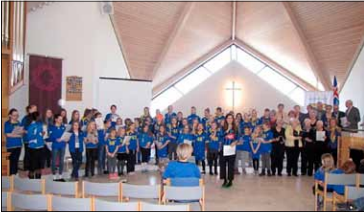
Fjöldi manns tók þátt í Gróttumessuni.