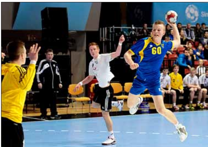
Það munaði hársbreidd að Gróttu stæði uppi sem sigurvegari í leiknum.

Þriðji flokkur karla í Gróttu lék bikarúrslitaleik laugardaginn 9. mars. Andstæðingarnir voru FH-ingar en liðin eru í tveimur efstu sætum 1. deildar um þessar mundir, Gróttu í 1. sæti en FH í 2. sæti einungis stigi frá okkar mönnum. Bikarúrslitaleikir HSÍ hafa löngum þótt með stærstu leikjum vetrarins en umgjörðin, stemningin og aðstaðan er algjörlega til fyrirmyndar. Frábær mæting var á leikinn en um 500 áhorfendur mættu til að berja liðin augum. Gróttufólk var fjölmennt á vellinum og lét vel í sér heyra.