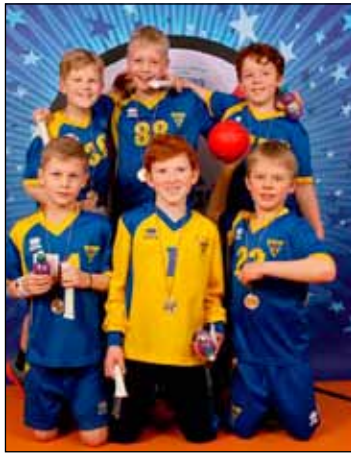
Hluti af Gróttustrákunum sem tóku þátt í Ákamóti HK.

Í 7. flokki er leikið samkvæmt minniboltareglum HSÍ þar sem 4 leikmenn eru inn á hverju sinni og þátttaka hvers leikmanns hámarkuð. Markarskor er ekki talið þó að margir keppnismenn leggi það á minnið í leiknum. Aðalatriðið er þó að minnst þess að þetta er leikur, sérstaklega í þessum flokki og mikilvægt að þetta er gaman. Gróttudrengirnir stóðu sig mjög vel og öttu kappi við fjölmörg lið um helgina. Flott tilþrif sáust á mótinu hjá strákunum, allt frá einföldum gabbhreyfingum, hornaskotum og upp í þaulæft leikkerfi. Drengirnir hafa bætt sig með hverju mótinu í vetur og greinilegt að æfingin skilar sér. Næsta mót hjá drengjunum er á Selfossi í byrjun apríl og er mikil tilhlökkun hjá drengjunum fyrir það mót.