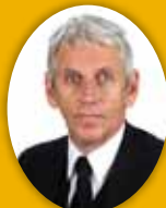
Guðmundur Baldvinsson útfararþjónusta