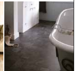
Baðherbergið hlýtt og mjúkt undir fæti