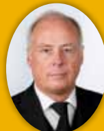
Ellert Ingason útfararþjónusta