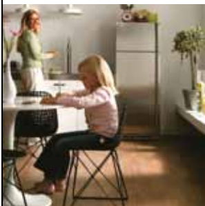
Eldhúsið hjarta heimilisins