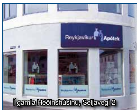
Í gamla Héðinshúsinu, Seljavegi 2