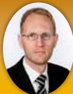
Frimann Andrésson útfararþjónusta