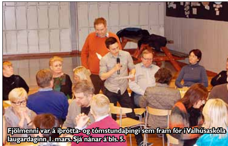
Fjölmennti var á íþrótt- og tómstundabingi sem fram fór í Váhhúsaskóla laugardaginn 1. mars. Sjá nánar á bls. 5.