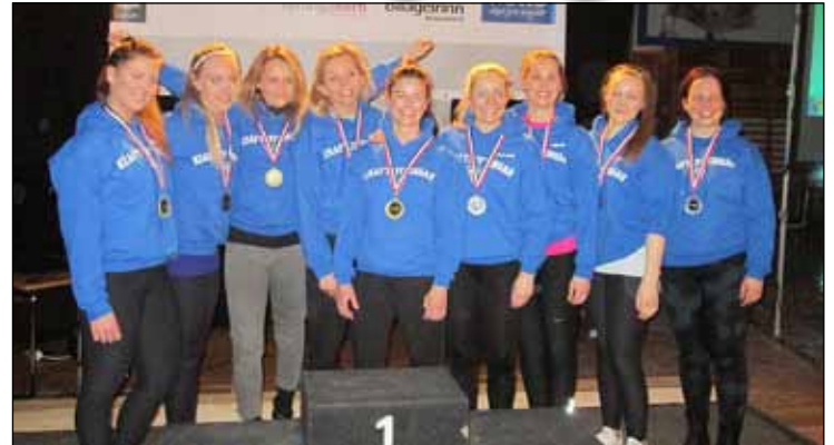
Gróttu átti glæsilega fulltrúa sem tóku þátt í Íslandsmeistaramótinu í kraftlyftingum.

um, hornaskotum og upp í þaulæft leikkerfi. Drengirnir hafa bætt sig með hverju mótinu í vetur og greinilegt að æfingin skilar sér. Næsta mót hjá drengjunum er á Selfossi í byrjun apríl og er mikil tilhlökkun hjá drengjunum fyrir það mót.