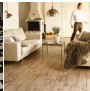
Stofan alltaf jafn heimilislegt