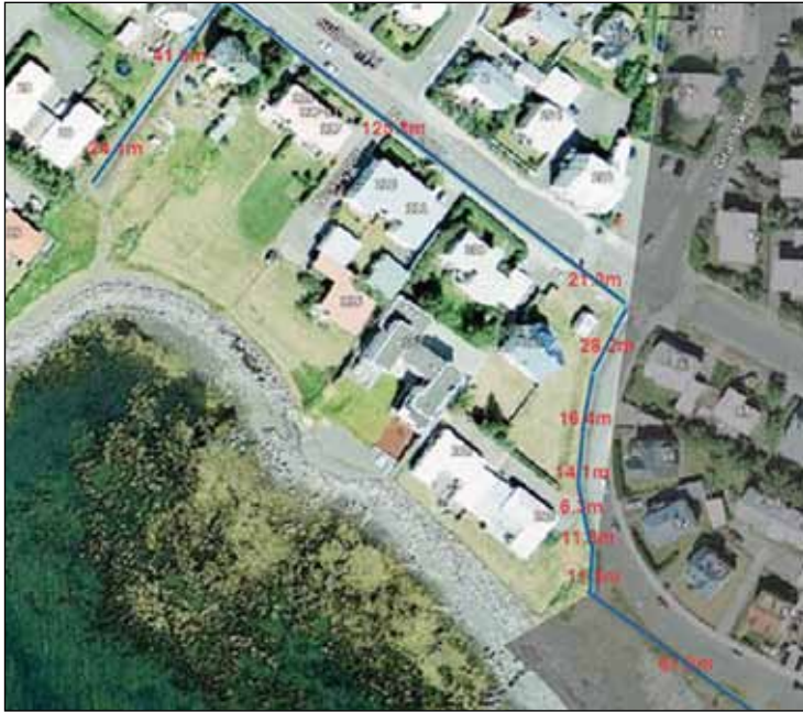
Bæjarmörk Seltjarnarnes og Reykjavíkur við Nesveg.