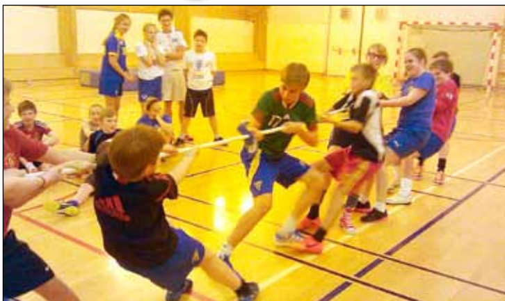
Keppt var í ýmsum greinum í ferðinni hjá 4. flokki.

Fótoltasumarið er hægt og rólega að renna upp en síðustu vikur hafa yngri flokkarnir undirbúið sig af kappi fyrir komandi átök. Í byrjun apríl fóru krakkarinnir í 4. flokki karla og kvenna í skemmtilega æfingaferð á Voga í Vatnsleysuströnd.