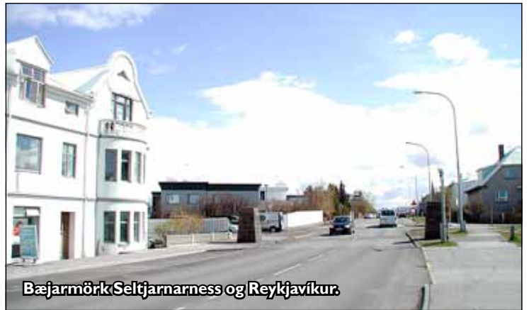
Bæjarmörk Seltjarnarness og Reykjavíkur.

Skipulags- og mannvirkjanefnd Seltjarnarness leggst eindregið gegn þeim fyrirætlunum sem nú eru uppi um þrengingu umferðar um Mýrar- og Geirsgötu og hvetur skipulagsyfirkvöld Reykjavíkurborgar til að koma með raunhæfar lausnir á þeim umferðarvanda sem augljóslega blasir við á þessu svæði.