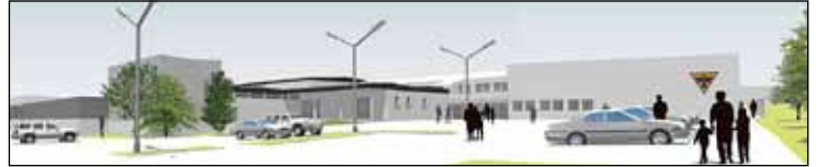
Framhald af forsíðu.

Fyrirhuguð stækkun býður fyrst og fremst upp á gott æfingahús en er ekki hugsað sem fullkomið keppnishús. Fimleikadeild Gróttu er að mati hópsins komin að þolmörkum. Hún getur ekki stækkað eða aukið árangur sinn við þær aðstæður sem hún býr við í dag. Ekki er unnt að fjölga iðkendum þar sem salurinn ber það ekki á háannatíma og undanfarin ár hefur afreksfólk Gróttu því þurft að leita í æfingaaðstöðu annað. Með bættri aðstöðu þarf síður að færa áhöldin til, en slíkt styttrir notkun-