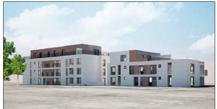
Skerjabraut 1-3 (Íðunnarreiturinn), þar mun rísa fjölbýlishús með 23 íbúðum.

Talið berst að byggingasvæðum handan bæjarmarkanna – í gamla Vesturbænum í Reykjavík. „Á því svæði er stefnt að mikilli uppbyggingu. Í því sambandi er rétt að nefna Lýsisreitinn svokallaða vestan við JL húsið þar sem Lýsi var á árum áður. Þar er áformað að byggja 142 íbúðir. Þessar íbúðir