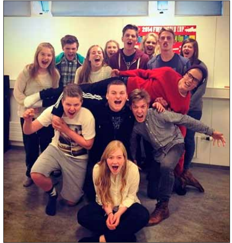
Hressir krakkar í jafningjafræðslunni.