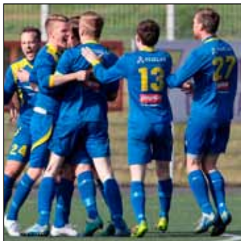
Marki fagnað gegn Aftureldingu.

Mikill kraftur var í Gróttuliðinu og þegar ljóst var í leikslok að önnur úrslit í deildinni höfðu fallið Gróttu í vil og að sætið í 1. deild