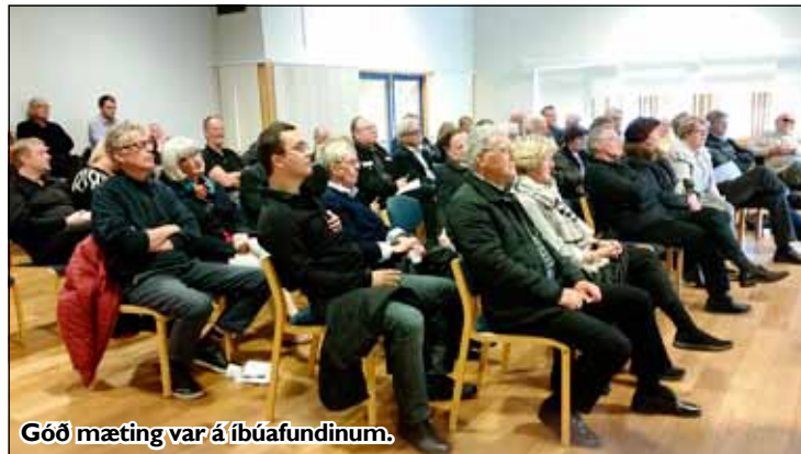
Góð mæting var á íbúafundinum.