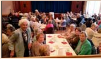
Yfir eitt hundrað manns mættu.

Þriðjudaginn 2. september s.l. var haldið vöflukaffi og kynningarfundur vegna vetrarstarfs eldri bæjarbúa á Seltjarnarnesi. Yfir eitt hundrað manns mættu í Félagsheimilið.