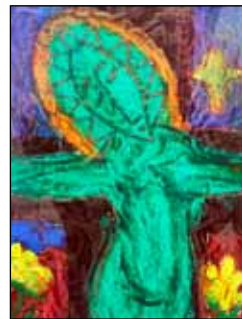
Verk eftir Svein Björnsson listmálara.