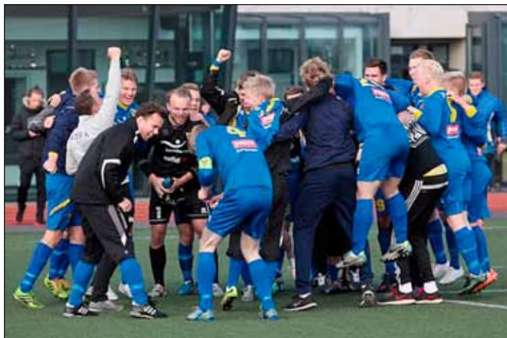
Sæti í fyrstu deild fagnað í leikslok.

væri öruggt að þá brutust út mikil fagnaðarlæti.