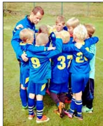
Strákarnir í 6. flokki.

Eftir að hafa tapað öllum þremur leikjunum fyrsta daginn tók A-liðið á sig rögg og var ósigrað þar sem eftir var móts. Þeir stóðu því uppi sem sigurveggarar í Heimaeyjabikarnum sem þeir tóku stoltir á móti á verðlaunaafhendingunni. B-liðið var jafnasta Gróttuliðið, strákarnir spiluðu flottan fótbolta og áttu marga afbragðs leiki. Það var mikill stígandi í C1-liði Gróttu allt mótið. Á lokadeginum fóru hjólin að snúast almennilega þegar strákarnir fóru að spila boltanum vel á milli sín og uppskáru flott mörk og tvo góða sigra. C2-liðið var allt skipað yngra árs strákum sem voru að þreyta frumraun sína á Shellmótinu. Stundum létu strákarnir kappið og tilfinningarnar bera sig ofurlíði en inn á milli léku Gróttumenn eins og sann-