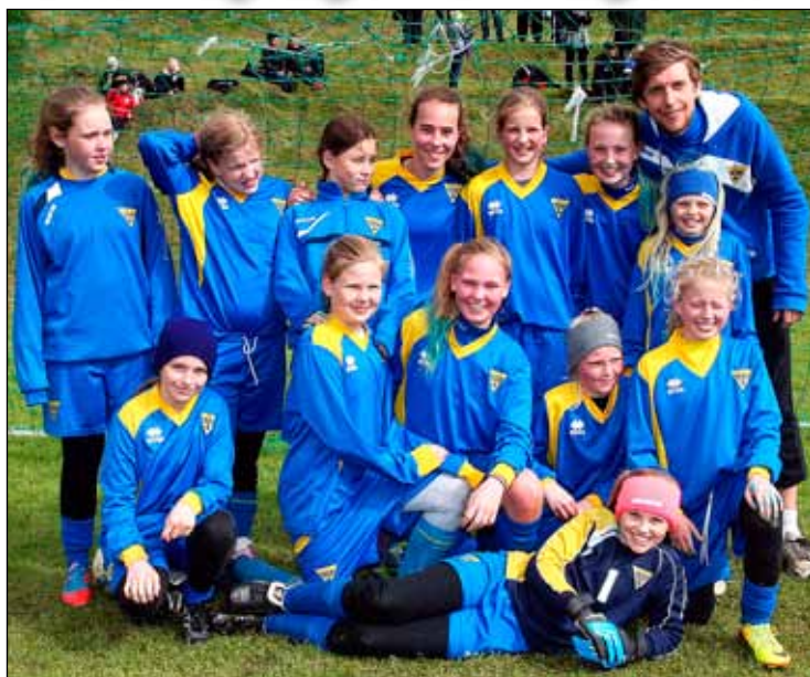
Gróttustelpur í Eyjum.

Glæsilegur hópur Gróttustelpna í 5. flokki hélt á Pæjumótið í Vestmannaeyjum í byrjun júní. Þetta var í 3. sinn sem Gróttu sendi lið á þetta skemmtilega mót og sem áður var ferðin ógleymanleg í alla staði.