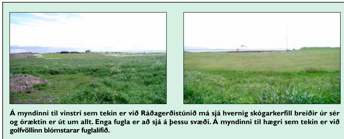
Á myndinni til vinstri sem tekin er við Ráðagerðistúnið má sjá hvernig skógarkerfill breiðir úr sér og óræktin er út um allt. Enga fugla er að sjá á þessu svæði. Á myndinni til hægri sem tekin er við golfvöllinn blómstarar fuglalífið.