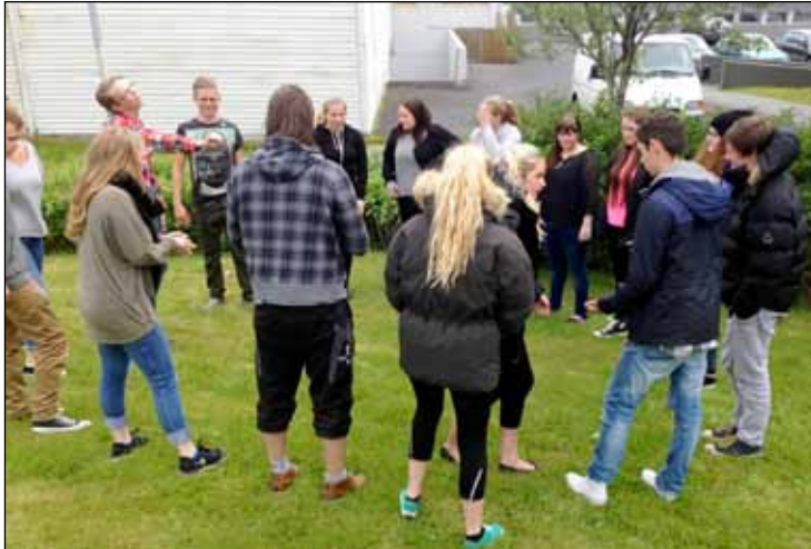
Ungmennin ræða málin utan dyra.

Í sumar er annað ár jafningjafræðslunnar fyrir ungmenni á Seltjarnarnesi en jafningjafræðslan er samstarfsverkefni Seltjarnarness við Reykjavíkurborg og Hitt Húsið. Seltirningar senda tvö ungmenni sem fá þjálfun hrá Hinu Húsinu ásamt jafningjafræðurum Reykjavíkur og Kópavogis. Þegar þau hafa lokið námskeiðinu koma þau aftur á Nesið og fræða ungmenni í Vinnuskólanum.