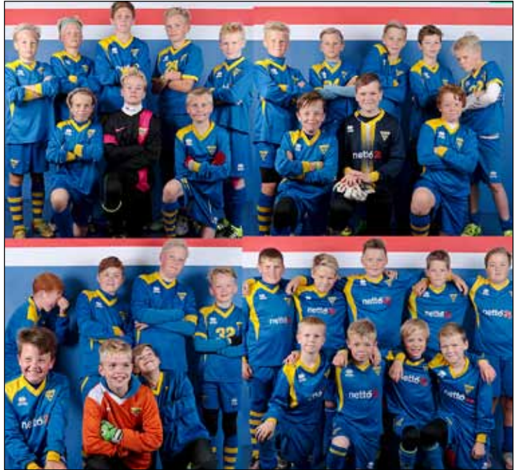
Strákarnir í 5. flokki sem voru á Olísmótinu.