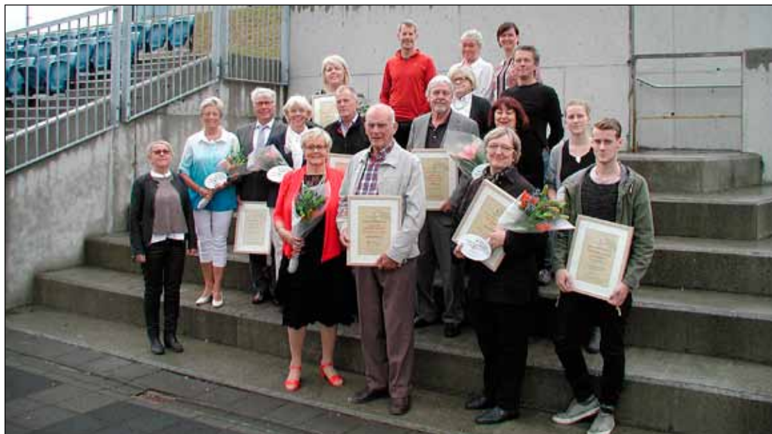
Umhverfisviðurkenningar Seltjarnarnesbæjar voru veittar þriðjudaginn 18. ágúst í sal Gróttu við fótboltavöllinn við Suðurströnd. Á myndinni eru þau sem hlutu viðurkenningar ásamt umhvefisnefnd Seltjarnarnesbæjar. Sjá nánar á bls. 6.