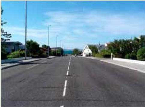
Gata ársins: Lindarbraut.