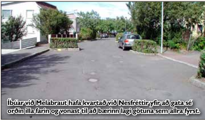
Íbúar við Melabraut hafa kvartað við Nesfréttir yfir að gata sé orðin illa farin og vonast til að bærin lagji götuna sem allra fyrst.