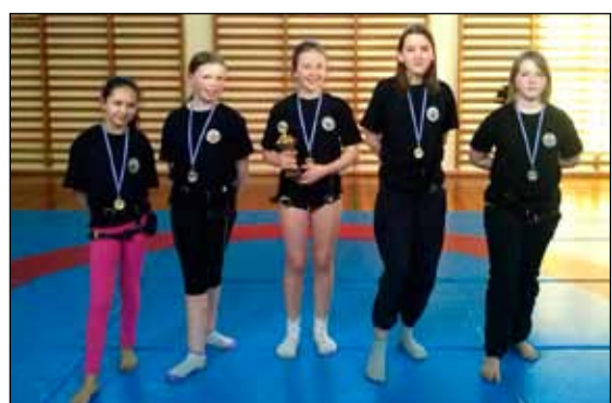
Keppendur í stelpnaflokkum.

Bikarglíma KR 2013 fór fram í íþróttahúsi Melaskólans 10. apríl sl. Keppt var í karlaflokkum og stúlknaflokkum. Í karlaflokkum sigraði Orri Björnsson, hlaut 4 vinninga, Ottó Óttarsson hlaut 2 vinninga og Ásgeir Víglundsson 1 vinning.