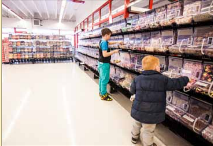
Nammiland í Iceland.

Iceland verslunin við Fiskislóð 3 hefur fengið frábærar viðtökur. Iceland er glæsilegur stórmarkaður með alla almenna heimilissvöru í úrvali á mjög góðu verði.