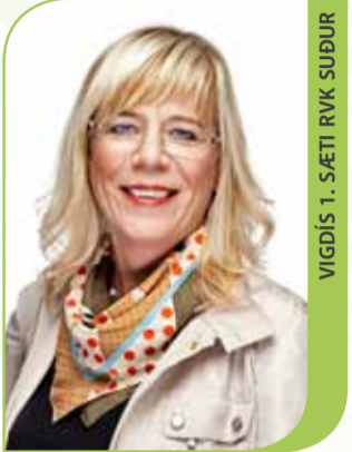
VIGDÍS 1. SÆTI RVK SÚÐUR