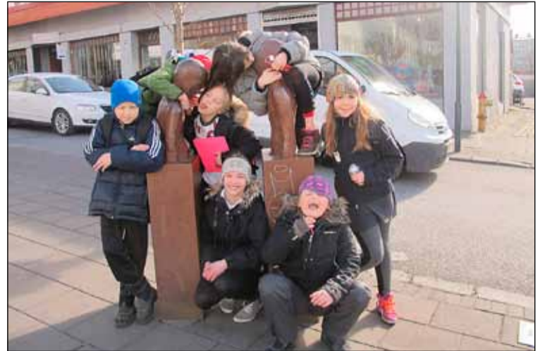
Hressir krakkar úr Frostaskjóli, staddir í Bankastræti.

Í maí á að bjóða 4. bekkungum sem sækja Frostheima að koma í heimsókn í Frostaskjól og kyn-