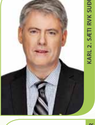
KARL 2. SÆTI RVK SÚÐUR