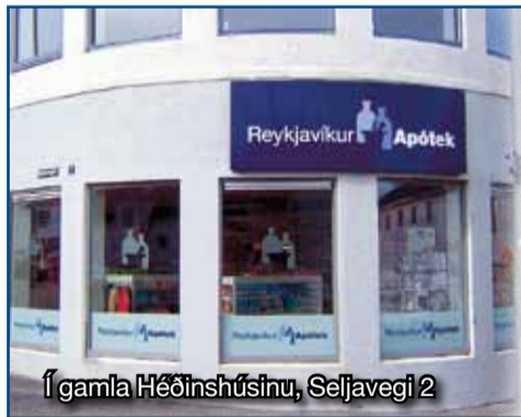
Í gamla Héðinshúsinu, Seljavegi 2