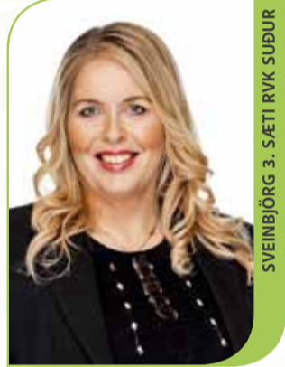
SVEINBJÖRG 3. SÆTI RVK SÚÐUR