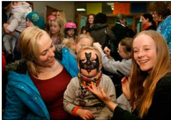
Boðið var upp á andlitsmálun.