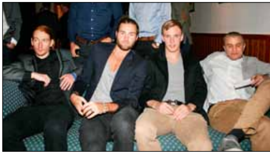
Leikmenn KR í afslöppun í einum sófanum, ekki veitir af!