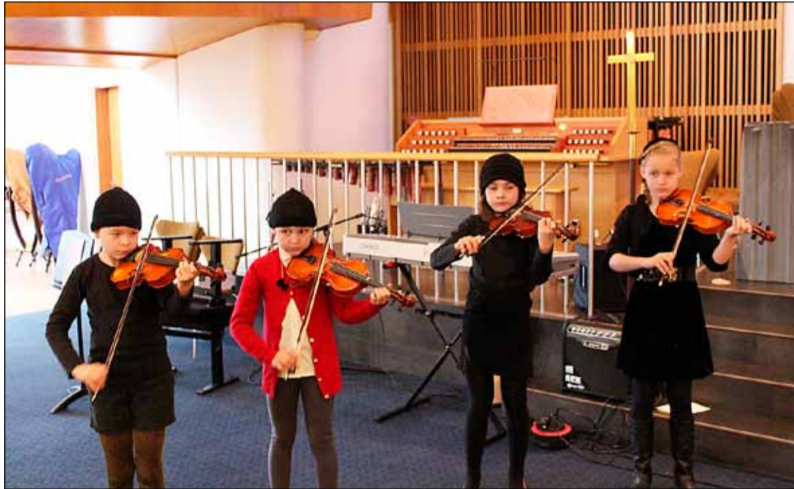
Þessar stúlkur voru meðal fjölmargra nemenda sem komu fram á þematónleikum.