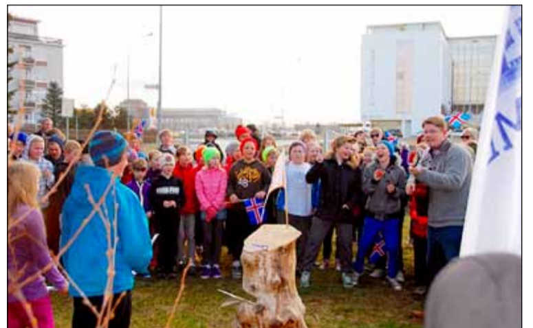
Frá athöfninni við Melaskóla.