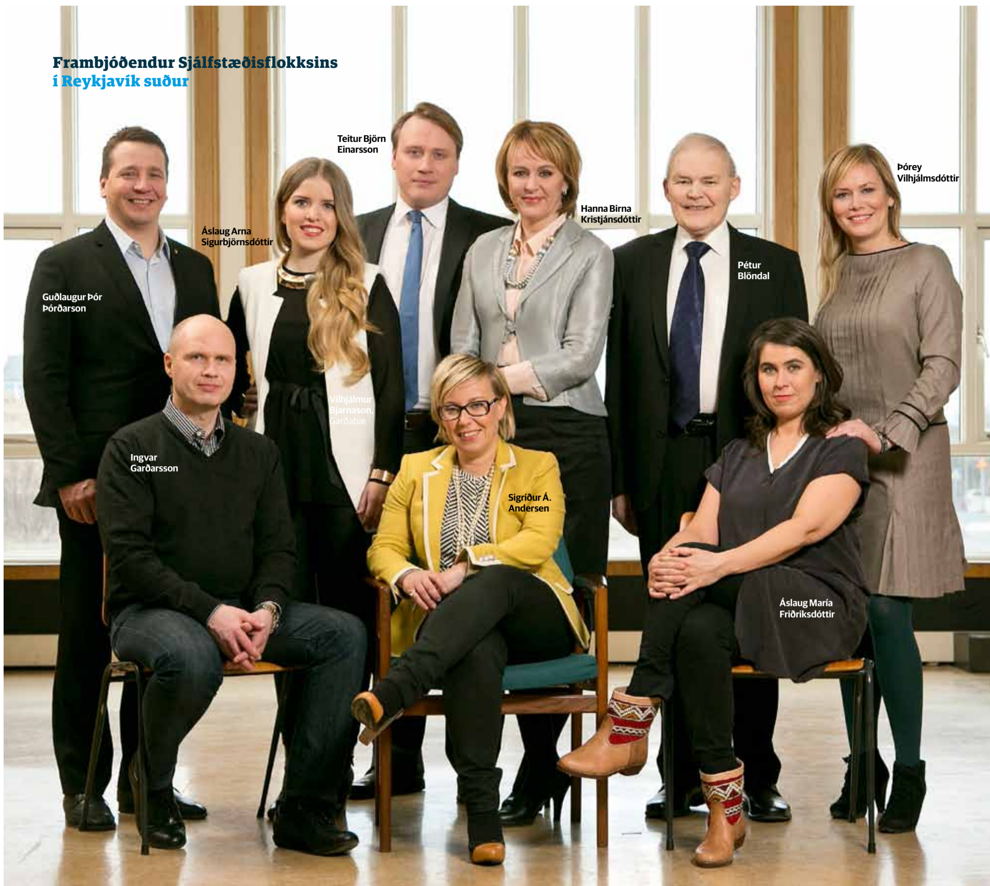
Guðlaugur Þór Þórðarson