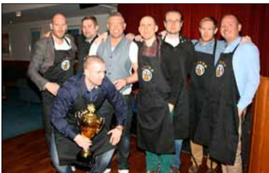
Sigurliðið í árgangamótinu sem fór fram á KR-svæðinu fyrr um daginn.