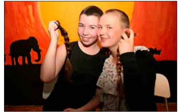
Að lokinni klippingu.