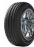
Michelin Pilot Sport 3