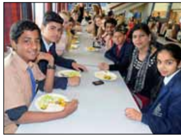
Hluti indverska hópsins.

var æðislegt að kynnast svona mörgum og flottum krökkum og læra um aðra menningu. Það sem að gerði þetta allt möguleg vöru Samtökin Samband sem að tengja íslenska og indverska krakka saman og útrýma staðalímyndum um menningu landanna tveggja. Og ein skemmtileg staðreynd um orðið samband er að það þýðir það sama á hindi og íslensku,” sögðu krakkar í Hagaskóla.