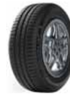
Michelin Energy Saver +