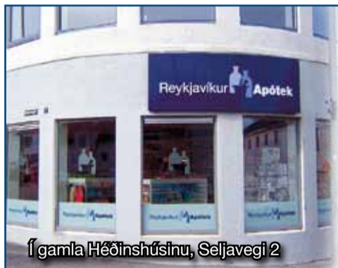
Í gamla Héðinshúsinu, Seljavegi 2

því ef troða á niður byggð á þessu svæði án nokkurrar vitnesku íbúanna um það. „Viða er verið að þétta og þrengja byggðina hér í Vesturbænum og það er eins og enginn grænn blettur megi vera ósnortinn. Á sama tíma og verið er að hvetja til sjálfbærni og græns lífsstíls er verið að leggja til að eini matjurtargarðurinn í hverfinu víki fyrir fjölmennri byggð með tilheyrandi raski, ónæði, aukinni umferð og mengun sem enginn vill búa við.”