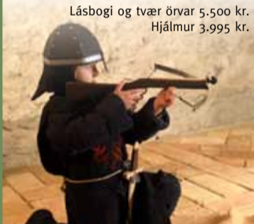
Bogi og þrjár örvar 3.990 kr.

Lásbogi og tvær örvar 5.500 kr. Hjálmur 3.995 kr.