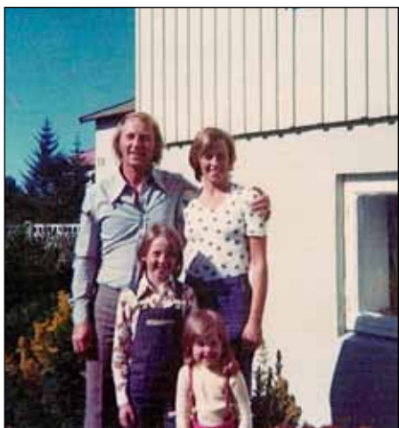
Við fjölskyldan fyrir utan Nesveg 64. Það glittir í Nesveg 70 en þar áttum við eftir að búa lengi síðar.