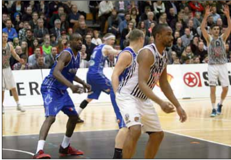
Frá einum undanúrslitaleik KR-inga gegn Stjörnnunni

Úrslitakeppnin hefst í Frostaskjólínu mánudaginn 21. apríl, sem er annar í páskum, og síðan er leikið á heimavelli Grindavíkinga eða Njarðvíkinga, eftir því hvort liðið kemst áfram, föstudaginn 25. apríl og síðan mánudaginn 28. apríl í Frostaskjóli. Síðan heldur þetta áfram ef ekki hafa þá fengist úrslit, en þrjá sigra þarf til að verða Íslandsmeistari karla í körfubolta 2014.