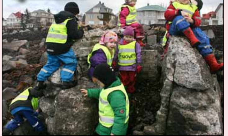
Leikskólabörn frá leikskólanum Jöfra voru fyrir skömmu í fjöruferð og rannsóknarleidangri um náttúruna neðan Ægisíðu.