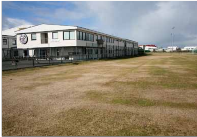
KR-völlurinn lítur ekkert sérstaklega vel út þessa dagana en líklega verður hann kominn í leikhæft ástand þegar KR-ingar mæta Val í fyrsta leik Íslandsmeistarans í byrjun maímánaðar.

Eftir árgangamótið klæða menn sig svo í sparifötin, í þetta sinn er KR búningurinn ekki sparifötin, heldur hin sparifötin í skápnunum. Menn skunda þá saman niður á Hallveigarstíg þar sem herrakvöld KR fer fram með miklum glæsibrag. Þar má enginn sannur KR-ingur láta sig vanta.