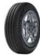
Michelin Primacy 3

Bíllinn nýtur sín best á hjólbörðum af bestu gerð. Þú færð hágæðahjólbörða frá Michelin á hjólbörðaverkstæðum N1 sem öll hafa hlotið vottun samkvæmt gæðakerfi Michelin.