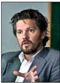
Dagur B. Eggertsson.

Dagur B. Eggertsson borgarstjóraefni Samfylkingarinnar í Reykjavík