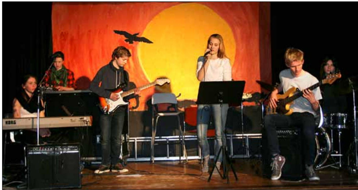
Tónlistarfólk tróð upp í aðalsal Hagaskóla og skemmti viðstöddum.

búa við stríðsástand og í flóttamannabúðum og umræður um gildi menntunar voru gríðarlega góðar. Krökkunum fannst sérstaklega mikilvægt að styrkja skólabyggingu/menntun þar sem mest er þörf þar sem menntun er ein að grunnstöðum samfélagsins. Ákveðið var að láta ágóða góðgerðardagsins renna til barna í Sýrlandi sem eiga um sárt að binda.