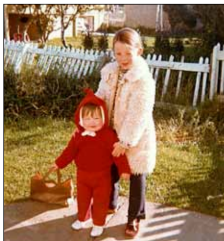
Við systurnar fyrir utan Nesveg 64, ábyrgðartilfinningin skín af mér, 7 árum eldri og tilbúin í pössunarhlutverkið.