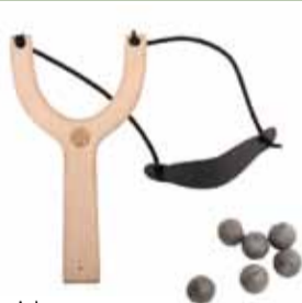
Teygjubysa og tíu mjúkar kúlur 2.500 kr.

Sverð 1.750 kr. Sverð í slíðri 2.995 kr. Fleiri stærðir af sverðum til.