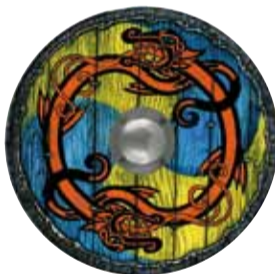
Skjöldur 3.990 kr.

Lásbogi og tvær örvar 5.500 kr. Hjálmur 3.995 kr.