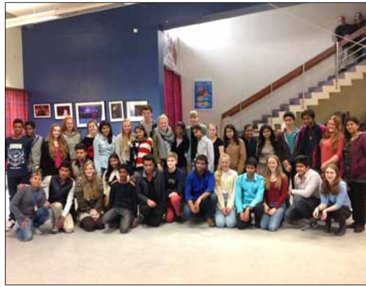
Nemendur Hagaskóla og Ryan School International samankomnir.