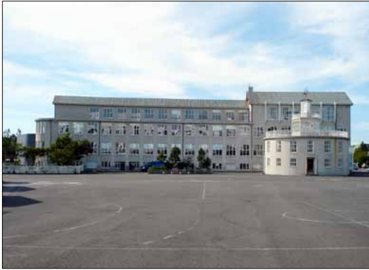
Glæsileg bygging Melaskóla en er barn síns tíma og þarfnast nú eðlilegs viðhalds.