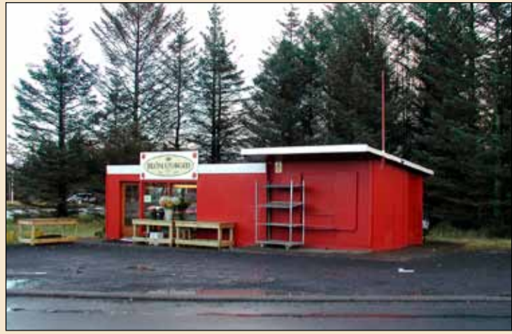
Eigandi Blómatorgsins hefur sótt um leyfi til að byggja átthyrnt hús fyrir blómaverslunina í stað þessara gömlu skúra.

Reykjavíkurborgar kom fram að Melaskóla verði tekin fyrir hjá skóla- og frístundarsviði innan skamms og beiðni um bættan aðbúnað rædd þar. Nefndi hann að nú væri jafnframt óskað eftir þremur kennslustofum en sé ekki vitað hvar þær eiga að vera og hvort það sé önnur lausn í boði en að fjölga stofum. Ljóst var á fundinum að margir foreldrar eru óþreijufullir eftir því vanda að skólans verði veitt athygli og hafist verði handa um áætlun til þess að bæta úr ástandi hans.