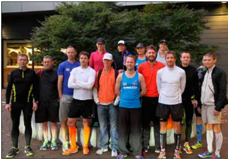
Þátttakendur í skokkhópi KR í Amsterdam.

Dvalið var á hóteli sem er staðsett í þriggja kílómetra fjarlægð frá Ólympíuleikvangnum þar sem hlaupið átti að hefjast og byrjaði hópurinn á því að nálgast mótsgögn og skoða sig um á keppnisstað. Haldin var sýning á ýmsum varningi og skipuleggjendur stórra keppnishlaupa frá öðrum borgum í Evrópu kepptust við að fanga athygli þátttakenda. Ljóst er að nóg er í boði fyrir þá sem hafa áhuga á því að ferðast til annarra landa