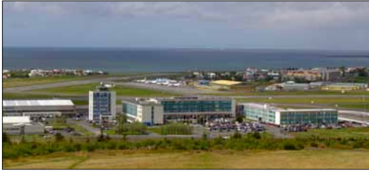
Séð yfir hluta Reykjavíkurlugvallar. Myndin tekin úr Perlunni.