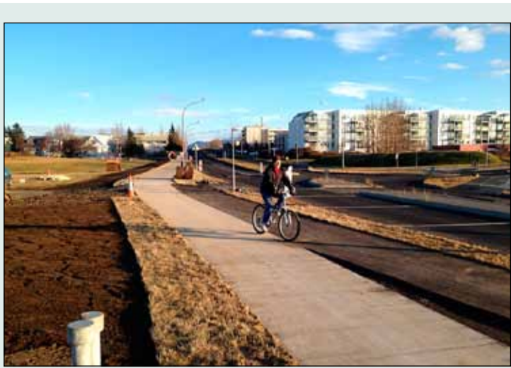
Hjólástigurinn tengir Vesturbæ og Skerjafjörð saman.