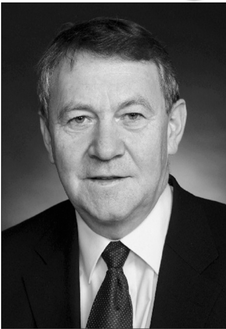
Jón Kristjánsson fyrrum alþingismaður og ráðherra.