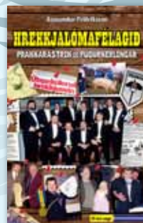
Hrekkjalómafélagið - óborganlegar sögur af hrekkjum og á stundum mjög svo óvæntum við- brögðum við þeim.