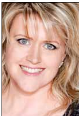
Björg Þórhallsdóttir sópransöngkona.

Á efnisskránni eru aðventu- og jólalög frá ýmsum löndum í fallegum útsetningum. Boðið verður upp heitt súkkulaði og smákökur í hléi.