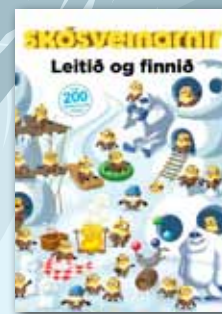
Skósveinarnir-leititið og finnið og Skósveinarnir-skáldsaga -Skósveinabækurnar hafa svo sannarlega slegið í gegn.