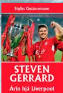
Steven Gerrard - einn besti knattspyrnumaður sinnar kynslóðar.