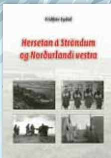
Heretan á Ströndum og Norðurlandi vestra - fræðandi bók um tímabil sem má ekki gleymast.