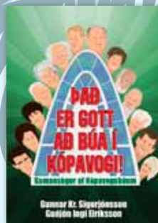
Það er gott að búa í Kópavogi! - gamansögur af Kópavogsbúum sem allir hafa gaman að.