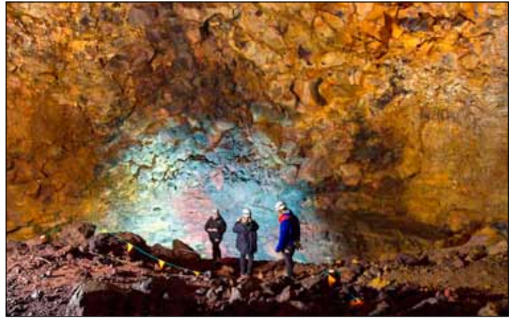
Þríhnjúkagígur er ein þeirra náttúruperla sem er í landi Seltjarnarneshrepps hins forna.

forna en með dómi hefur Héraðsdómur Reykjavíkur staðfest að það tilheyrir hinum forna hreppi eða þess hluta hans sem varð að Kópavogsbæ. Í Kópavogsbæ eru því m.a. útivistarsvæði og einnig náttúruperlur á boði við Þríhnjúka sem eru á hinu umrædda afréttarsvæði.