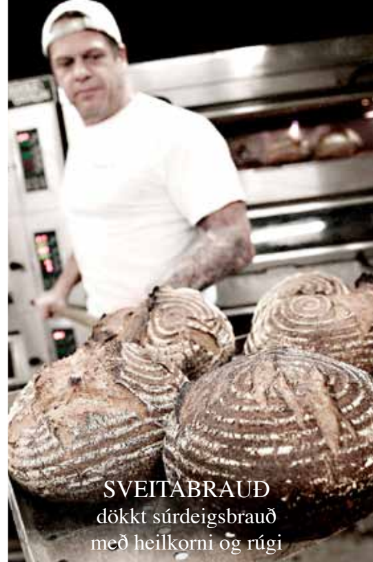
SVEITABRAUÐ dökkt súrdeigsbrauð með heilkorni og rúgi