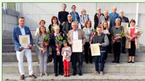
Verðlaunahafar ásamt Umhverfisnefnd Seltjarnarness.