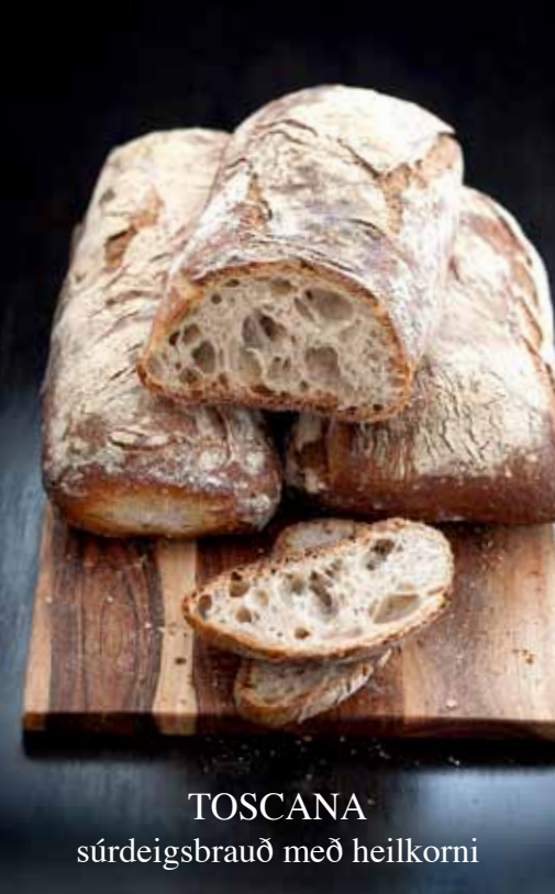
TOSCANA súrdeigsbrauð með heilkorni