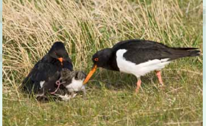
Tjaldahjón með unga í Suðurnesi, faðirinn færir unganum ánamaðk.

Tjaldur er algengur og áberandi varpfugl á Framnesi Seltjarnarness, 8-12 pör verpa að jafnaði. Hann verpir í sandi og mól, mest í Suðurnesi og sérstaklega þykja honum glompur golfvallarins góðar til varps. Þessi stóri vaðfugl sést árið um kring á Nesinu. Utan varptíma er hann sérlega hændur að leirum og fjörum, eins og Leirum í Bakkavík og víðar á Bakkagrandu, þar sem yfir 100 tjaldar hafa sést síðsumars. Vetursetufuglarnir leita jafnframt ætis í þessum fjörum. Þar taka þeir m.a. sandmaðk, sem þeir grafa eftir með löngum, sterklegum goggi. Stundum má sjá tugi fugla í slökun við Bakkatjörn.