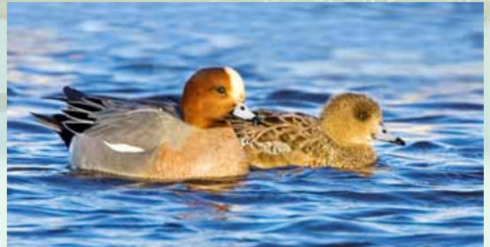
Rauðhöfðapar, steggurinn til vinstri.

Rauðhöfðaönd er buslönd eða hálfkafari, skyld stökköndinni. Hún er reglulegur gestur á tjörnnum frá hausti framá vor, en hverfur að mestu yfir hásumarið. Rauðhöfðar sjást líka á sjónum þar sem endur safnast saman á veturna, eins og við Tjarnarstíg. Stærsti hópurinn á Bakkatjörn sást í lok ágúst, 60 fuglar og í Dal í Suðurnesi, 17 um miðjan sept. Kynjamunur er töluverður hjá rauðhöfðanum, steggurinn er skrautlegur, meðan kollan er brúnflikrótt; hún þarf að liggja á hreiðrinu og þá er gott að vera felubúin. Með rauðhöfðunum er tíðum amerískur ættingi, ljóshöfðaönd, 1-2 steggir flest ár á Bakkatjörn.