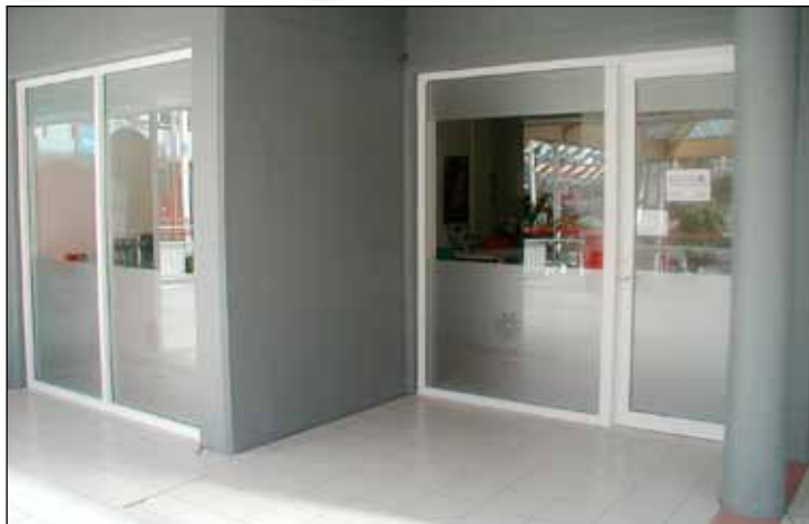
Ferðaskrifstofan Mundo er flutt á jarðhæð Eiðistorgsins við hliðina á ÁTVR.

Miði á hurð Mundo vekur athygli. Þar segir: Bíddu! Ekki fara strax! Mundo er alls ekkert venjuleg ferðaskrifstofa. Stundum eru allir