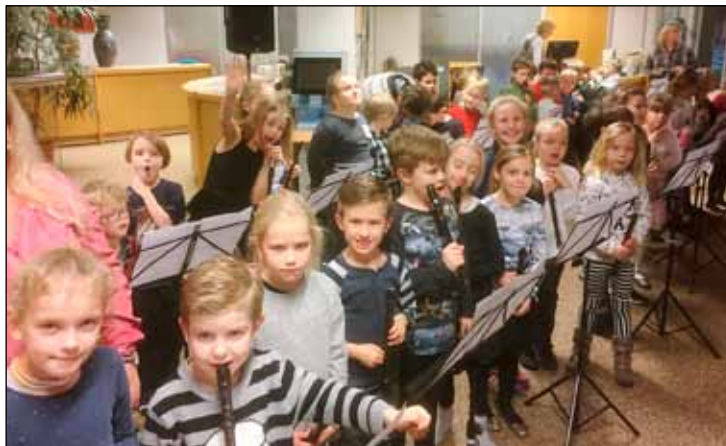
Ungir blokkflautuleikarar í Tónlistarskóla Seltjarnarnes.

Á safnanótt sem Bókasafn Seltjarnarnes stóð fyrir spiluðu flest allir blokkflautunemendur skólans nokkur lög fyrir gesti og gangandi. Einnig spilaði hljómsveit sem að