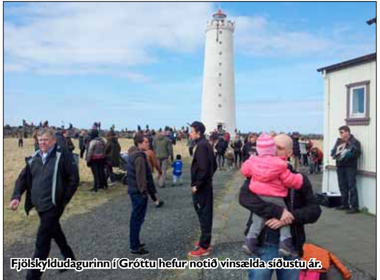
Fjölskyldudagurinn í Gróttu hefur notið vinsælda síðustu ár.