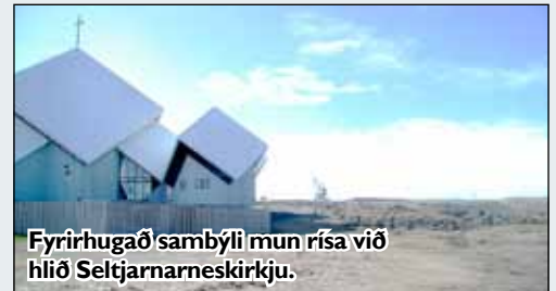
Fyrirhugað sambýli mun rísa við hlið Seltjarnarneskirkju.

Bæjarráð hefur lagt til að skipulagðar verði tvær lóðir við Kirkjubrautina þar sem umrædd bygging verði reist. Ekki liggur fyrir hvenær hafist verður handa við byggingu sambýlisins en málinu hefur þegar verið vísað til umsagnar í skipulags- og umferðarnefnd og umhverfisnefnd.