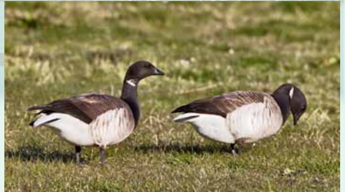
Margæsa hjón við Bakkatjörn.

Margæsin setur sterkan svip á fuglalíf á Seltjarnarnesi á vorin, þó hún sjáist einnig á haustin. Hún er umferðarfugl eða fargestur og kemur hér við á leið milli varpstöðva á Íshafseyjum Kanada og vetrarstöðva á Írlandi. Margæsin hefur hér viðdvöl í tvo mánuði á vorin en sá tími er afar mikilvægur fyrir fuglinn. Hann safnar fitu fyrir hið erfiða farflug yfir Grænlandsjökul og kvenfuglinn safnar jafnframt orku fyrir varpið. Það er enn vetur þegar fuglarnir koma á varpstað og gróður ekki farinn að spretta fyrr en ungar skríða úr eggjum. Margæsir eta bæði grænþörunga og marhálms í sjó og sækja í tún til beitar. Gæsirnar sækja t.d. á Leirur í Bakkavík, á golfvöllinn og túnin við Nes en hvílast síðan og baða sig á Bakkatjörn og á tjörninni í Dal. Yfir 500 fuglar hafa sést á Nesinu. Margæsirnar flakka milli Álftaness og Seltjarnarness og víðar um Innnesin.