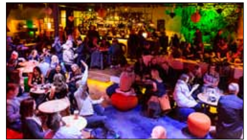
Stúdentakjallarinn er fyrir fjölskyldufólk.

þjónustuna. Auk sölu veitinga af matseðli og bar er fjölbreytt dagskrá viðburða sem höfðar til sem flestra eins og sjá má á www.studentakjallarinn.is . Risaskjór er á staðnum sem er mikið í notkun, þar sem bíómyndir eru sýndar alla daga auk flestra stórra íþróttaleikja. Stúdentakjallarinn skartar glæsilegum plöntuvegg sem einn og sér er vel heimsóknarinnar virði. Margt fjölskyldufólk kemur í Stúdentakjallarann, bæði stúdentar og aðrir, enda andrúmsloftið skemmtilegt og auðveldlega hægt að bjóða allri fjölskyldunni í mat án þess að hafa áhyggjur af reikningnum.