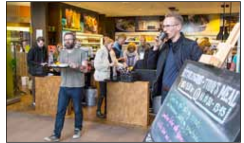
Ódýrar veitingar í Hámu.