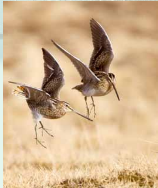
Hrossagaukur í biðildansi við Bakkatjörn 27. apríl 2013

Hrossagaukur er algengur varpfugl á Seltjarnarnesi. Hann verpir helst í móum og graslendi, bæði blautu og þurru. Hann hefur aðlagast náþýli við manninn, svipað og stelkurinn. Varpstofninn er nokkuð stöðugur, hefur verið 4-8 pör frá árinu 1955. Hrossagaukur er farfugl og sést sjaldan í hópum og þeim þá litlum. - Hrossagaukurinn er leyndardómsfullur fugl og fer oftast huldu höfði nema á vorin, þá er hann mjög hávæ, flýgur í hringi yfir óðali sínu með einkennandi „hneggi“, hljóði sem hann myndar með vængjum og stélfjóðrum. Á jörðu niðri kallar hann með raddböndunum: tjakka-tjakka-tjakka.