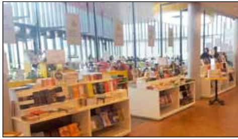
Bóksalan er eina bókabúðin í Vesturbænum.

Í Bóksölu stúdenta fást námsbækur í miklu úrvali auk alls almenns bókakosts, ritfanga og gjafavöru á frábæru verði. Lögð er áhersla á námsbækur við upphaf haust- og vorannar auk þess sem Bóksalan sérhæfir sig í sérpöntunum fyrir viðskiptavinum af öllum stærðum og gerðum. Dæmi eru um áhugamenn víða um