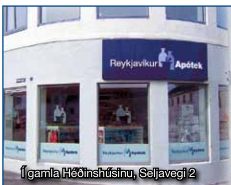
Í gamla Héðinshúsinu, Seljavegi 2