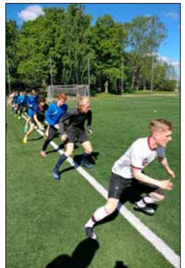
Tekið á því á æfingu.

Lokadaginn fór hópurinn á Tele2 Arena og horfði á stórleik Hammarby og Djurgården, tveggja erkifjenda frá Stokkhólmi. Fresta þurfti leiknum vegna mikils reyks frá blysum sem stuðningsmenn beggja liði kveiktu á en leikurinn