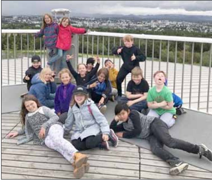
Þessar myndir voru teknar á leikjanámskeiðum á Seltjarnarnesi.