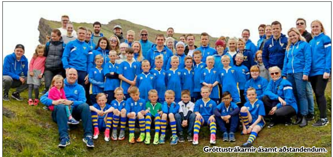
Gróttustrákarnir ásamt aðstandendum.