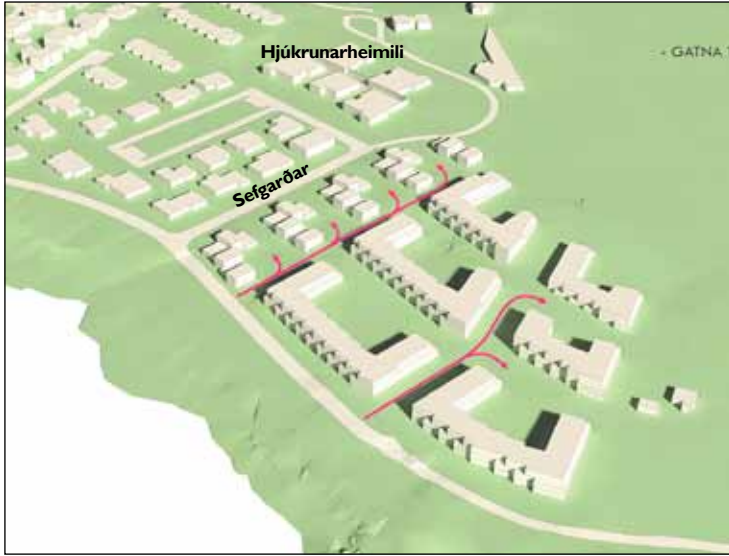
Tillögur af fyrirhugaðri byggð á Bygggarðasvæðinu.

Arkís arkitektar hefur sent frá sér breyttar tillögur að íbúðahverfi við Bygggarða á Seltjarnarnesi. Helstu markmið breytinganna eru betri tengingar við náttúru til suðurs og vesturs og rýmri svæði innan byggingarreitsins.