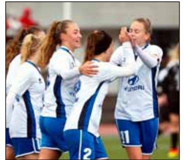
Marki fagnað hjá stelpunum.