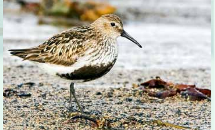
Fullorðinn lóupræll í fjöru.

Lóupræll er lítill vaðfugl, með fremur langan, lítið eitt niðursveigðan, svartan gogg. Hann er gulbrúnn og svarflikróttur að ofan, á sumrin er hann með svartan blett eða svuntu á bringunni og aftur á kvið. Lóupræll var varpfugl fyrrum, á árunum kringum 1955 urpu 3-5 pör, en 1986 aðeins eitt. Hann hefur ekki fundist verpandi á þessari öld, en þó varð vart við syngjandi fugl nú í sumar. Breytingar á búsvæðum lóupræls, votlendi og óræktarmóum, hefur væntanlega valdið þessari fækkun. – Lóuprællinn er algengur fargestur, hann sést bæði í fjörum og við tjarnir, þar sem hann er sérstaklega áberandi síðsumars. Hann fer að sjást um miðjan apríl og sést fram í október, þó mest sé af honum í júlí og ágúst. Stærsti hópurinn var á Bakkatjörn 4. ágúst 2011, 500 fuglar.