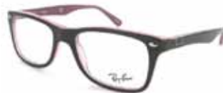
Ray-Ban 5228-2126 umgjörð kr. 22.900,-