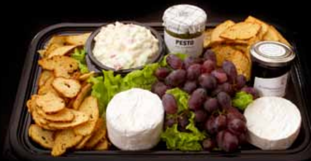
OSTA- OG SALATBAKKI Fyrir 10-15 manns. VERÐ 7.950 KR.