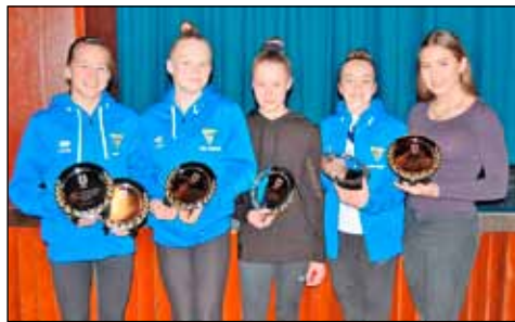
Bikarameistarar í fimleikum.