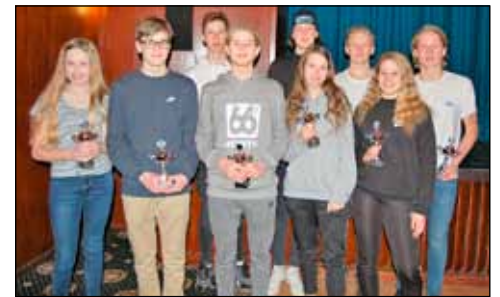
Ungt og efnilegt íþróttafólk á Seltjarnarnesi.