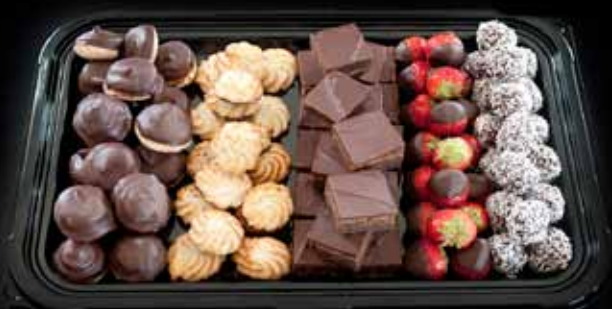
SÆTUR BAKKI 1 90 BITAR VERÐ 15.900 KR.