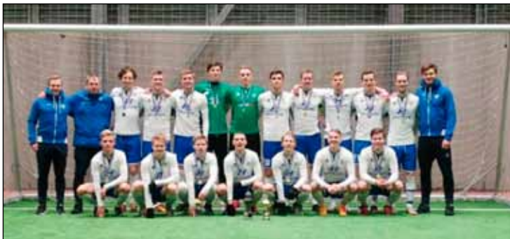
Meistaraflokkur karla í knattspyrnu.

Meistaraflokkur karla lék í B-deild Fótbolta.net mótsins í janúar og febrúar. Fyrsta leiknum við 1. deildarlið Njarðvíkur lauk með 1-1 jafntefli í Reykjaneshöllinni og í kjölfarið fylgdu góðir sigrar á Víkingi Ó og Aftureldingu.