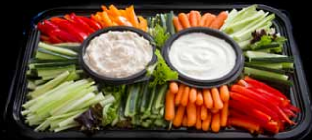
GRÆNN BAKKI Fyrir 15-20 manns. VERÐ 5.950 KR.