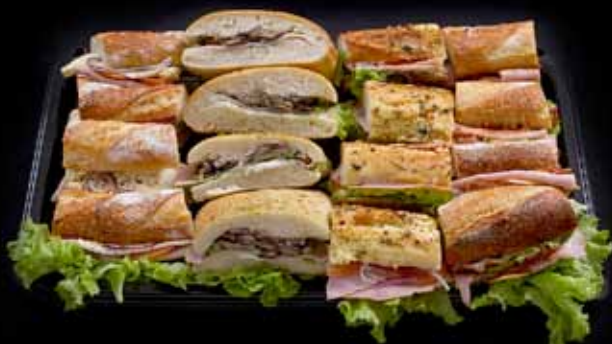
SAMLOKUBAKKI Fyrir 6-8 manns - 4 tegundir. 2 beikon, 2 kalkún, 2 ólífur, 2 Brie. VERÐ 7.900 KR.

Skoðaðu úrvalið í nýrri vefverslun www.joifel.is