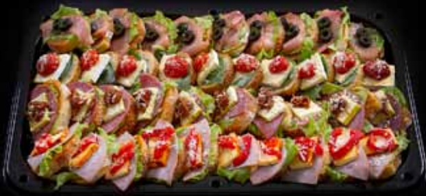
SNITTUBAKKI 4 tegundir, 10 stk. af tegund VERÐ 13.000 KR.