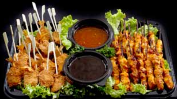
SPJÓTBAKKI 24 rækjuspjót með chilísósu 24 kjúklingaspjót með teriyakisósu VERÐ 14.900 KR.