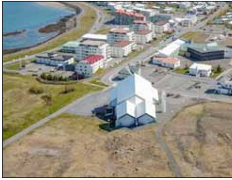
Hugmyndir er um að útbúa kirkjugarð vestan megin við Seltjarnarneskirkju.