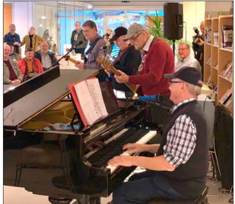
Hljómsveitin Sóló að spila fyrir gesti í Bókasafni Seltjarnarness.