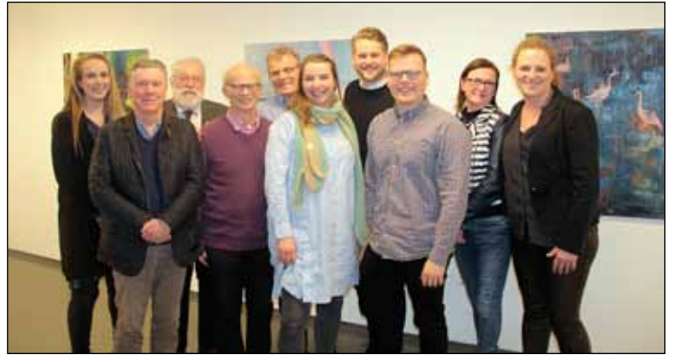
Frambjóðendur Samfylkingarinnar á Seltjarnarnesi.

- við bæjarstjórnarkosningar á Seltjarnarnesi