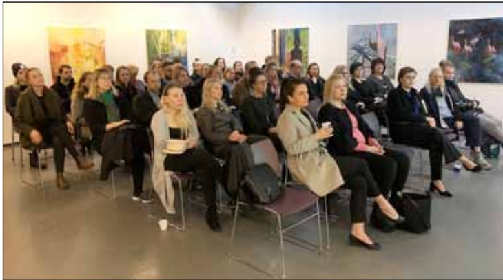
Frá fundinu sem haldinn var í Bókasafni Seltjarnarness.

Foreldrar leikskólabarna á Seltjarnarnesi fjölmenntu á fund um leikskólamála á Bókasafni Seltjarnarness 21. mars. Yfirskrift fundarins var Eru vinnudagar barnanna okkar of margir og of langir?