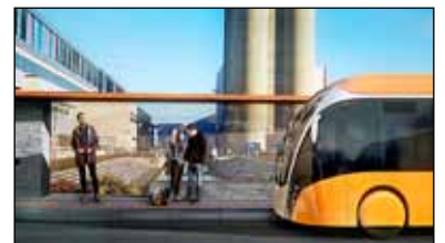
Hugmynd að stoppistöð Borgarlínu.

Bæjarstjórn Seltjarnarnesbæjar hefur samþykkt afgreiðslu bæjarráðs á breytingu á svæðisskipulagi Höfuðborgarsvæðisins 2040 þar sem skilgreindir eru samgöngu- og þróunarásar. Skipulagið gerir ráð fyrir svokallaðri borgarlínu. Samkvæmt svæðisskipulaginu nær borgarlínan að sveitarfélagamörkum Reykjavíkur og Seltjarnarness þar sem bæjarstjórnin hafði áður hafnað því að hún næði inn á Nesið.