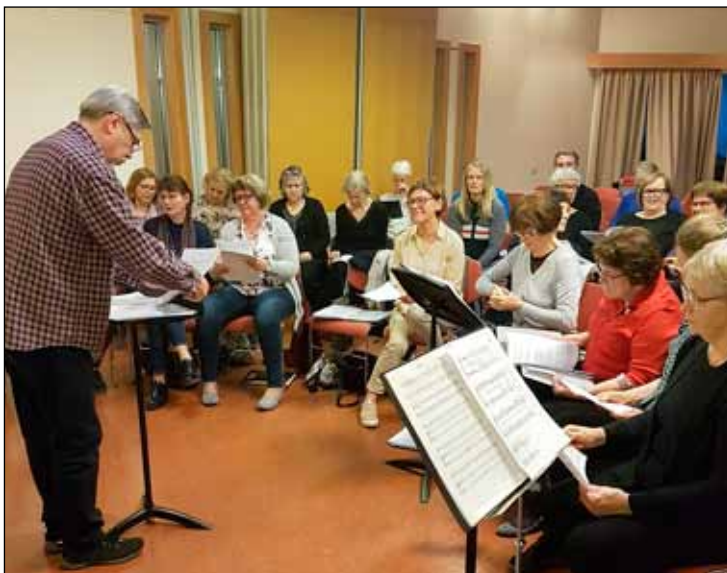
Selkórinn á æfingu.