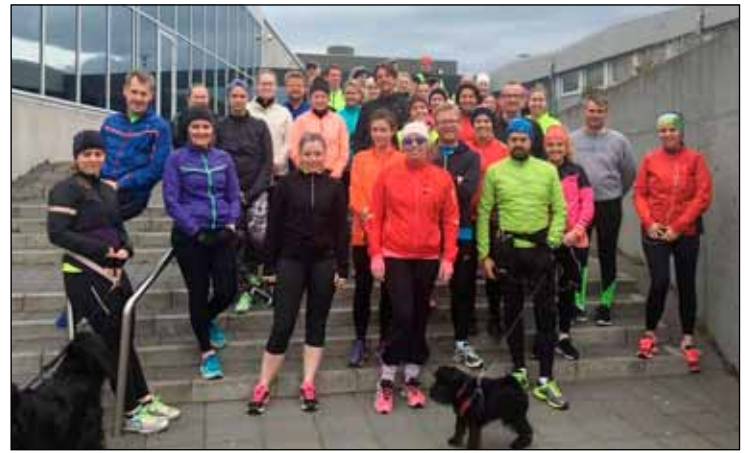
Trimmklúbbur Seltjarnarness (TKS) er elsti hlaupaklúbbur landsins.