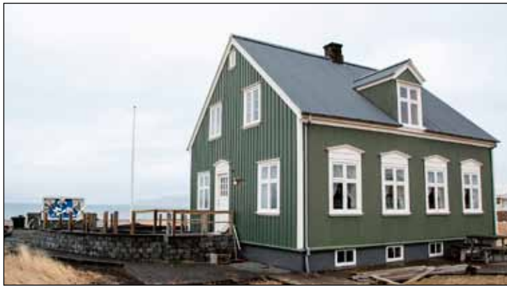
Saga Ráðagerðis er löng og var það skráð sem hjáleiga frá stórbýlinu Nesi í manntalinu árið 1703.