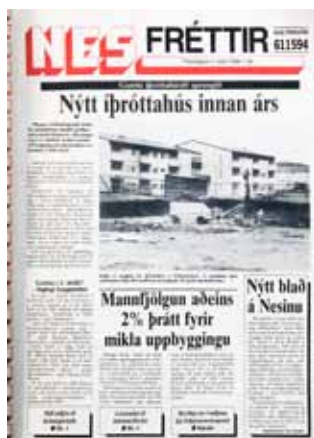
Fyrsta tölublað Nesfrétta sem kom út í mars 1988.