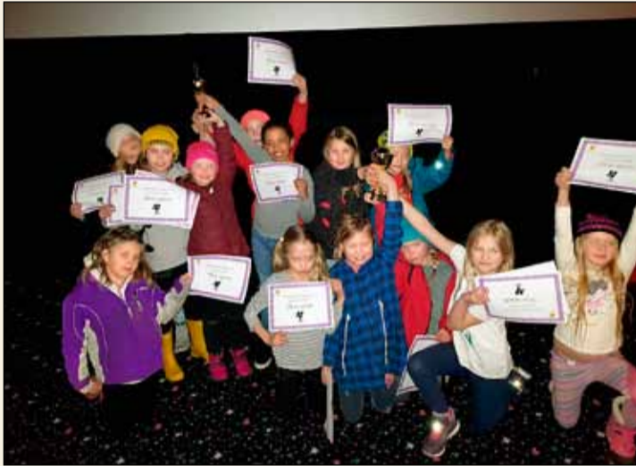
Ungt kvikmyndagerðarfólk með viðurkenningar sínar.

Kvikmyndahátíðin Filman var haldin fimmtudaginn 26. apríl í Sambíóunum Álfabakka, en þar voru sýndar stuttmyndir eftir börn í 3. og 4. bekk á frístundaheimilum í Breiðholti.