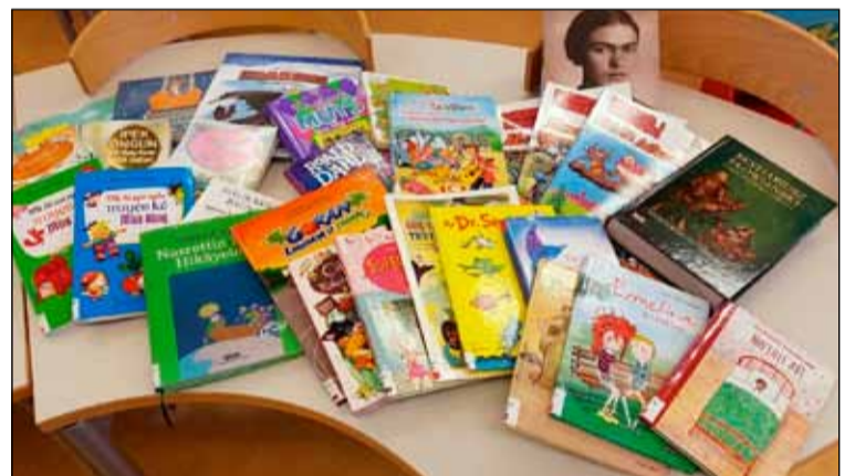
Sýnishorn af erlendum bókum sem Hólabrekkuskóla hafa borist.

Þetta hefur gefið góða raun og höfum við fengið bækur á: ensku, dönsku, pólsku, þýsku, spænsku, króatísku, hollensku, tyrknesku, víetnömsku, taílensku, japönsku og grænlandsku. Þetta hefur komið sér vel þar sem uppruni nemenda er fjölbreyttur og viljum við stefna að því að eiga einhverjar bækur á móturmáli sem flestra. Enn vantar mikið upp á sett markmið, en með hverri