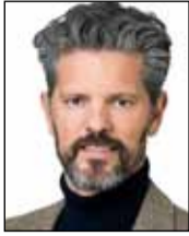
Dagur B. Eggertsson.

Þau eru ófá verkefni sem verið hafa á borði borgarstjóra og tengjast Breiðholtinu. Segja má að Breiðholtið hafi verið í ákveðnum forgangi hjá Reykjavíkurborg undanfarin ár. Skólaalóðir hverfisins voru fyrstar í röðinni þegar kom að endurgerð þeirra. Unnið hefur verið heildstætt hverfaskipulag fyrir hverfið. Þjónustumiðstöð Breiðholts er í fremstu röð. Gerðuberg hefur fengið andlitslyftingu og unnið er eftir tímamótasamningi um stórfellda uppbyggingu íþróttamannvirkja ÍR sem gerður var á kjörtímabilinu.