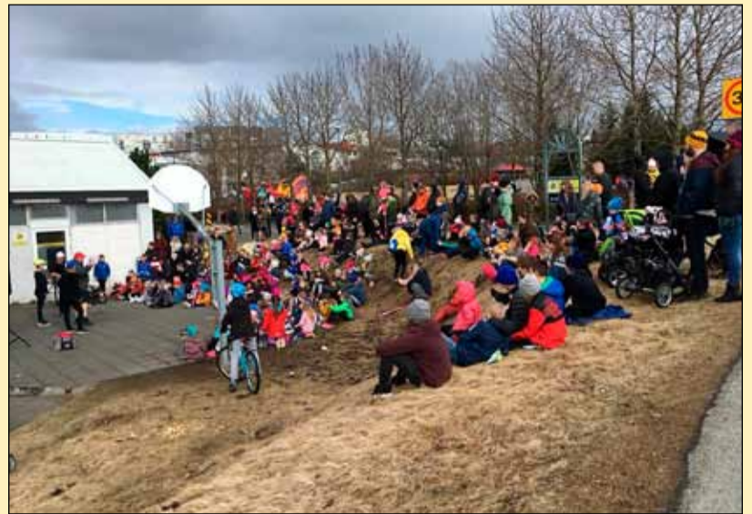
Fjöldi krakka mætti á sumardagsskemmtunina í Hólmaseili.

Frístundamiðstöðin Miðberg óskar Breiðhylltingum gleðilegs sumars.