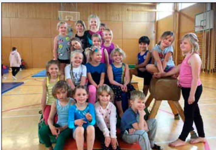
Fimleikastúlkur úr ÍR.