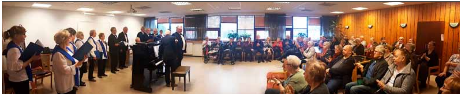
Gerðubergskórinn syngur við opnum vorsýningarinnar í Gerðubergi.