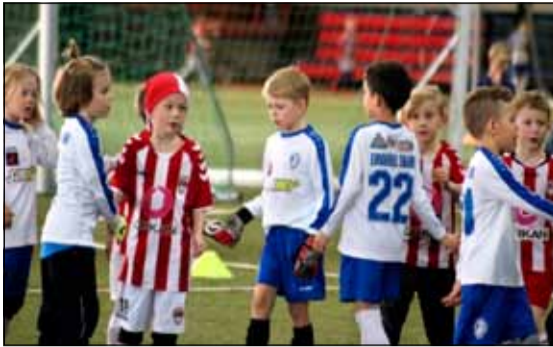
Frá Hlynsmótinu á sumardaginn fyrsta.

Að mótinu stóðu Knattspyrnudeild ÍR í samstarfi við foreldra drengja í 7. flokki. Líkt og undanfarin ár tókst vel til en þetta var í 9. sinn sem mótið var haldið. Strákarnir úr meistaraflokki ÍR tóku að sér dómgæslu á mótinu og foreldrar sáu um veitingasölu. Það voru hátt í 300 efnilegir knattspyrnuleikmenn sem tóku fagnandi á móti sumrinu og gáfu tóninn fyrir fótboldsumarið, ekki ólíklegt að einhverjir þeirra eigi eftir að láta til sín taka á stórmótum í framtíðinni.