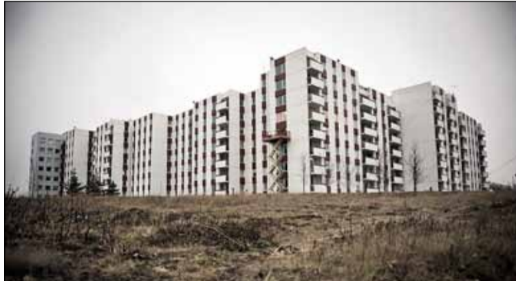
Asparfelli 2 til 12 þar sem íbúar ætla að opna heimili sín fyrir gestum Listahátíðar.

Þessir viðburðir eru ljósmyndasýning Spessa, danspartý í Asparfelli og tónleikar í Ölduselslaug. Breiðholt Festival býður gestum Listahátíðar að fljóta um í Ölduselslaug og hlusta á tónlist sem streymir úr hátölurum undir vatnsyfirborðinu. Tónverkin eiga það sameiginlegt að hafa verið samin fyrir kvikmyndir og sjónvarpsþætti af íslenskum tónskáldum sem tengjast Breiðholti með ýmsum hætti. Eftir sundsprettinn er tilvalið að gæða sér á veitingum á alþjóðlega matarmarkaðnum sem verður á sundlaugarbakkanum. Þá verður boðið í alvöru blokkarpartý því íbúar blokkarinnar í Asparfelli 2 til 12 ætla að bjóða gestum Listahátíðar í danspartý á heimilum sínum. Húsráðendur ætla að opna