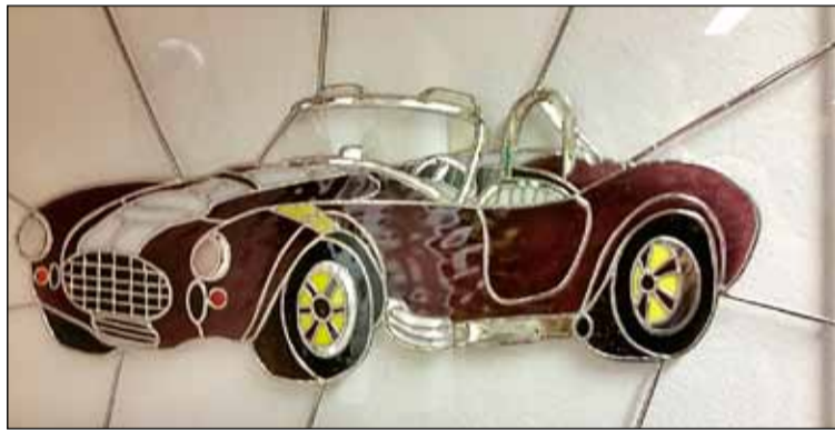
Snjall þátttakandi í félagsstarfinu og einnig glerlistamaður og áhugamaður um bíla hefur gert nokkrar bímyndir. Hér er ein þeirra.

vorum með trjádrumba og einnig blóm í bakgrunni sýningarmunanna. Held að tekist hafi að vekja glæsilega sýningu til lífsins.”