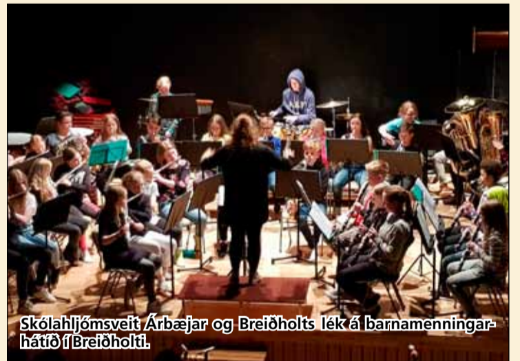
Skólahljómsveit Árbæjar og Breiðholts lék á barnameningarhátíð í Breiðholti.

Tónleikarnir, sem voru liður í Barnameningarhátíð í Reykjavík, eru afrakstur tónlistarverkefnis á frístundaheimilunum í vetur. Á tónleikunum, sem voru vel sóttir, lék hljómsveitin undir söng barnanna, auk þess sem hún lék nokkur lög. Var þetta geysilega vel heppnaður viðburður og vonandi upphaf að frekara samstarfi frístundaheimila Miðbergs og Skólahljómsveitar Árbæjar og Breiðholts.