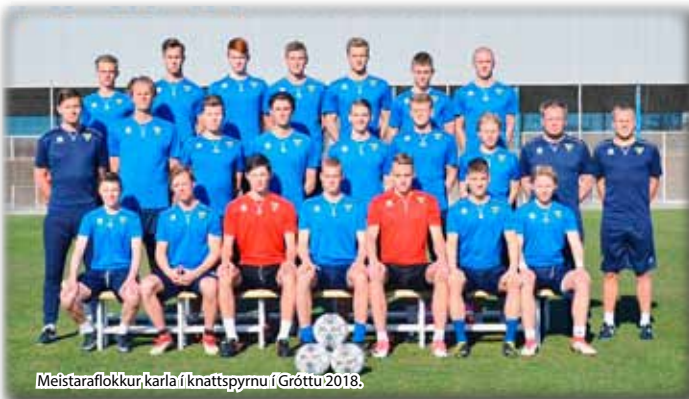
Meistaraflokkur karla í knattspyrnu í Gróttu 2018.