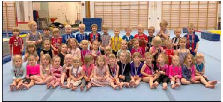
Ungir fimleikakrakkar úr Gróttu.

Forskráning í fimleikadeild Gróttu fyrir næsta vetur stendur nú yfir. Hún hófst 1. júní og stendur til 30. júní næst komandi á https://grotta.felog.is/ . Vegna framkvæmda við íþróttamiðstöðina verður mögulega að takmarka iðkendafjölda fyrir næsta tímabil. Þeir iðkendur sem æfðu í vetur og eru fæddir 2012 og fyrr eru í forgangi verði þeir skráðir í forskráningu.