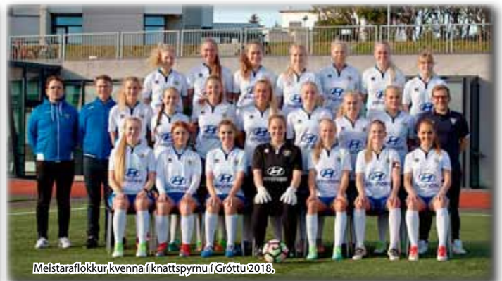
Meistaraflokkur kvenna í knattspyrnu í Gróttu 2018.