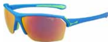
Cébé Wild 7 sólgleraugu kr. 21.900,-