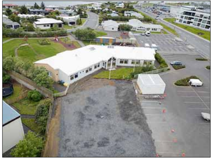
Leikskólinn á Seltjarnarnesi.

Þessa dagana er unnið að því að reisa smáhýsi við leikskólann á Seltjarnarnesi. Áætlað er að húsin komi til landsins seinni partinn í ágúst. Eftir það mun taka um viku til 10 daga að ganga frá þeim þannig að hægt verði að hefja leikskólastarf þar í byrjun september.