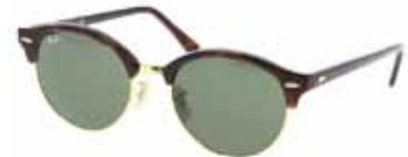
Ray-Ban Clubround sólgleraugu kr. 27.900,-