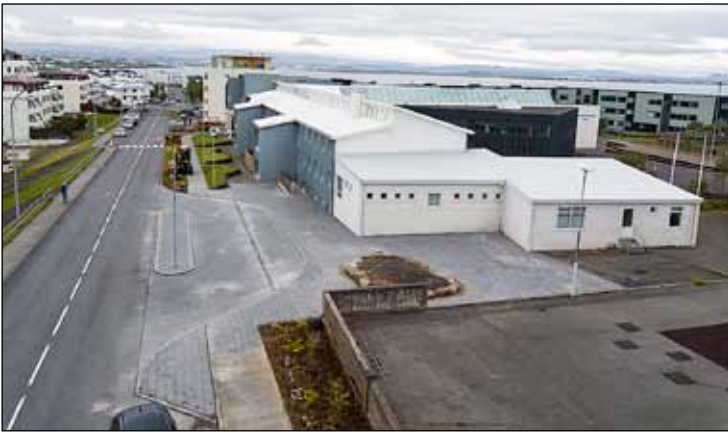
Nýja aðkeyrslan við Mýró.