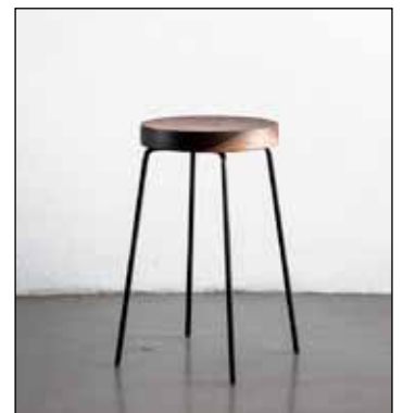
Kollur eftir AGUSTAV.

Þess má geta að haldnar verða gluggasýningar á skrifstofu HANDVERKS OG HÖNNUNAR á