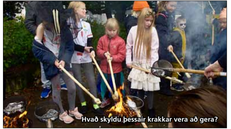
Hvað skyldu þessair krakkar vera að gera?