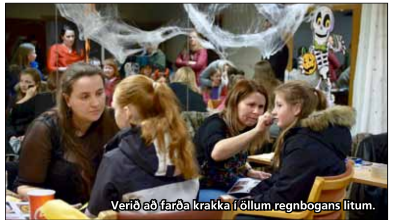
Verið að farða krakka í öllum regnbogans litum.

Eins og sjá má á meðfylgjandi myndum var mikið um dýrðir á Hrekkjavökuhátíðinni og skemmtu börn, foreldrar, starfsfólk og aðrir viðstaddir sér konunglega. Margir lögðu og mikinn metnað í skrautlega og skemmtilega búninga sem hæfa tilefninu. Starfsfólk Miðbergs þakkar öllum sem litu við kærlega fyrir frábæran dag.