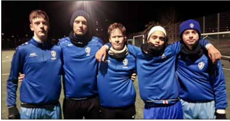
Þessir fimm strákar frá ÍR eru að fara að skoða aðstæður hjá Malmö FF.