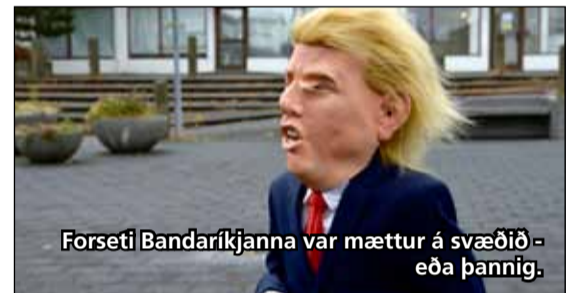
Forseti Bandaríkjanna var mættur á svæðið eða þannig.