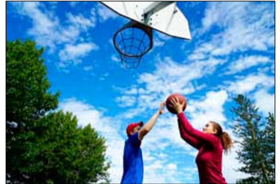
Íbúar Bakkahverfisins vilja fá körfuboltavöll við Dverga- og Blöndubakka.

Í Breiðholti voru valin verkefni: Bæta umhverfi grenndarstöðva. Byggja fjölnota hreysti- og klífur-svæði. Vinna áfram við göngustíg við Skógar-sel. Malbika hluta göngustígs frá Engjaseli að Seljaskógum. Setja upp mislæga körfuboltakörfu við Breiðholtsskóla. Mála yfir veggjakrot í Breiðholti og breyta því í abstrakt myndir. Gera hjóla- og kerrustíg frá Álfabakka að Brúnastekk. Bæta göngustígana á útivistarsvæðinu á Selhrygg. Endurgera sparkvöll við Engjasel. Setja upp fótboltaþönnur á völdum stöðum í Breiðholti. Færa leikkastalann til baka á skólalóð Ölduselsskóla. Gróðursetja ávaxtatré og berjarunna. Setja upp hjólabraut á völdum stað í Breiðholti. Betrumbæta