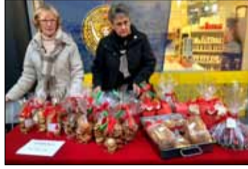
Þessi mynd var tekin af tveimur Sproptimistasystur á kökubasar á liðnu ári. Kökurnar verða ekki síður áhugaverðar í ár.

Fjölbreytnin í klúbbunum felst m.a. í því að þeir eru starfsgreindir