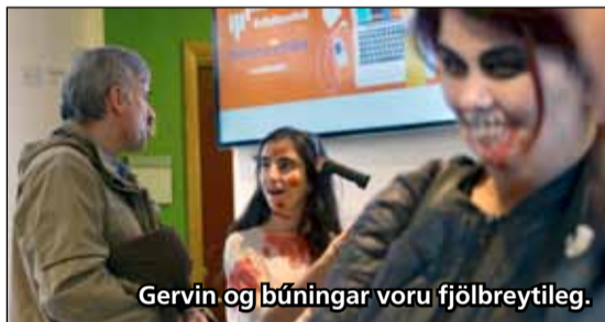
Gervin og búningar voru fjölbreytileg.