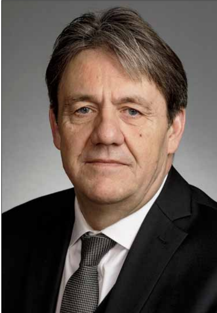
Óli Björn Kárason alþingismaður.