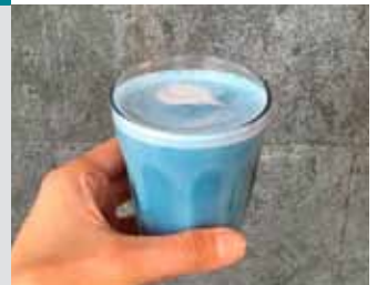
BLÁR DRYKKUR Á BODEFNABARNUM GEGN BLÚS