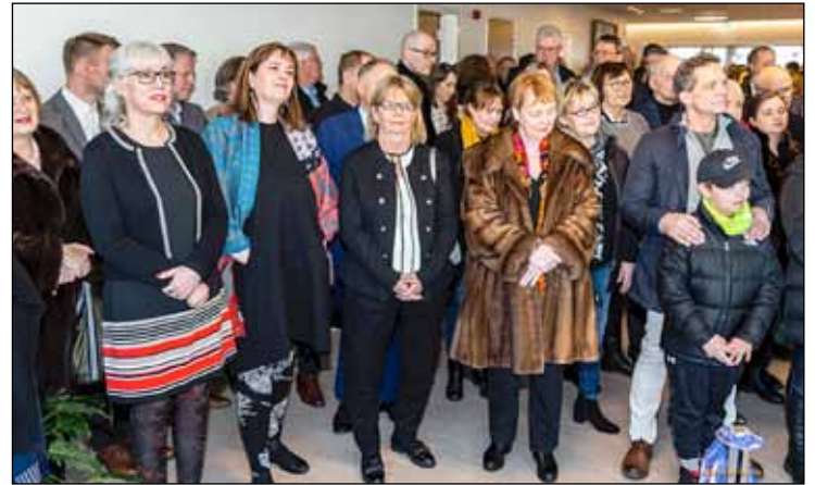
Mikið fjölmenni var viðstatt vígsluathöfn hjúkrunarheimilisins.