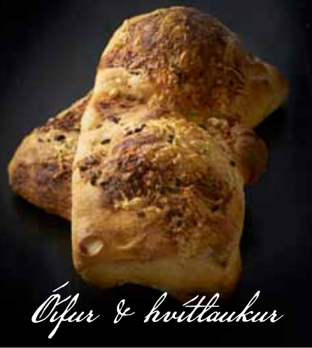
Ólífur & hvíttlaukur