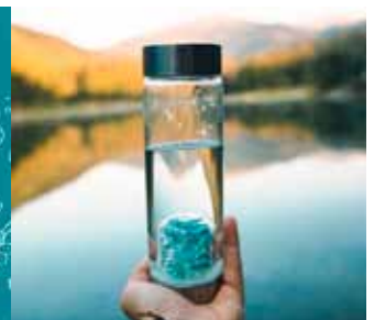
Kristalsvatnsflöskur & kristallar