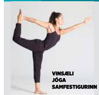
VINSÆLI JÓGA SAMFESTIGURINN