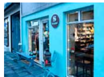
Þar sem andinn býr í efninu