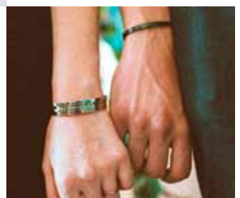
Möntrubönd í úrvali