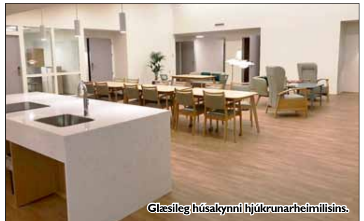
Glæsileg húsakynni hjúkrunarheimilisins.

Ásgerður bæjarstjóri og Svandís heilbrigðisráðherra glaðar í bragði á þeim ánægjulegu tímamótum þegar hjúkrunarheimilið SELTJÖRN var vígt laugardaginn 2. febrúar 2019.