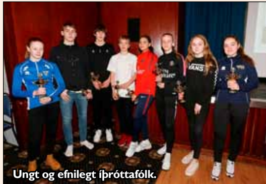
Ungt og efnilegt íþróttafólk.