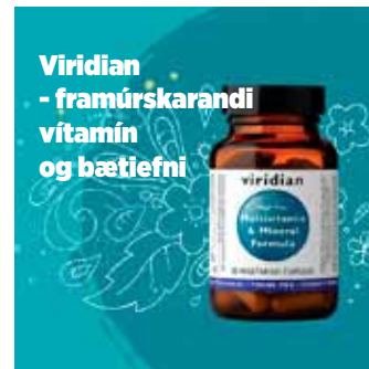
Viridian - framúrskarandi vítamín og bætiefni