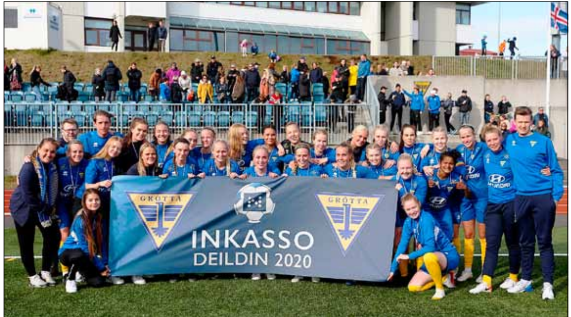
Sæti fagnað í Inkasso-deildinni.