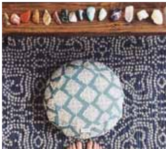
Jógavörur í úrvali.