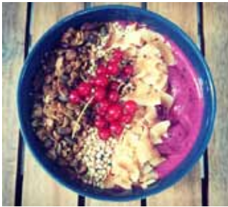
Allskonar safarikir grautar.