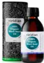
Vara ársins hjá Viridian. Törfaolían.