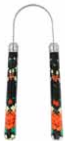
Tunguskafa er 2 x mikilvægari en tannbursti. Litir fyrir alla fjölskylduna.