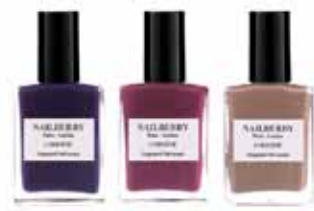
Haustlitirnir frá Nailberry eru vegan og vænir.