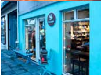
Þar sem andinn býr í efninu.