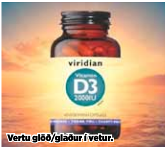
Vertu glöð/glaður í vetur.