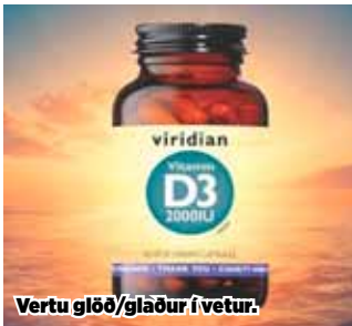
Vertu glöð/glaður í vetur.