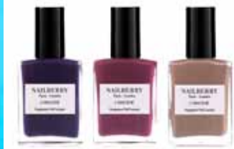
Hautlítmir frá Nailberry eru vegan og vænir.