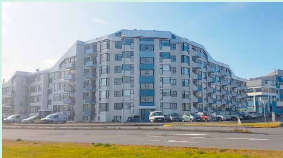
Viðurkenning fyrir endurbætur á eldra húsnæði fékk húsfélagið að Eiðistorgi 1-9.