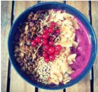
Allskonar safarikir grautar.