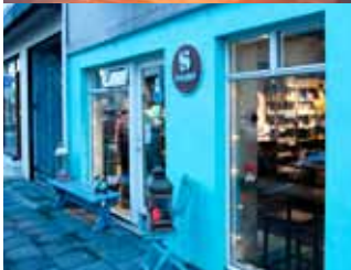
Þar sem andinn býr í efninu.