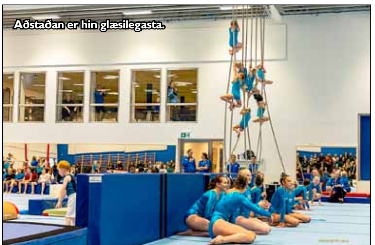
Aðstaðan er hin glæsilegasta.