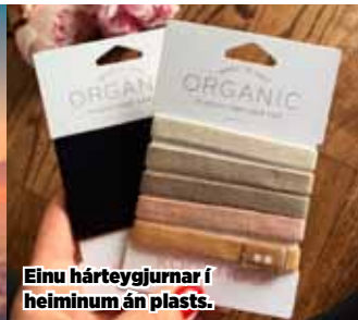
Einu hártreygjurnar í heiminu án plast.