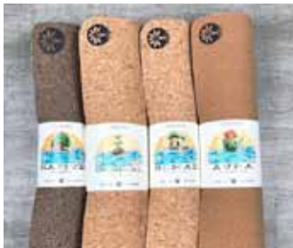
Jógadýnur úr korki eru framtíðin. Frábær gæðl.