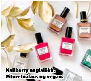
Nailberry naglalökk, Eiturfriðlaus og vegan.