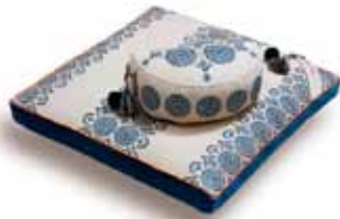
Hugleiðslupúðar og mottur. Einstök fegurð.