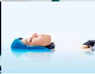
Við heiðrum Flothettuna.