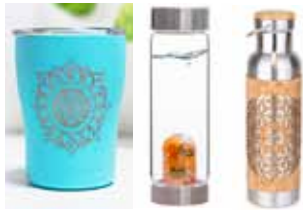
Möntrubollar, kristalsvatnsflöskur og korkbrúsar.