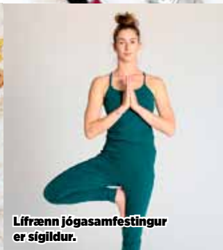
Lífrænn jógasamfestingur er sigildur.