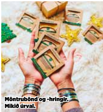
Möntrubönd og -hringir. Mikil úrval.