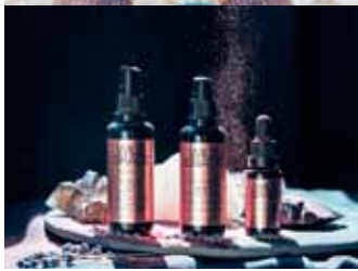
Wild Grace húðlínan er ný og mögnuð.