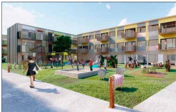
Tölvumynd af fyrirhuguðum byggingum við Bygggarða.