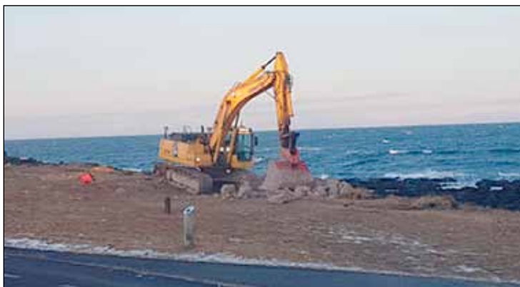
Unnið með skurðgröfu við að laga skörðin sem myndast hafa í garðinn.

Nú standa yfir viðgerðir á sjóvarnargarðinum við Norðurströnd á Seltjarnarnesi, rétt hjá hákarlahjallinum. Heildarlengd sjóvarna sem verða endurnýjaðar er um 220 metrar.