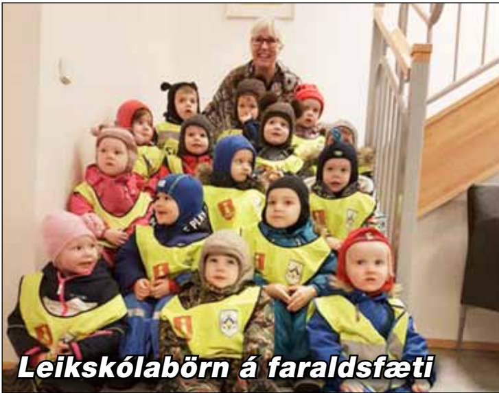
Þessi flotti hópur úr Holti heimsótti bæjarskrifstofunnar.

Börn í Leikskóla Seltjarnarness brugðu sér af bæ í tilefni dags leikskólans sem haldinn var hátíðlegur í leikskólum landsins fimmtudaginn 6. febrúar. Börnin heimsóttu hinar ýmsu stofnanir á Seltjarnarnesi. Hópa leikskólabarna mátti meðal annars sjá í hjúkrunarheimilinu Seltjörn, Valhúsaskóla, í þjónustukjarna við Skólabraut og á bæjarskrifstofum Seltjarnarnesbæjar.