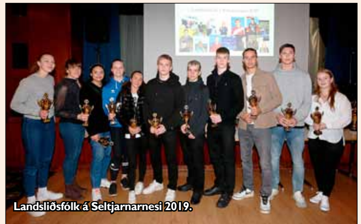
Landsliðsfólk á Seltjarnarnesi 2019.