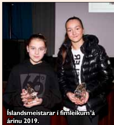
Íslandsmeistarar í fimleikum á árinu 2019.