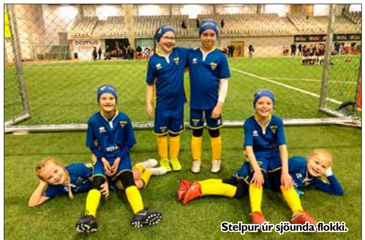
Stelpur úr sjöunda flokki.

Þrjátíu stelpur úr 7. flokki kvenna spiluðu á fótboltamóti Auðar og HK laugardaginn 18. janúar.