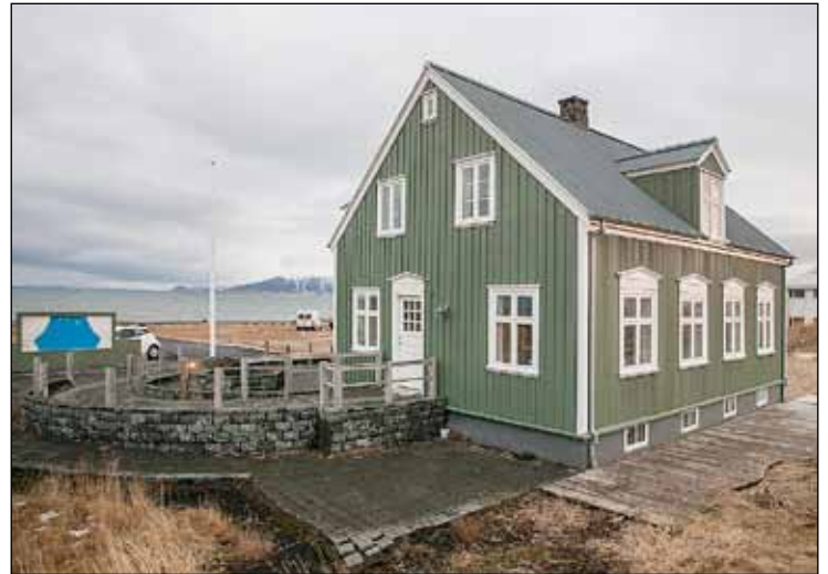
Ráðagerði á Seltjarnarnesi.