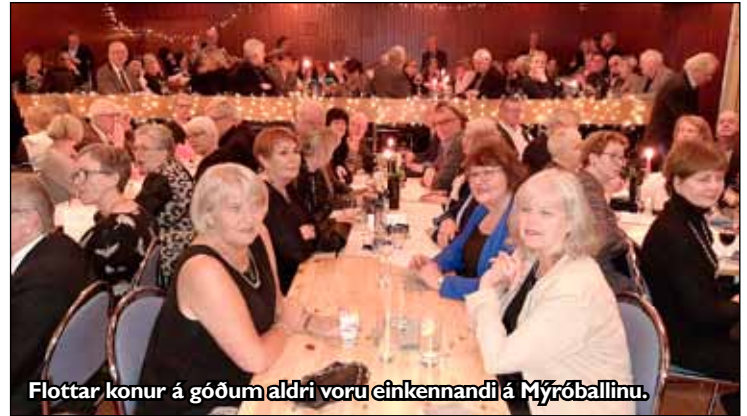
Flottar konur á góðum aldri voru einkennandi á Mýróballinu.

Seltirningar verða líkt og aðrir íbúar á vesturhluta höfuðborgarsvæðisins að setta sig við þær umferðaræðar sem eru til staðar. En eru þeir fangar Reykjavíkur?