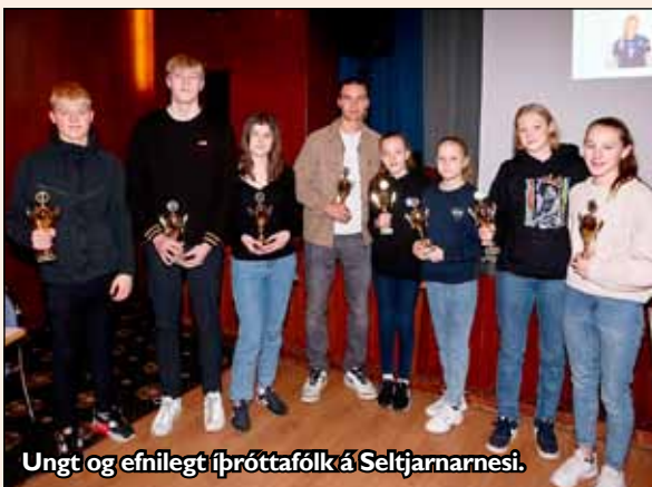
Ungt og efnilegt íþróttafólk á Seltjarnarnesi.