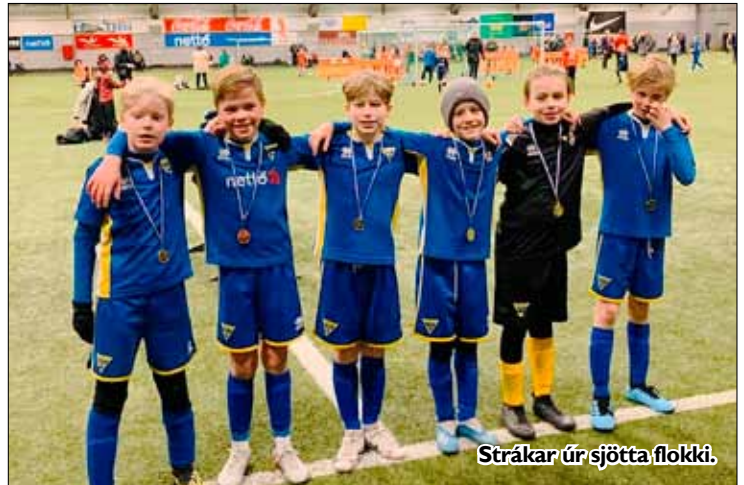
Strákar úr sjötta flokki.

Sjötti flokkur karla skellti sér á Njarðvíkurmótið í byrjun febrúar. Gróttu tefldi fram fimm liðum á mótinu en spilað var í Reykjaneshöllinni.