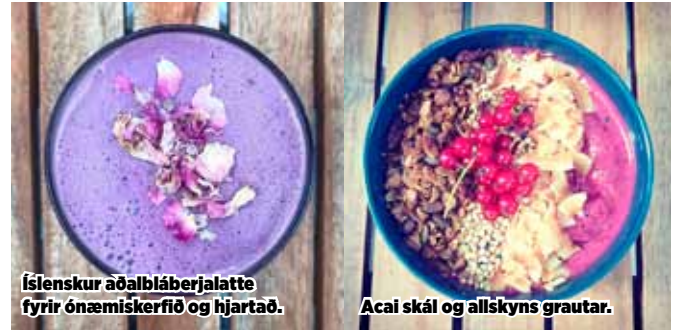
Íslenskur aðalbláberjalatte fyrir ónæmiskerfið og hjartað.

Mikið úrval. Einstök gæði. Sterk siðvitund.