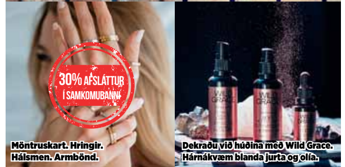
Möntruskart. Hringir. Hálsmen. Armbönd.