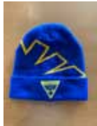
Gróttu Húfa kr. 2.500