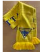
Gróttu Trefill kr. 3.000