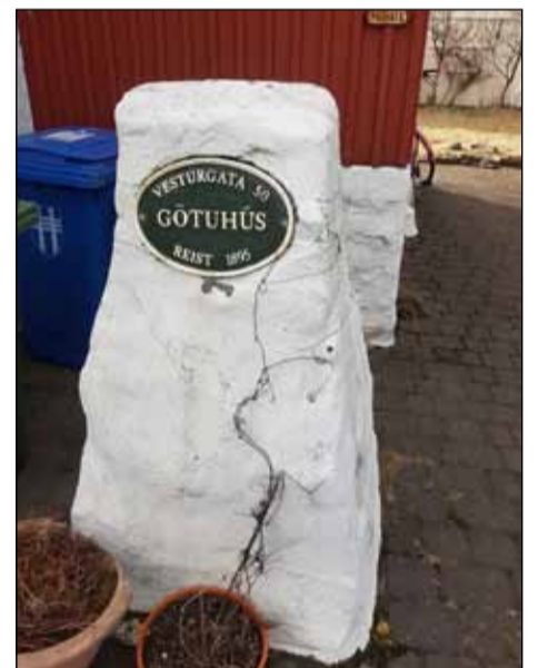
Á þessum fallega steini við Götuhaus er heiti hússins og byggingarár þess skráð.