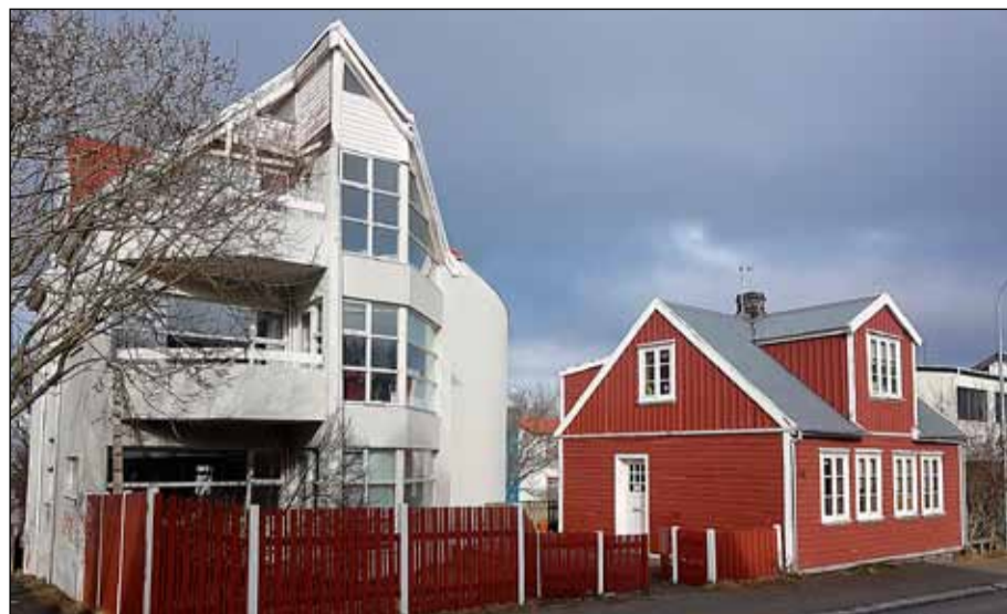
Tveir tímar. Sá ný og hinn gamli hlið við hlið við Vesturgötuna.