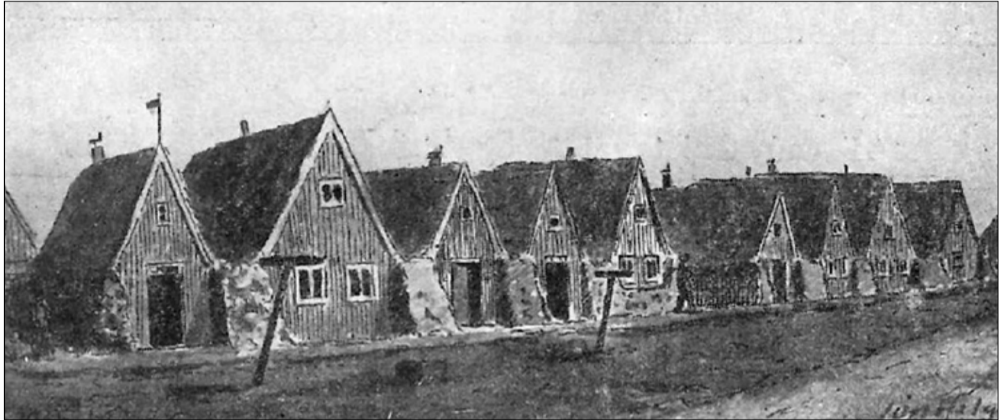
Hlíðarhúsabæirnir um 1870 samkvæmt málverki Jóns Helgasonar biskups. Hlíðarhúsabæirnir voru: Norðurbær, Vesturbær, Sund, Skáli, Miðbær, Jónsbær og Austurbær. Allir þessir bæir nema Vesturbæirinn voru rifnir fyrir aldamótin 1900. Vesturgata 26 til 28. Þar stóðu Hlíðarhúsabæirnir forðum.

Um aldamótin 1900 má segja að byggð hafi verið risin beggja vegna götunnar