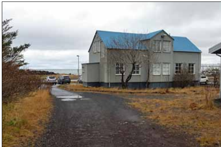
Gamla farsóttarhúsið og síðar stjórnstöð Landhelgisgæslunnar.

Gamla farsóttarhúsið á sér sína sögu. Í lögum frá 1902 var kveðið á um að byggja skyldi sérstök sóttvarnarhús í kaupstöðum landsins á kostnað landssjóðs. Strax árið 1903 var sóttvarnarhúsi fyrir Reykjavík valinn staður vestan bæjarins, neðst í túni Miðsels niðri við sjó. Árið 1905 var húsið ekki fullgert, en smíði þess þó svo langt komin að hægt var að hafa þar sjúklinga í sóttkví. Smíði hússins var svo að mestu lokið haustið 1906. Um er að ræða einlyft hús með kjallara, risi og kvisti, byggt af bindingi og klætt að utan með járnri á þaki og