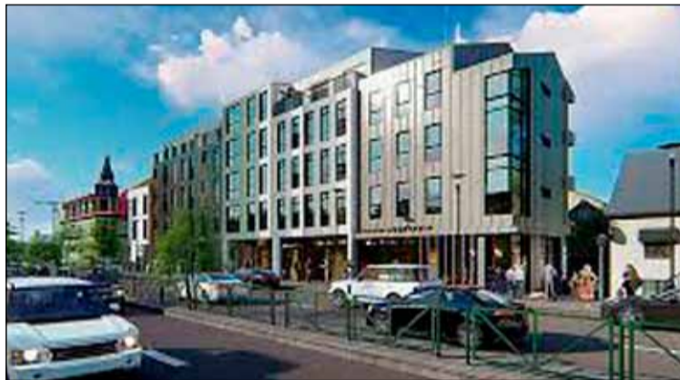
Þannig er gert ráð fyrir að hótél Íslandshótela líti út fullbúið.

Ástæður þessa eru vegna hinna fordæmalausu aðstæðna er sköpuðust í kjölfar corona faraldursins sem orðið hefur til þess að engir ferðamenn koma til landsins. Óvíst er um framhald byggingarinnar en það kann að fara eftir því hversu víðtækar afleiðingar heimsfaraldursins verða. Hvort og hvenær ferðaþjónustan fer aftur af stað. Nú mun unnið að