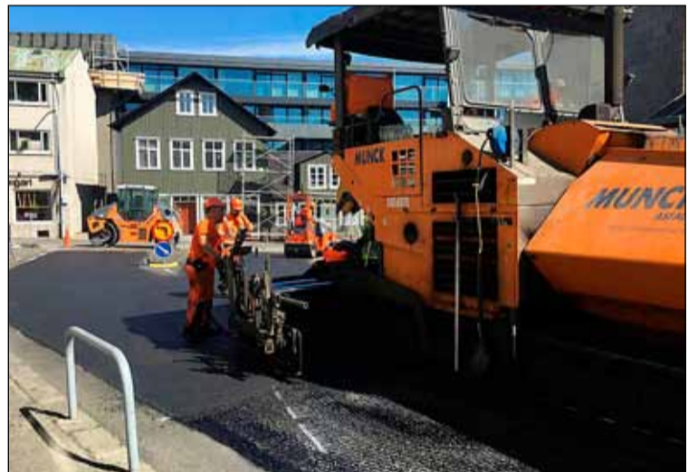
Unnið að malbikun.

Alls er áætlað að malbika götur fyrir tæpan milljarð í sumar. Bæði er um að ræða malbikun yfirlaga en einnig endurnýjun með fræsingu og malbikun. Vegalangt þar sem malbikun er fyrirhuguð er um 20,2 kílómetrar. Að auki verður unnið við hefðbundnar malbiksviðgerðir og er kostnaður við þær áætlaður um 207 milljónir króna. Áætluð upphæð malbikunarframkvæmda 2020 er því alls 991 milljónir króna.