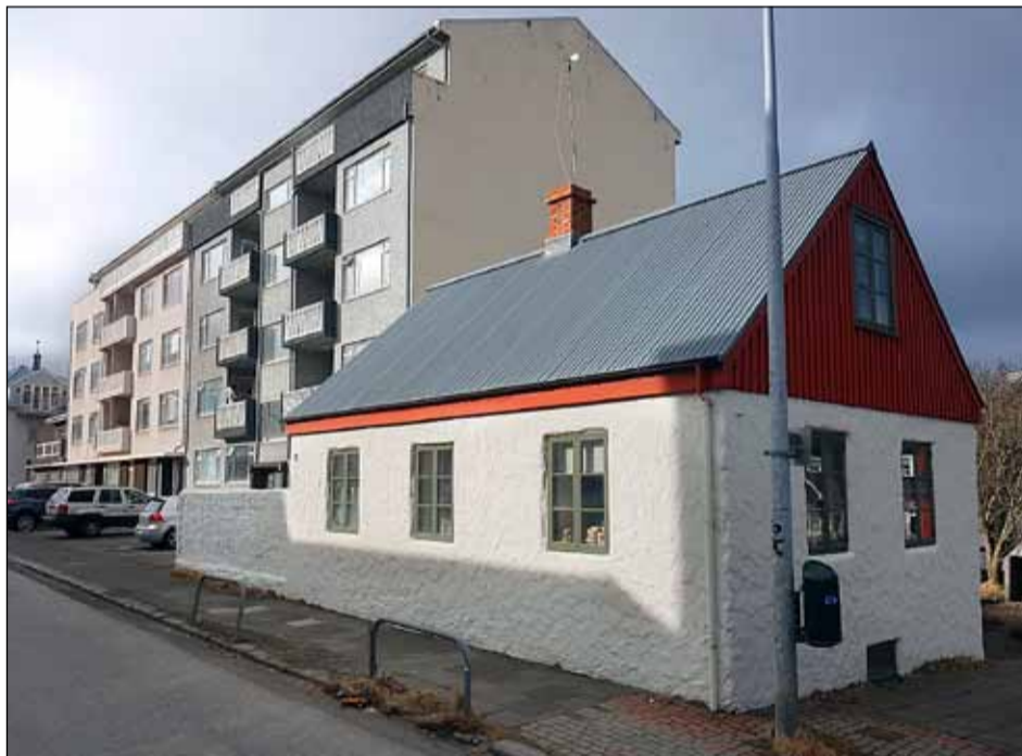
Gamalt og nýtt við Vesturgötu. Götuhaus frá 1895 og blokk byggð snemma á sjöunda áratugnum.