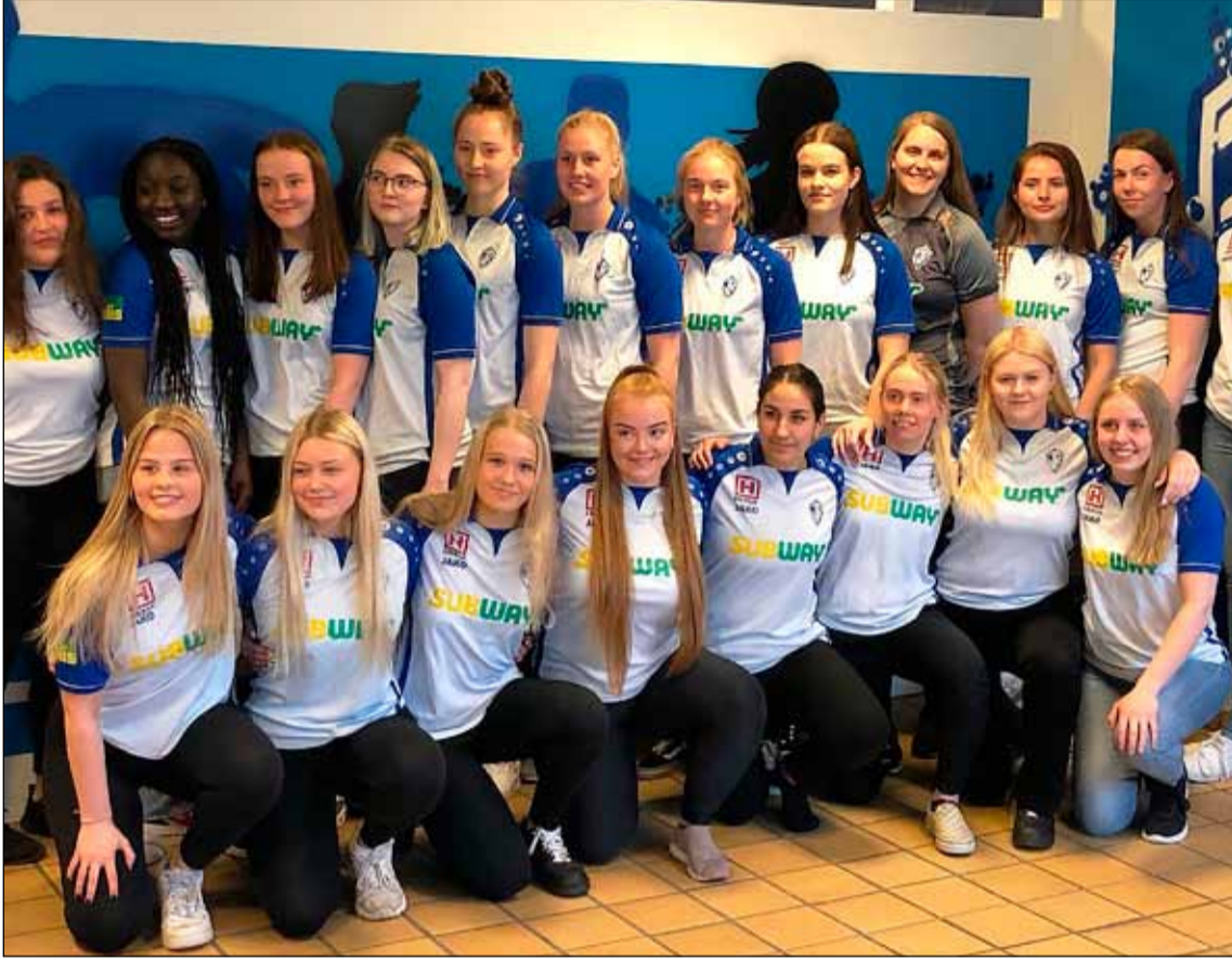
Kvinnalið ÍR á þessu ári.