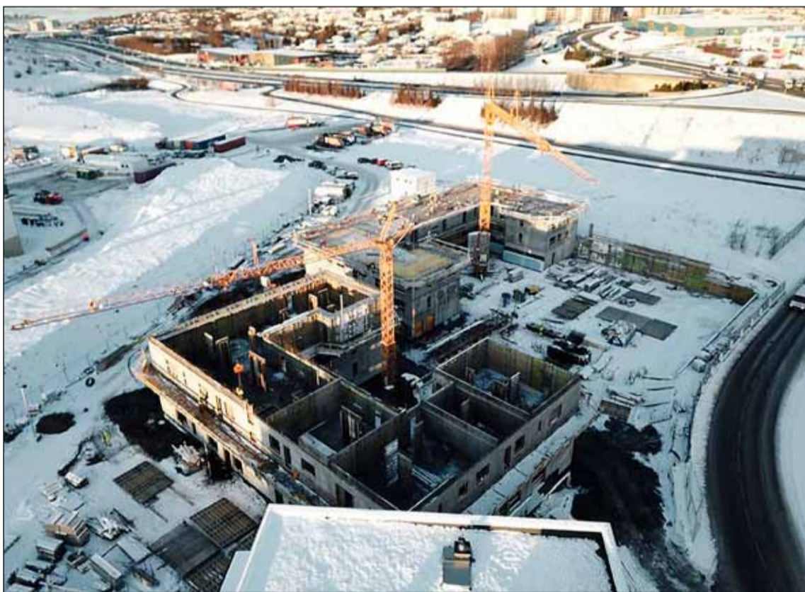
Húsin séð út lofti þegar steypuvinna stóð yfir á liðnum vetri. Ef vel er að gáð mér sjá skipulag íbúðanna.