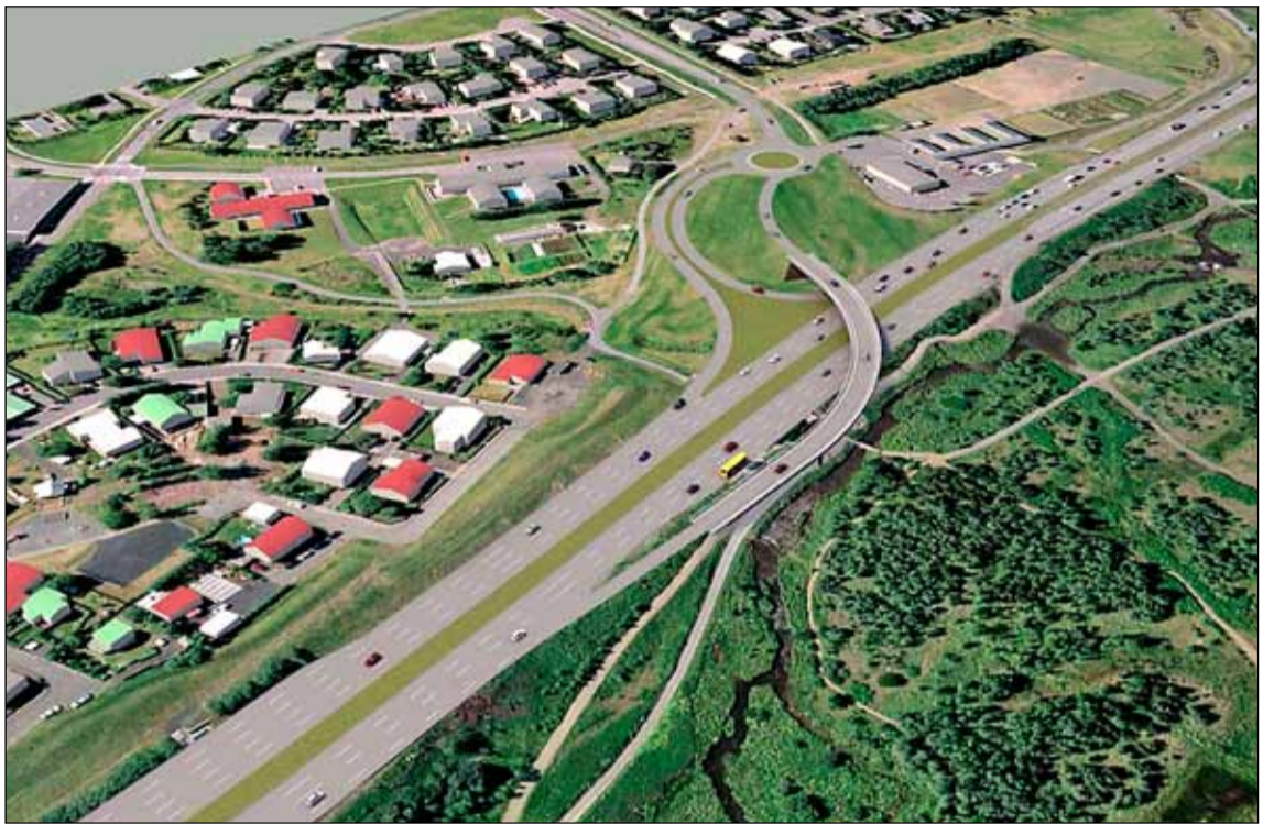
Þessi teikning Vegagerðarinnar sýnir mislæg gatnamót Bústaðavegar og Reykjanesbrautar með brú.

Gatnamót Reykjanesbrautar og Bústaðavegar eru enn komin á dagskrá. Málið hefur lengi verið umdeilt. Vegagerðin hefur talið nauðsyn á mislægum gatnamótum líkt og við Stekkjarbakka og Breiðholtsbraut og íbúasamtökin Betra Breiðholt ályktuðu í svipaða veru á sínum tíma. Einnig hefur verið talið að svo viðamiklar framkvæmdir gætu spillt Elliðaánum.