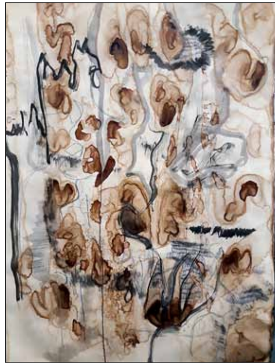
Verk eftir listnema í FB.

skilið fyrir úthald og hugvitssemi. Frítt inn og allir eru velkomnir.