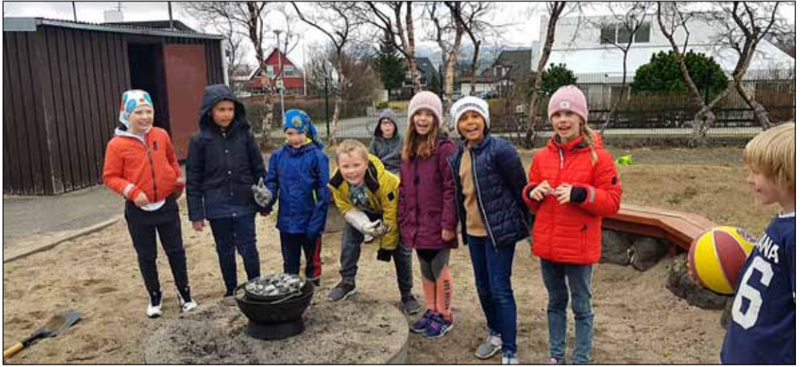
Margt skemmtilegt gerist á leikvöllinum.

Í sumar mun frístundamiðstöðin Miðberg bjóða upp á lífligar sumarsmiðjur fyrir börn fædd árin 2007 til 2009. Þar verður meðal annars farið í Hunger Games leik í Viðey, Rush Trampólíngarð, skoðað íshelli í Perlunni og margt fleira skemmtilegt. Skráning er hafin inni á sumar.fristund.is þar sem hægt er að nálgast frekari upplýsinga.