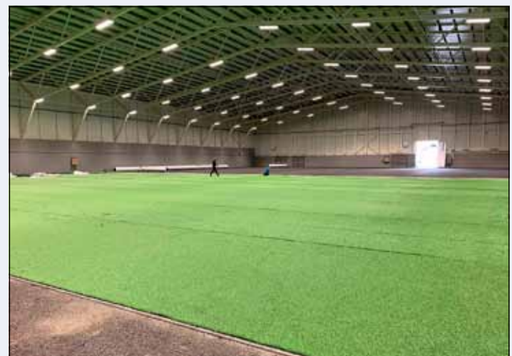
Senn líður að því að nýtt fjölnota íþróttahús ÍR verði opnað.