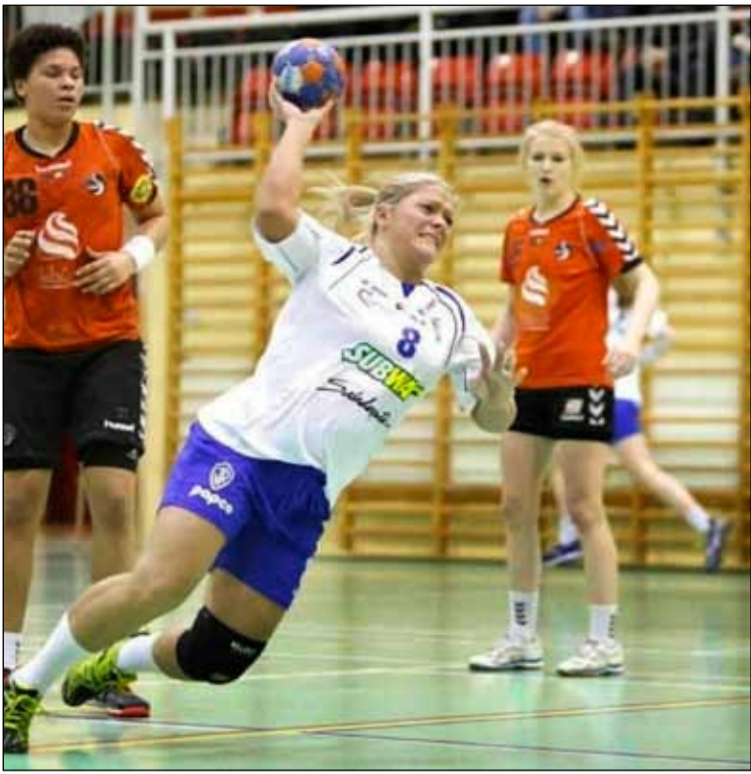
Tekið á í handboltanum. Nú skal hann í markið.