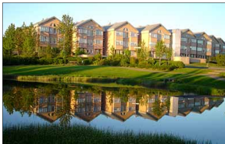
Ákveðið var að miðja eða miðbær Seljahverfisins yrði í dalverpinu þar sem tjörnin er. Hjúkrunarheimilið stendur tígulegt og speglast í tjörninni á góðviðrisdögum.

gróðursælasta byggð Reykjavíkur. Líkt og Bakkahverfið og Fella og Hólahverfið þó einkum Fellaahverfið væru nýjungar í byggingarsögu Reykjavíkur má segja að Seljahverfið sé það ekki síður. Það var hannað og byggt til þess að mæta fjölbreyttari þörfum en hin og auka breidd byggðar og mannlífs í Breiðholti. Með byggingu þess hófst að segja má nýr kafli í skipulagi íbúðabygginga. Skipulag þar sem þarfir manneskjunnar voru hafðar í fyrirrími.