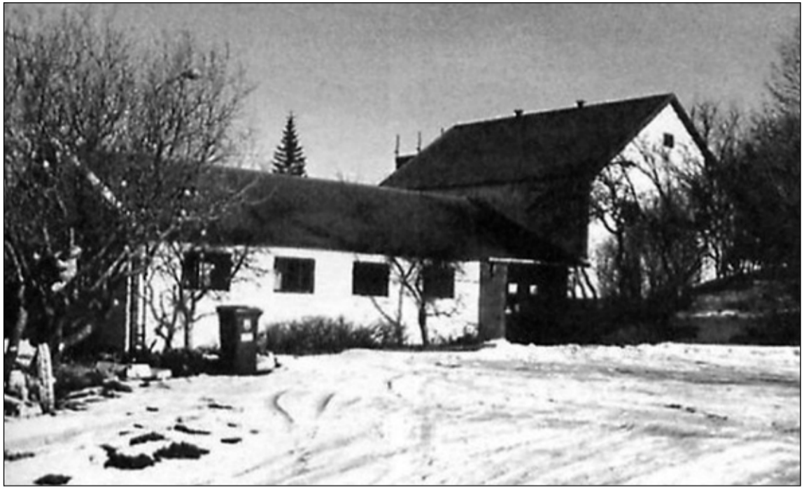
Breiðholtsbærinn stóð neðst í Seljahverfinu. Gróðrarstöðin Alaska var lengi til húsa í gamla Breiðholtfjósínu.