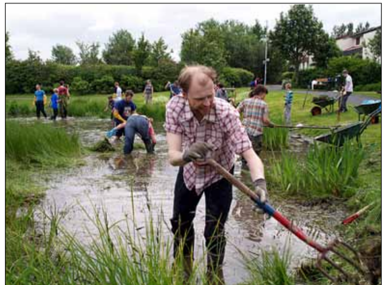
Fyrir nokkrum árum var efnt til viðamikillar hreinsunar í miðbæ Seljahverfisins. Hér eru sjálfboðaliðar að hreinsa tjörnina á góðviðrisdegi.

byggði hver sitt hús og stýrði framkvæmdum sínum sjálfur. Ég er þess fullviss að það átti sinn þátt hversu fljótt íbúarnir tóku til við umhverfismálin."