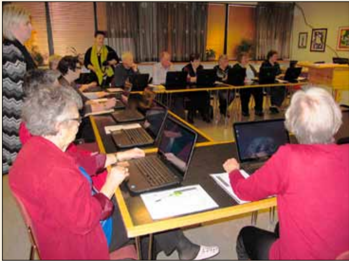
Frá tölvunámskeiði í félagsstarfinu í Gerðubergi.

Félagsstarfið í Gerðubergi hefur opnað aftur eftir langa bið og voru það konurnar í þrónakaffinu sem voru fyrstu gestirnir. Allir eru velkomnir en fólk þarf að skrá sig fyrirfram vegna fjöldatakmakana og passa að hafa tvo metra á milli sín. Salirnir eru mismunandi en þeir stærstu leyfa 20 manns í sama rými. Rými fyrir trútskurð og myndlist leyfa aðeins sjö manns í einu.