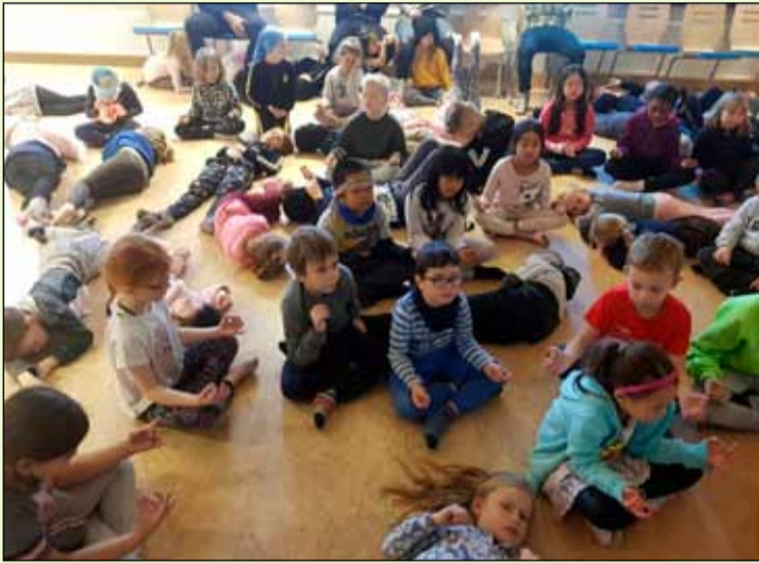
Yngri börnin njóta sín í frístund.

Veturinn sem nú er á enda var að sönnu viðburðaríkur á frístundaheimilunum í Breiðholti. Að venju voru fjölbreytt og skemmtileg verkefni í boði fyrir börnin. Meðal fastra punkta má nefna Hrekkjavökuhátíð í haustleyfi skólanna í október, foreldrakaffi, Breiðholt got talent, hæfileikakeppnina sívinsælu og leiklistarhátíð. Auk þessa voru ýmis skemmtileg verkefni inni á frístundaheimilunum, eins og meðfylgjandi myndir bera með sér.