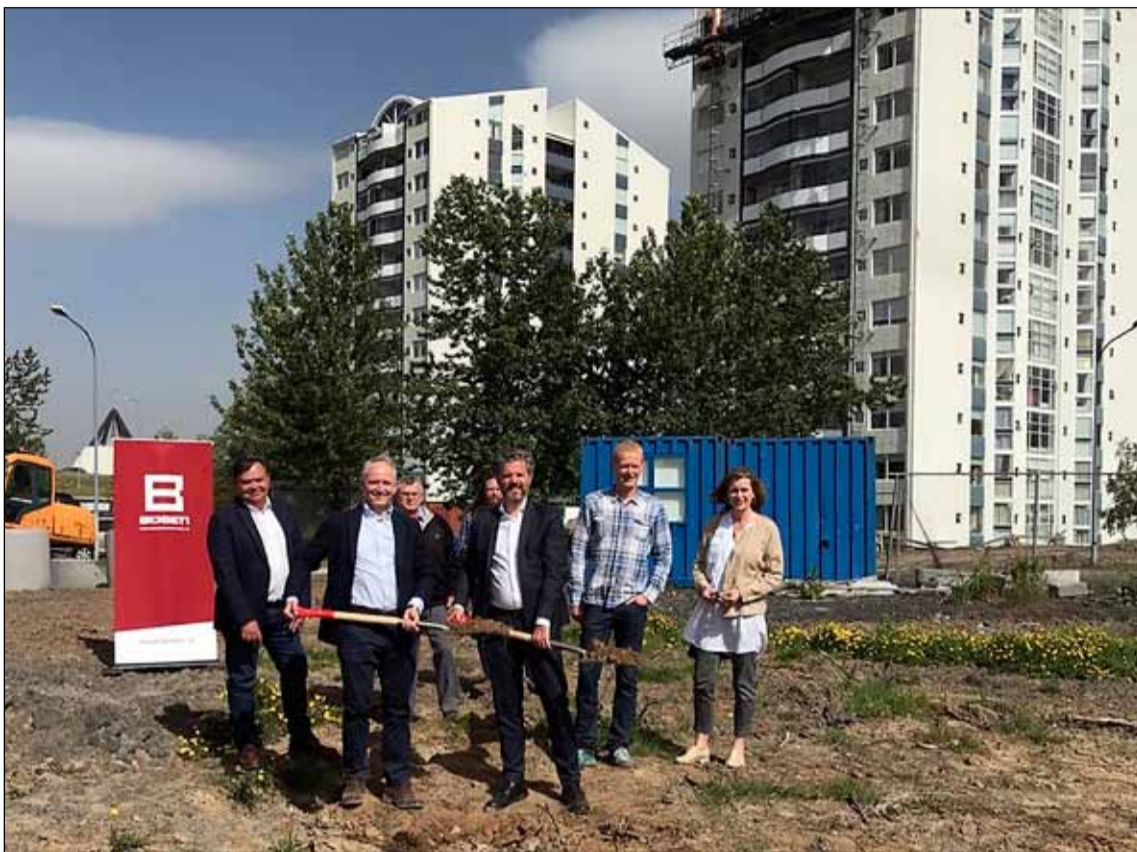
Fyrsta skóflustungan tekin við Árskóga 5 til 7.

Kynningarfundur vegna Árskóga verður haldinn haustið 2020 og hefst sala búseturéttta í framhaldi af því. Til að geta sótt um íbúð verður fólk að vera félagsmaður í Búseta. Íbúðir í nýbyggingum Búseta eru auglýstar á föstu verði og félagsnúmer ræður röð umsækjenda. Hægt er að sækja um fleiri en eina íbúð og er þá hægt að raða íbúðum í röð eftir ósk kaupenda. Úthlutun hinna nýju íbúða við Árskóga 5 og 7 fer fram haustið 2020. Efsti umsækjandi á lista þarf að mæta og staðfesta úthlutun sína. Þær íbúðir sem ganga af verða settar á netið undir reglunni "fyrstur kemur - fyrstur fær." Þá er umsókn bindandi og fer beint í ferli þegar hún berst félaginu. Ef tveir eða fleiri sækja um sömu íbúðina, þá gildir tímaröð umsókna. Kaup íbúðarréttar fara þannig fram að ganga þarf frá bráðabirgðasamningi vegna kaupna á búseturétti innan 10 virkra daga frá úthlutun. Við undirritun bráðabirgðasamnings er greitt inn á búseturéttinn kr. 375.000. Kostnaður vegna kaupanna er kr. 140.000. Búseturétturinn er greiddur jafnt og þétt á byggingartíma og greiðsluáætlun sett í samninginn. Áætlað er að afhending íbúðanna fari fram um mitt ár 2021.