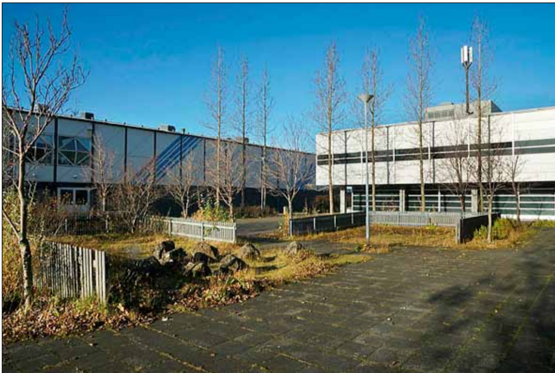
Torgið á milli Sambíóanna og Landsbankans verður endurgert í sumar.

- gróður og lýsing mun einkenna þann hluta sem vinna á við í sumar