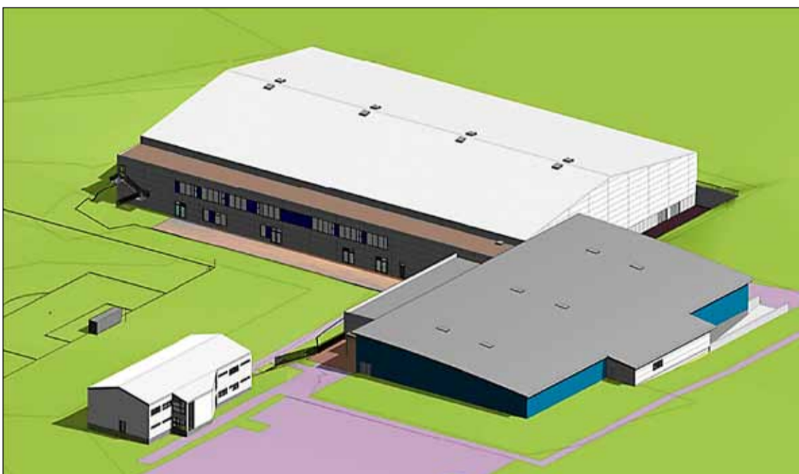
Yfirlitsmynd af svæði ÍR þar sem sjá má bæði fjölnotahús og parkethús.

nýja strauma í íþróttahreyfingu landsmanna. Félagið hefur því komið mörgu góðu í framkvæmd og vonandi mun svo vera áfram. Von mín er sú að ég geti látið gott af mér leiða og haldið áfram því góða starfi sem hefur verið unnið hjá ÍR.”