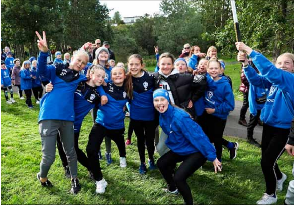
Flottar ÍR stelpur á Síamótinu.

Síamót Breiðabliks fór fram helgina 10. til 12. júlí en það er eitt stærsta fótboldamót sumarsins. 6. flokkur stúlkna sendi frá sér fimm lið á mótinu og lét árangurinn ekki á sér standa.