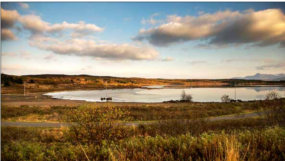
Landslag og gróður á Austurheiðum.