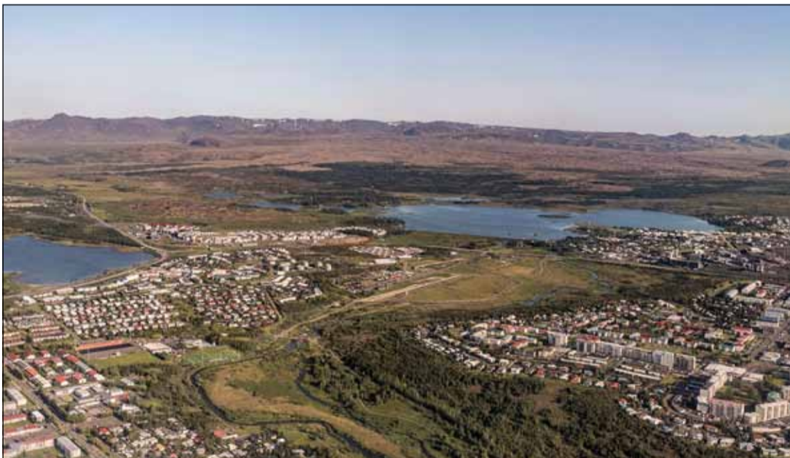
Á þessari mynd má sjá yfir Efra Breiðholt, Elliðaárdal og eystri hverfi Reykjavíkur.