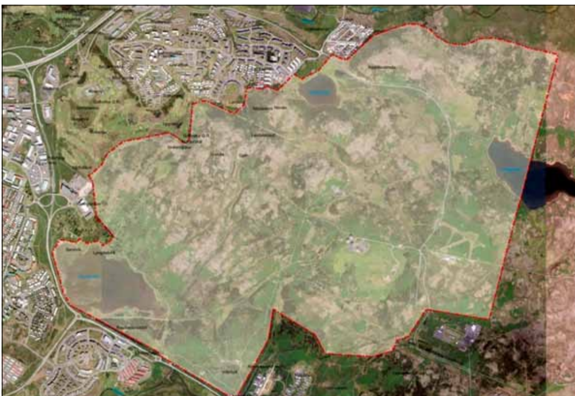
Á kortinu má sjá það land sem fellur undir umrætt rammaskipulag.