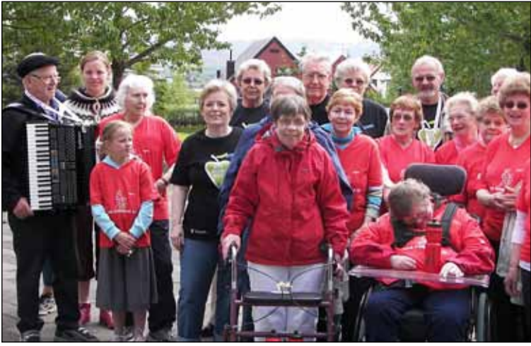
Konur í félagsstarfinu í Gerðubergi taka þátt í kvennahlaupi í Sí.