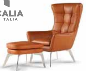
JACOB stóll frá Calia Italia

RÚM • SÓFAR • HVÍLDARSTÓLAR • HEILSUKODDAR • LJÓS • HÚSGÖGN • GJAFAVÖRUR • BORÐ • SÆNGUR