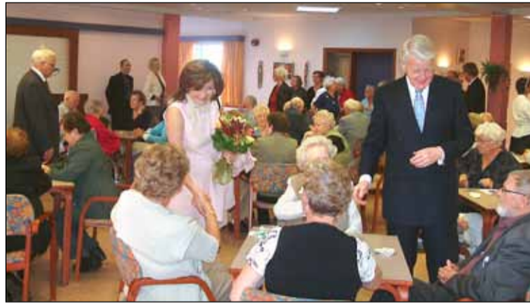
Margir gestir hafa heimsótt félagsstarfið í Gerðubergi. Hér eru Ólafur Ragnar Grímsson fyrrum forseti Íslands og Dorrit Moussaief í heimsókn í forsetatið Ólafs.

í gegnum árin. Í dag heitir það Cocina Rodríguez en einnig þekkt undir nafninu Kaffi 111. Þar er boðið upp á notalega stemningu með kaffi, kökum, smáréttum og öðrum léttum veitingum. Einnig er í boði kjarngóður hádegismatur milli kl. 11:30 og 13:00 alla