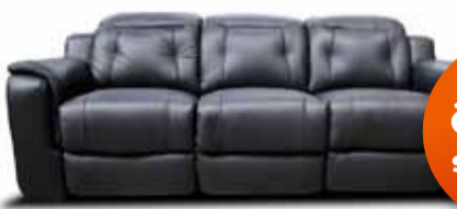
ERMES hægindasófi. Sjá nánar á lur.is