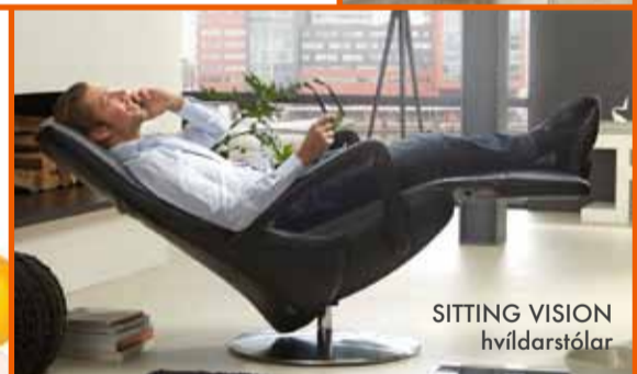
SITTING VISION hvíldarstóll