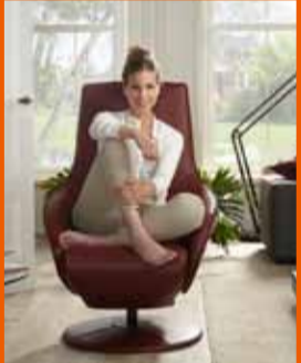
ISABELLA hægindasófi. Sjá nánar á lur.is