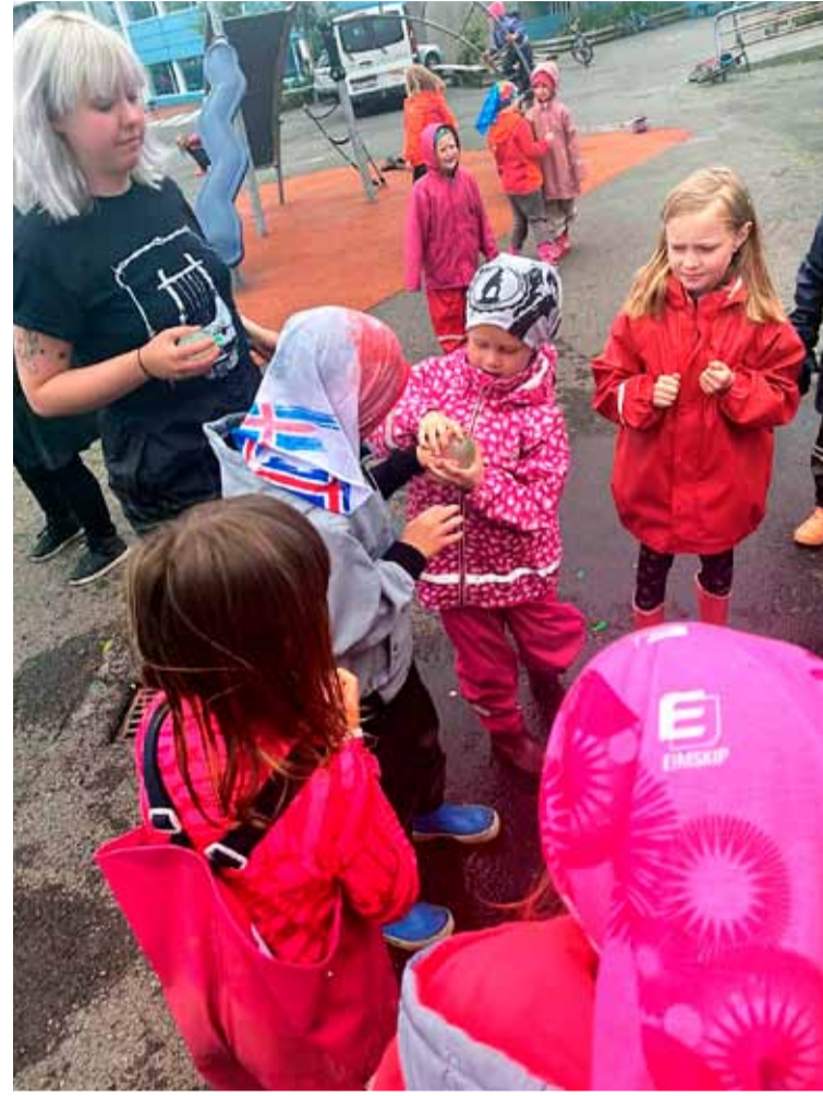
Framhald af forsiðu. Þessar myndir voru teknar í störfum félagsmiðstöðvanna í Breiðholti í sumar. Þær opna aftur þriðjudaginn 4. ágúst að sumarleyfi loknu.