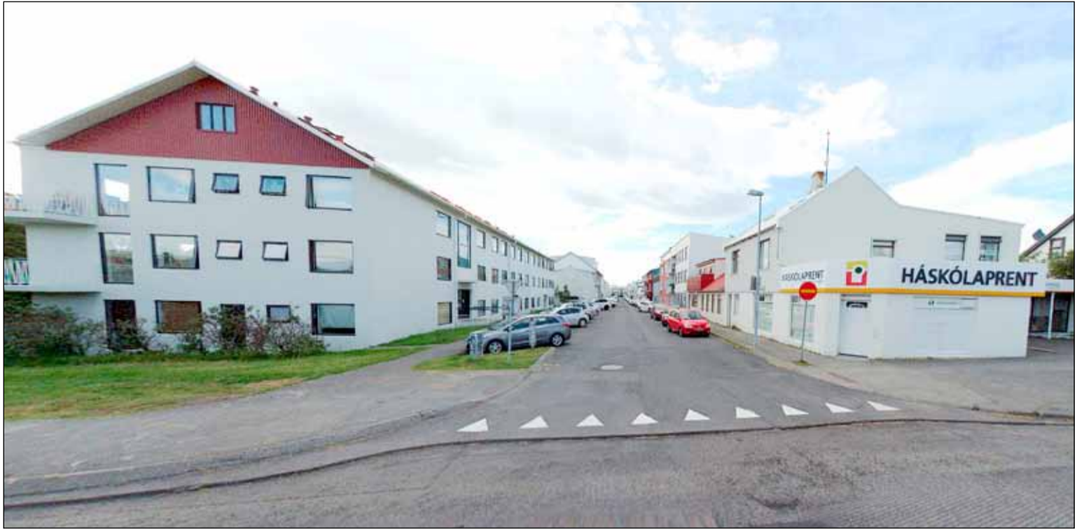
Fálkagata á Grímstaðaholti.

Á forsíðu Tímans frá 23. október 1963 má lesa frétt sem hefst á fyrirsögninni "Grímstaðaholtið að Hollywood. Í fréttinni segir að það hafi heitið Grímstaðaholt fyrir nokkrum árum en nú séu sumir farnir að kalla það Hollywood eða Beverly Hill Reykjavíkur. Blaðið segir tíu leikara búa þar og einn bætist fljótlega í hópið. Rifjað er upp að Grímstaðaholtið hafi í eina tíð verið kallað Serkjahverfi og ekki þótt sérlega fint. Nú sé öldin önnur. Á þessum tíma bjuggu Gunnar Eyjólfsson, Jón Sigurbjörnsson, Þóra Friðriksdóttir, Helgi Skúlason og Helga Bachmann við Fálkagötu 19. Skammt frá við Dunhagann bjuggu Herdís Þorvaldsdóttir, Katrín Thors, Bryndís Pétursdóttir og Brynja Benediktsdóttir.