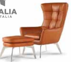
JACOB stóll frá Calia Italia

RÚM • SÓFAR • HVÍLDARSTÓLAR • HEILSUKODDAR • LJÓS • HÚSGÖGN • GJAFAVÖRUR • BORD • SÆNGUR