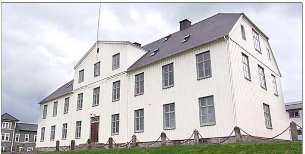
Gamla skólahús Menntaskólans í Reykjavík.

Ákveðið hefur verið að byggja 2.600 fermetra viðbyggingu við Menntaskólann í Reykjavík. Skólinn er nú með starfsemi sína í tíu húsum á svokölluðum Menntaskólareit sem afmarkast af Þinghóltsstræti að Lækjargötu og Amtmannsstíg að Bókhöfðustíg. Til að rýma til fyrir nýja húsinu verður nýrri hluti hússins Casa Cristi rifinn, en það er fríðað að hluta. Fyrir aldarfjórðungi var haldin samkeppni um nýja byggingu við skólann en það hús var aldrei byggt.