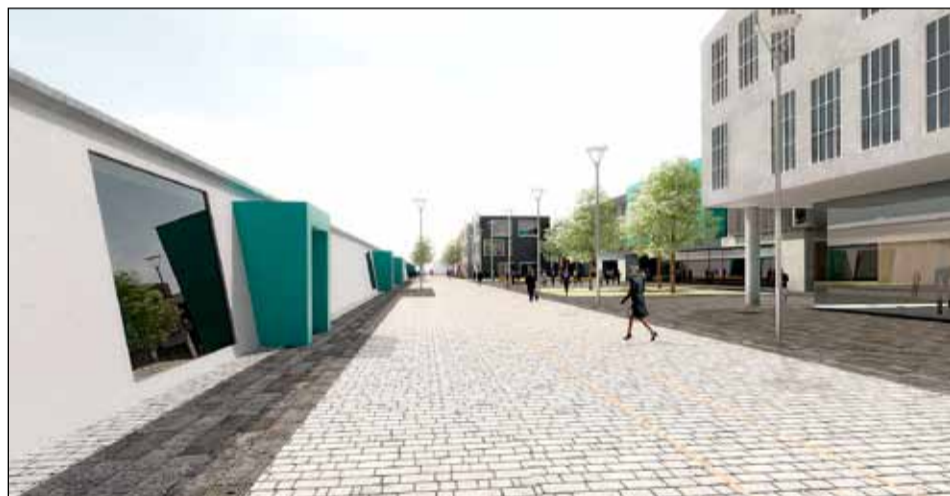
Götumyndir eins og arkitektar ASK arkitektar sjá þær fyrir sér.

Faxaflóahafna sf. að hafa verði þá þróun sem átt hefur sér stað í sjávarútvegi hér á landi undanfarin misseri til hliðsjónar við skipulag svæðisins og megi nefna starfsemi Sjávarklasans og ýmissa hátækniyrirtækja því til stuðnings. Þá er á svæðinu rekin einhver stærsta útgerð og fiskvinnsla á landinu og fiskmarkaður, ásamt fjölmörgum nýsköpunarfyrirtækjum í tengslum við sjávarútveg.