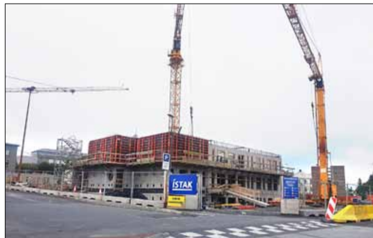
Viðbygging við Gamla Garð verður þrjár hæðir

Stúdentabúðirnar sem eru að rísa á horni Suðurgötu og Hringbrautar afmarkast af þeim götum til norðurs og austurs og af Sæmundargötu til suðurs og vesturs. Lóðin er á eignarlandi Háskóla Íslands. Viðbygging við