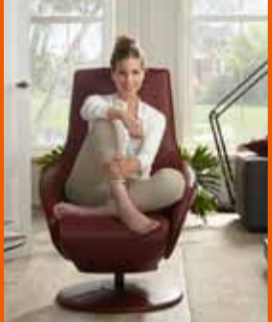
SITTING VISION hvíldarstóllar