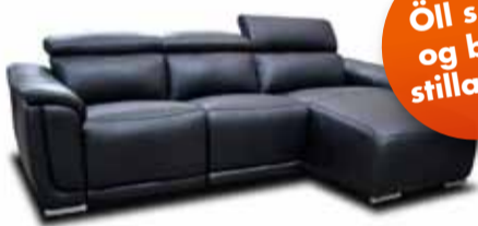
RICCARDO rafstillanlegur tungusófi