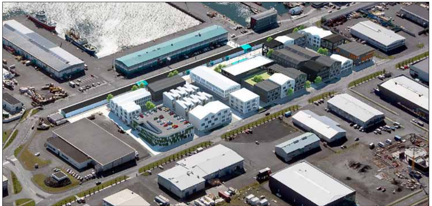
Línbergsreitur eins og hann mun koma til með að líta út verði hinar nýju tillögur að veruleika.

Í Aðalskipulagi Reykjavíkur 2010 til 2030 er að finna tilteknar forsendur og markmið fyrir skipulag og uppbyggingu svæðisins. Í því er m.a. lögð áhersla á að hafnsækinni starfsemi verði sköpuð góð vaxtarskilyrði. Á svæðinu vesturhafnarinnar er að finna margháttada starfsemi tengda sjávarútvegi auk þess sem á undanförnum misserum hefur þróast þar fjölbreytt menningar- og þjónustustarfsemi sem fallið hefur að