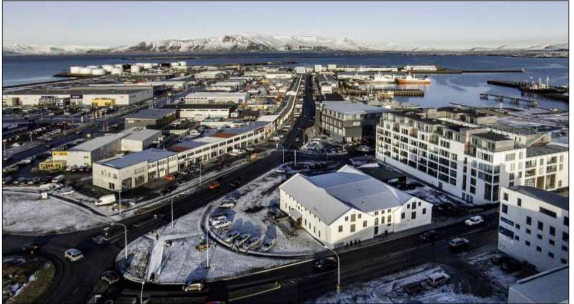
Alliance reiturinn við Grandagarð.

- myndi auka byggingamöguleika við Alliance húsið