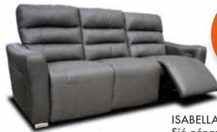
ISABELLA hægingdasófi. Sjá nánar á lur.is