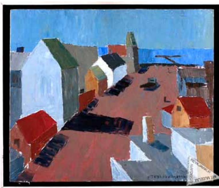
Málverk af Grímstaðaholti eftir Nínu Tryggvadóttur.