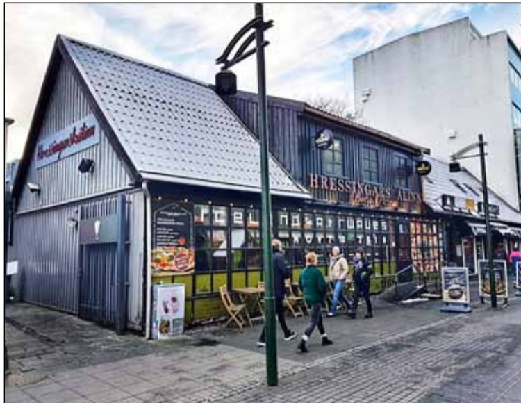
Austurstræti 20 þekktast undir heitinu Hressingarskállinn.

Í minnisblaði Minjastofnunar Íslands, sem fylgir með beiðni Vivaldi, segir að húsið sé timburhús að stofni til frá árinu 1805 en friðað árið 1990. Árið 1862 var reist tvílyft viðbygging við austurenda hússins og á 20. öld voru gerðar miklar breytingar á ysta og innra borði vegna veitingareksturs undur nafni Hressingarskálans. Fyrirhuguð breyting á húsinu felst í því að fjarlægja nýlegar innréttingar og milliveggi. Sett verður upp úðarakerfi og húsið hólfað niður í aðskilin brunahólf fyrir veitingarekstur og samkomuhald. Ekki verða gerðar breytingar á ytra borði að svo stöddu en veggir og gluggar verða málaðir. Minjastofnun Íslands hefur veitt heimild til að fjarlægja seinni tíma innréttingar, klæðningar og milliveggi úr Austurstræti 20 vegna fyrirhugaðra breytinga. Óheimilt er hins vegar að