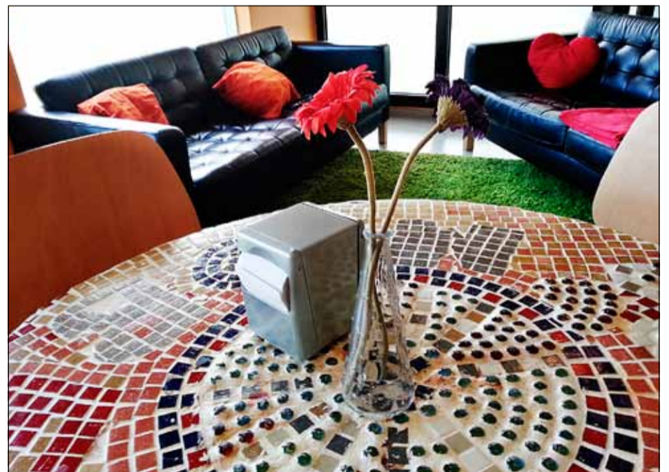
Mósaekborðplata og leðursófar á Kaffi Markús.