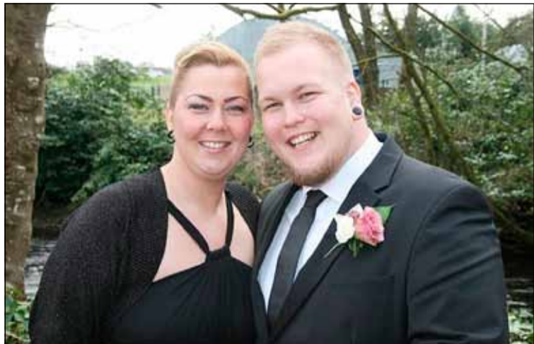
Nei - ég var ekki að gifta mig sjálfur á Norður Írlandi heldur býr bróðir minn þar en hann er doktor í líffræði við Queens Háskólann í Belfast.

borgarhluta og hverfisvitund veit ég að þetta er ekki allsstaðar eins. Mun meiri samheldni ríkir á milli fólksins í Grafarvogi en í Breiðholti það er allavega mitt mat.“