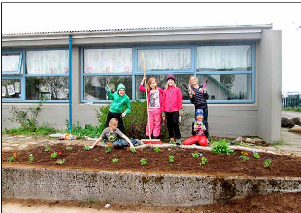
Glaðir krakkar í Hraunheimum.

fá Hraunheimum og alla leið uppá Elliðaavatn þar sem við fengum að nýta aðstöðu sem Sjálfsbjörg á höfuðborgarsvæðinu hefur til afnota sem útivistarsvæði fyrir fatlaða. Við fengum að nýta úti-svæðið þeirra þar sem við veiddum í vatninu með háfum, fórum í leiki og svo poppuðum við yfir eldi. Við vorum mjög heppin með veður og var þetta sannkölluð ævintýraferð. Frístundaheimilið Hraunheimar er núna komið í sumarfrí en við byrjum aftur með spennandi dagskrá þann 12. ágúst næstkomandi.