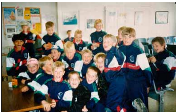
Með Leikni í Færeyjaferð.

ÍR og Leikni í eitt stórt og öflugt íþróttafélag Breiðholts. Þyngra er en tárur taki fyrir mig grjótharðan Leiknismanninn að viðurkenna þá staðreynd að gamla íþróttafélagapólitíkin hefur runnið sitt skeið á enda. Íþróttafélögin þurfa að ala upp sitt íþróttafólk í sinni heimabyggð. Það er ekki nóg að taka upp veskið og kaupa leikmenn. Íþróttastarfsemi felst í