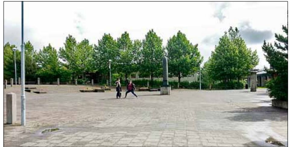
Þegar veður leyfir eru viðburðirnir haldnir úti á torgi enda nóg pláss á víðfemu torginu.