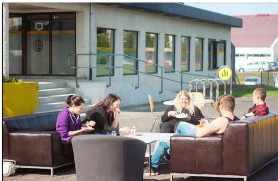
Þegar vel viðrar er með sófa, stóla og borð út á torg þar sem fólk getur notið þess að sitja í sólinni.