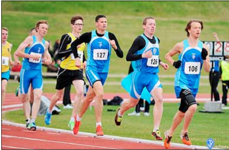
ÍR-ingar á hlaupabrautinni á Landsmótini UMFÍ.