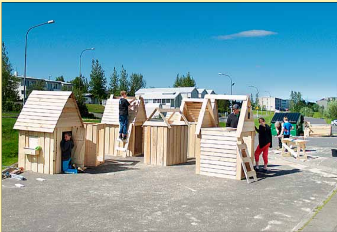
Krakkarnir í Hólmaseli hafa starfað við að smíða kofa í sumar en kofasmíði er vinsæl á meðal krakka sem njóta þjónustu fristundaheimilanna. Hér gefur að líta árangur af byggingastörfum í Hólmaseli.

Meðfylgjandi eru mynd af Wibitbrautinni.