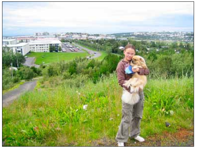
Horft yfir Bakkahverfi í Breiðholti.

Ef rýnt er í tölfræði lögreglunnar kemur í ljós að afbrotum hefur fækkað um allt að 40% á undanförunum árum og afbrotatíðni orðin sambærileg því sem gerist í öðrum íbúahverfum borgarinnar. Þessi þróun hefur átt sér stað þrátt fyrir margbreytileika Breiðholtsins en þar býr fólk af öllum þjóðfélagsstigum og mörgum þjóðernum og frá mörgum menningarsvæðum. Mikil breyting hefur orðið til hins betra á liðlega tveggja áratuga tímabili en á árum áður skapaðist nokkuð sérstök ungmennamenning eða svokölluð gengjamening í að minnsta kosti sumum hlutum Breiðholtsins. Slík ungmennamenning heyrir nú sögunni til og á sama hátt hefur tekist að skapa traust á milli fólks af ýmsum þjóðernum. Hvað lögregluna varðar er hún litin misjöfnum augum frá einu menningarsvæði