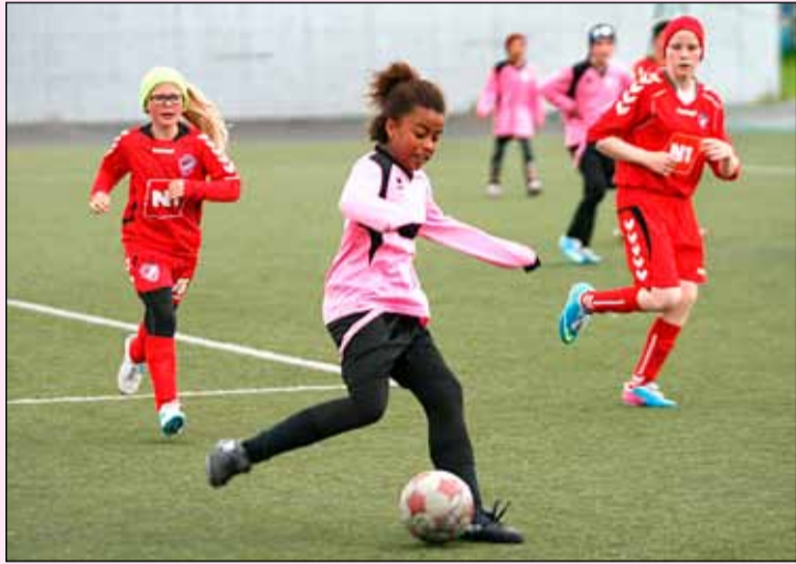
Brunað með boltann að marki andstæðinganna.

Íþróttafélögin í Breiðholti, ÍR og Leiknir, etja ekki bara kappi hvert við annað í þeim íþróttgreinum sem stundaðar eru í báðum félögunum, heldur hafa þau sameinast um lið í yngri flokkum kvenna í knattspyrnu, þ.e. í 4., 5., 6., og 7. flokki. Þessi samvinna hófst í fyrra. Mörg þessara liða má svo sjá í leik á Síamótinu, sem hefst í dag í Kópavogi en ÍR/Leiknir sendir þangað 9 lið til keppni.