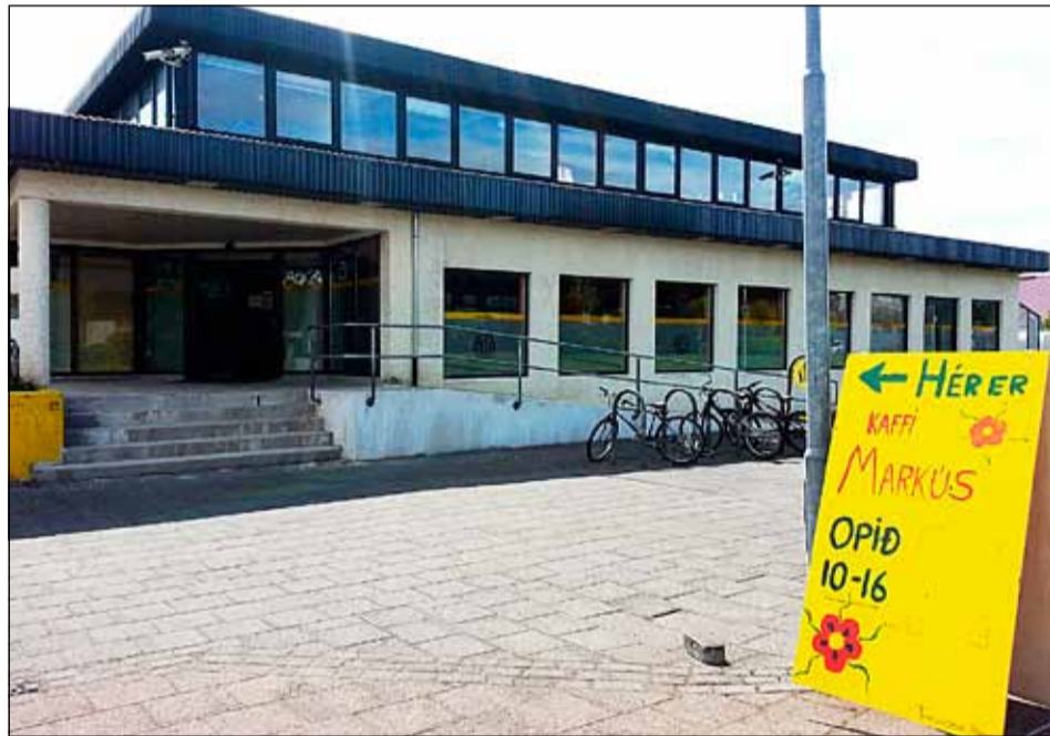
Næsta skref fól í sér að opna lítið krúttlegt sumarkaffihús Kaffi Markús í húsnæði Miðbergs að Gerðubergi 1.