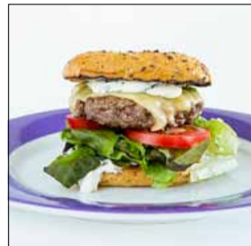
Úr hollu hráefni og gómsætur.

siður og útgefandi er fyrirtækið Íslenskur matur og matarmening ehf. Reynt hefur verið eftir fremsta megni að stilla verði bókanna í hóf án þess að slá nokkurs staðar af kröfum. Frábærar ljósmyndir Kristins Magnússonar ljósmyndara kóróna verkið. ( http://kmpphoto.is/about-2/ )