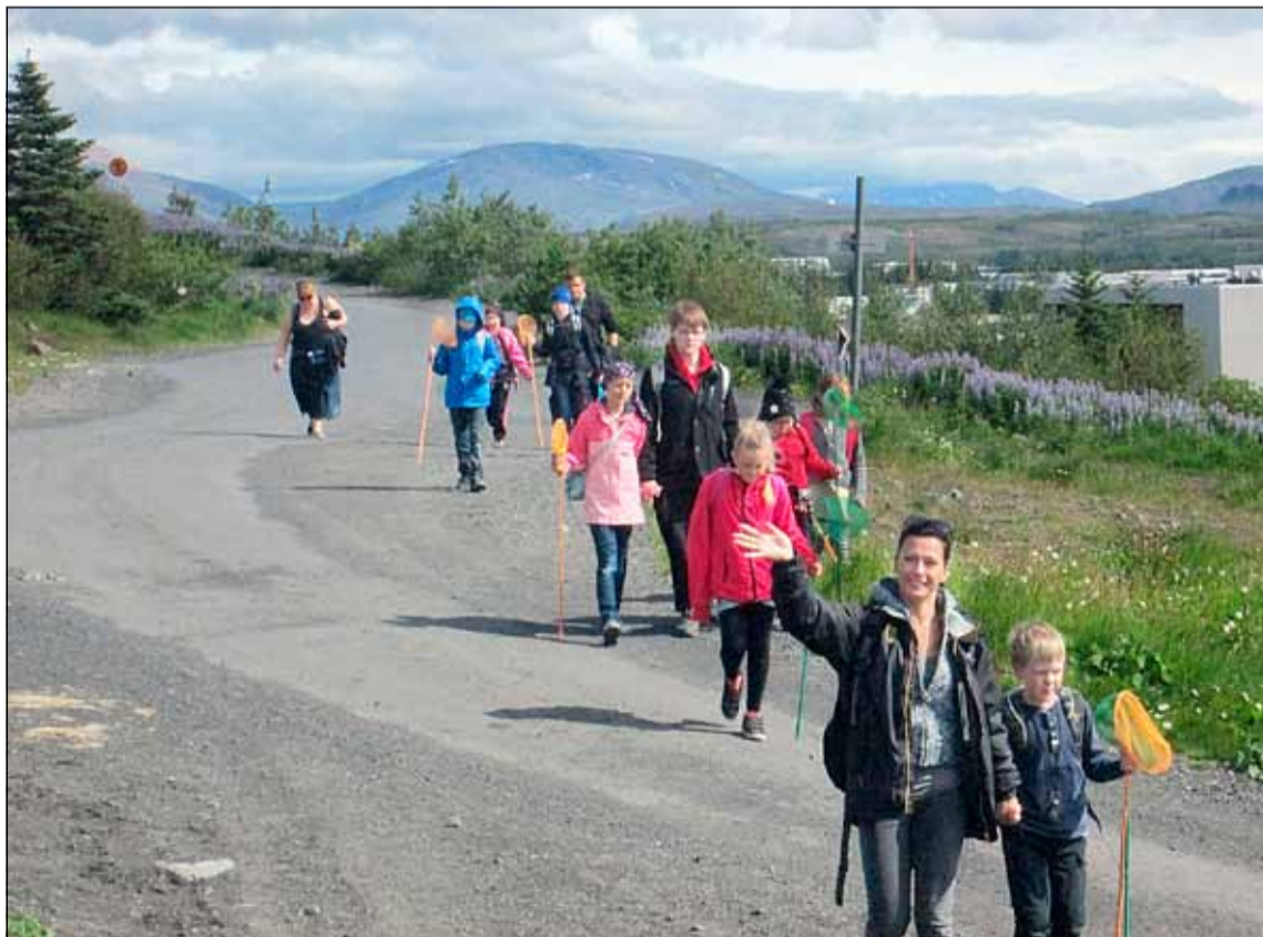
Á gönguför um Breiðholtið.