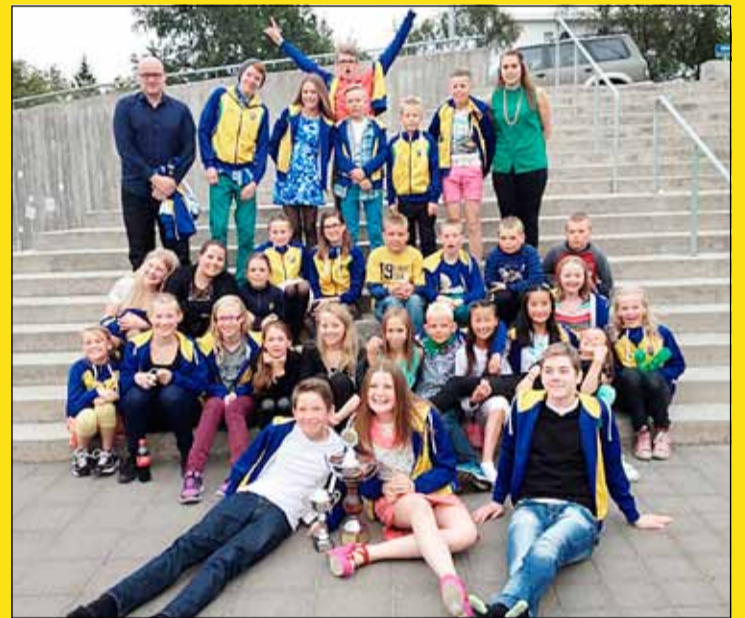
Ægishópurinn ásamt þjálfurum.

Sundfélagið Ægir endaði í öðru sæti í stigakeppni félaga á Aldursflokkameistaramóti Íslands 2013. Þar fá fyrstu 6 sætin í hverjum aldursflokki stig. Stigastaða fimm efstu liða var á þessa leið: ÍRB 1016 stig, Ægir 563 stig, SH 365 stig, Óðinn 315 og Breiðablik með 276 stig. Krakkarnir börðust allan tímann í hverju sundi til stiga. Þau voru flott og til fyrirmyndar. Aldursflokkameistaramót Íslands AMÍ er aldurskipt meistaramót í sundi þar sem keppt er beint til úrslita. Á AMÍ eru veitt verðlaun fyrir fyrstu þrjú sæti í hverri grein í hverjum aldursflokki. Aldursflokkarnir eru: Piltar og stúlkur 15 ára, drengir og telpur 13 – 14 ára, sveinar og meyrar 11 til 12 ára, hnokkar og hnátur 10 ára og yngri. Aldursflokkameistaramót Íslands er stigakeppni félaga.