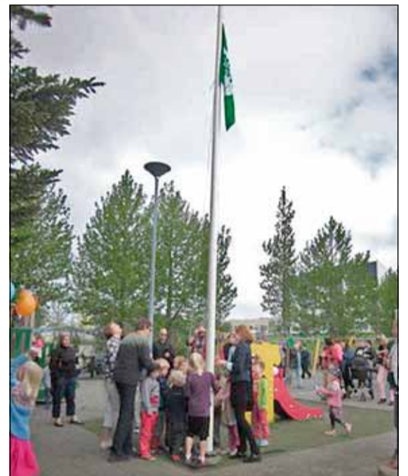
Grænáninn dreginn að hún í Hálsaskógi.