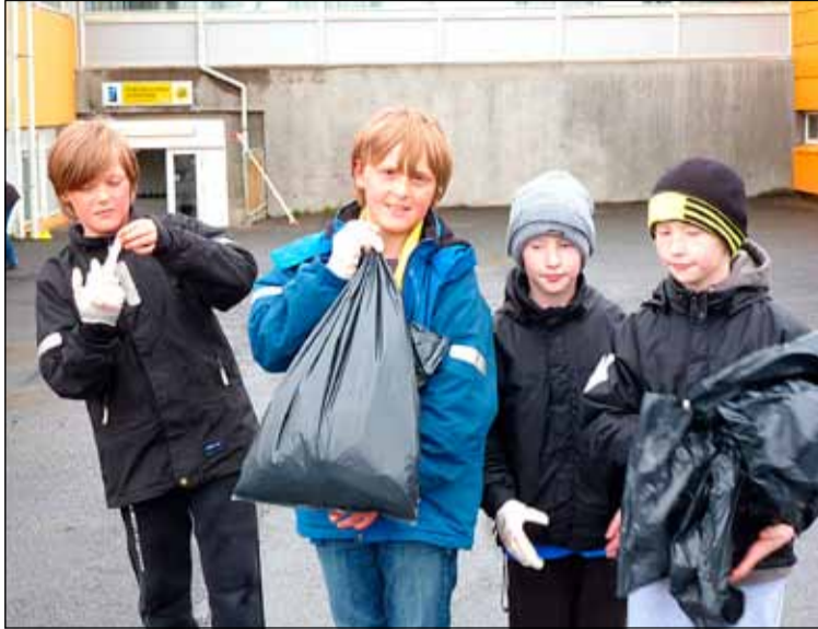
Þessir stóðu sig vel í tiltektinni.

Foreldrafélag Ölduselsskóla stóð fyrir vel heppnaðri vorhátíð í annað sinn laugardaginn 25. maí síðastliðinn. Börn og foreldrar fjölmenntu og tóku til hendinni frá klukkan 10-12. Það var eftirsótt að þvo glugga og biðu sum börnin í röð eftir að fá gluggaþvottasköfunu í hönd og fá að prófa. Vaskir einstaklingar á öllum aldri gengu um alla lóð og týndu samviskusamlega upp fernur, plastmál, nammibréf og fleira rusl sem villst hafði yfir á skólalóðina. Annar hópur tók sér sóp í hönd og gerði sér lítið fyrir og sópaði alla hluta steyptu lóð skólans. Eftirtektarsamir munu hafa séð að einnig komust nokkrir grænir fingur í arfa og njóla sem prýða nú ekki lengur skólasvæðið.