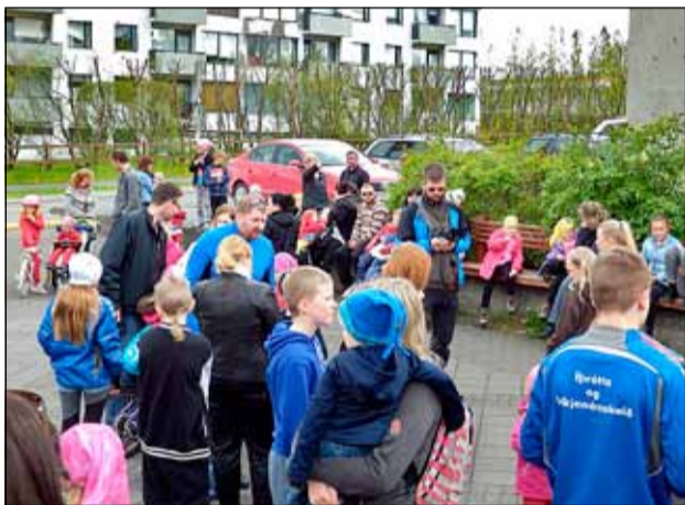
Fólk dreif víða að. Bæði börn og fullorðna.