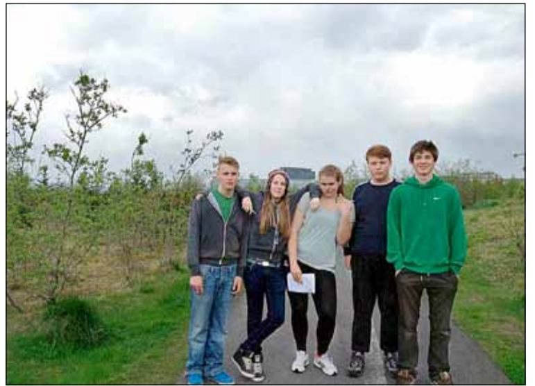
Myndirnar eru frá sumarstarfi félagsmiðstöðvanna.

Eins og venjulega bjóðum við upp á sumarsmiðjur fyrir krakka úr 5., 6. og 7. bekk. Smiðjur eru í boði á þriðjudögum, fimmtudögum og föstudögum og eru keyrðar frá tveimur félagsmiðstöðvum í einu. Í boði er meðal annars hvalaskoðun, skyllingar, klifur, heimsókn á Domino's Pizza, ferð í Nauthólsvík og margt margt fleira. Skráning fer fram gegnum www.rafaen.reykjavik.is