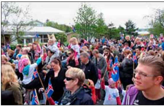
Gengið frá Seljahlíð en það var sungið með heimilisfólkinu.

Jöklaborg er 25 ára og var haldin hátíð með foreldrum og börnum leikskólum í tilefni dagsins. Í Seljakoti og Seljaborg var haldin sameiginleg leiksýning á túninu milli leikskólanna og eftir leiksýningu fóru leikskólarnir í sína garða þar sem hátíðarhöldunum var haldið áfram, grillaðar pylsur, andlitsmálun og fleira fór fram. Í Hálsaskógi var grænáninn dreginn að hún en skólinn fékk hann afhentan í fimmta sinn og í fyrsta sinn eftir sameiningu Hálsakots og Hálsaborgar.