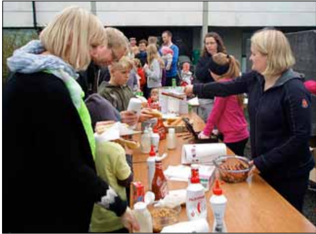
Pylsurnar eru alltaf jafn vinsælar og það var vægast sagt brjálað að gera við pylsuborðið.

hjóla og komust færri að en vildu. Þá var löng röð í Veltibílinn vinsæla. Frábær dagur hjá foreldrum og börnum í Breiðholtsskóla. Breiðholtsblaðið fékk nokkrar myndir frá vorhátíðinni.