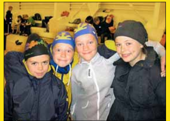
Hressar á Akranesmóti.

Krakkarnir stóðu sig af stakri þrýði, allir voru kurteisir og til fyrirmyndar í skólanum þar sem við gistum. Veðrið setti strik í reikninginn þetta árið en það var rok og rigning nánast allan tímann þannig að þegar þau voru ekki að synda þá fengu þau að bíða inni í íþróttahúsinu. Sólin ákvað hins vegar að heiðra okkur með nærveru sinni síðasta mótshlutann eftir hádegi á sunnudeginum og þá drifu yngri börnin sig í fjöruferð á Langasand með fararstjórum. Einhverjir bættu við sig AMÍ lág-mörkum og mörg þessi yngri syntu í fyrsta sinn margar greinar. Ekki voru veitt sérstök verðlaun í aldursflokknum 10 ára og yngri.