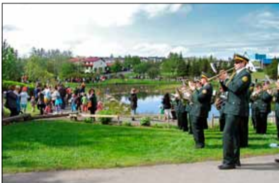
Gengið undir lúðrablaestri við andapollinn við Seljahlíð.