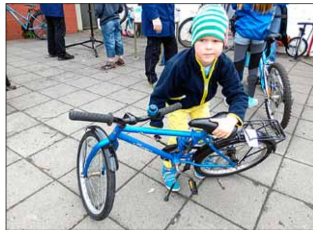
Þessi ungi maður var sérstaklega áhugasamur um hjólið sitt.