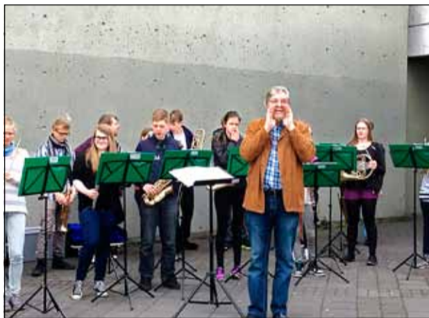
Skólahljómsveit Árbæjar og Breiðholts mætti á hátíðina og lék nokkur lög.