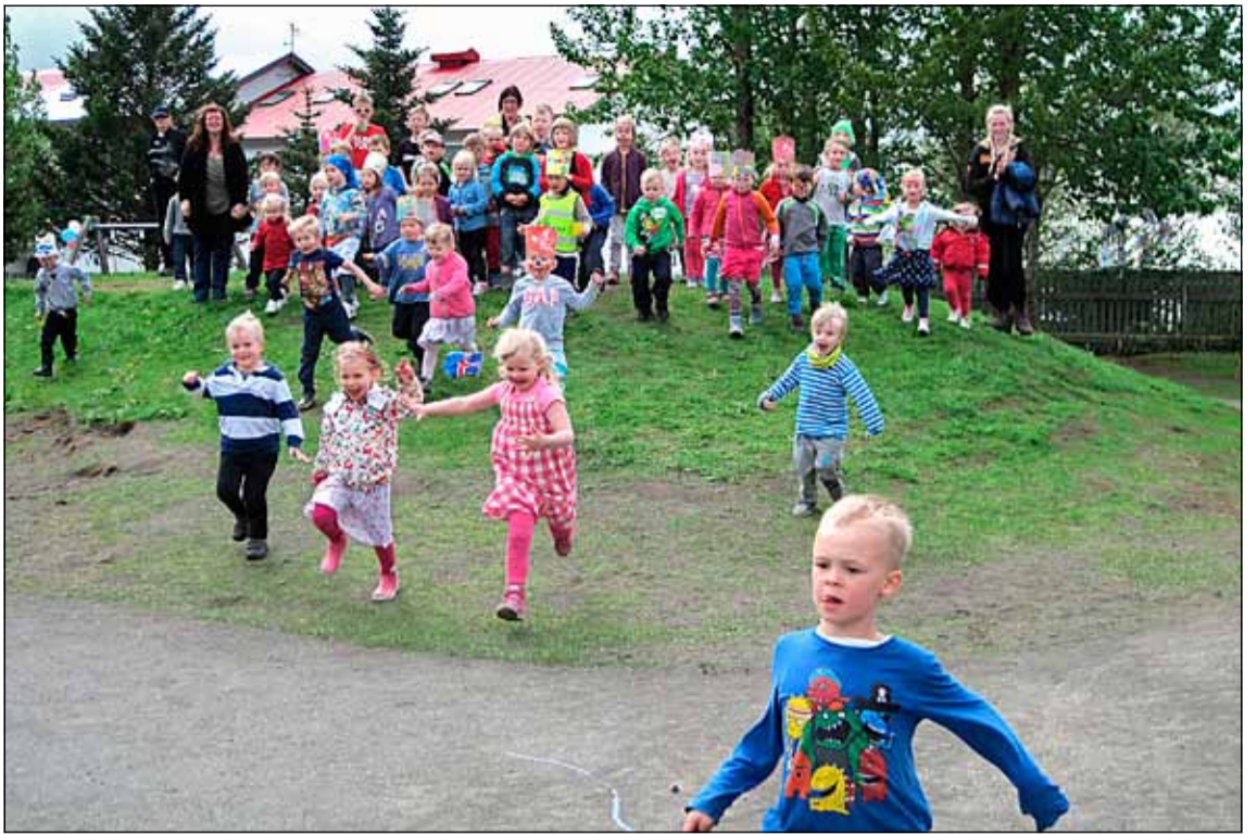
Glatt á hjalla í Jöklaborg.

hólum 10 og veldur það óþægindum fyrir ökumenn þar sem þverstæði eru við Orrahóla 1. Umhverfis- og skipulagsráð samþykkti einnig að bannað verði að leggja bílum í Flúðaseli beggja vegna götunnar frá Seljabraut vestur fyrir Fjarðarsel og að beygju á Flúðaseli. En ítrekað hefur verið kvartað yfir að bílum sé lagt í Flúðaseli, sérstaklega í innri hluta götunnar nærri Fjarðarseli. Þessar samþykkingar eru gerðar með fyrirvara um samþykkt lögreglustjóra Höfuðborgarsvæðisins.