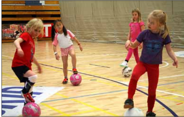
ÍR-ungar taka þátt í meðferð með bolta undir stjórn þjálfara.

Barnið getur flakkað á milli deilda að vild, það getur t.d. æft einu sinni í viku og róterað með að æfa handbolta eina vikuna, frjálsar íþróttir næstu viku o.s.frv. Eins gæti iðkandinn æft 5 x í viku ef því er að skipta og haft vikurnar samt sem áður ólíkar, allt eftir áhuga og hentugleika hvers barns. Fyrir flestar þessar æfingar eru ÍR-ungar með eins konar útibú af frístundaheimili í sama húsi (Íþróttahúsið við Austurberg), þannig að börnin fara með frístundavagni upp í íþróttahús þar sem þau taka þátt í starfi frístunda-