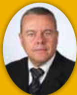
Þorsteinn Elfsson útfararþjónusta