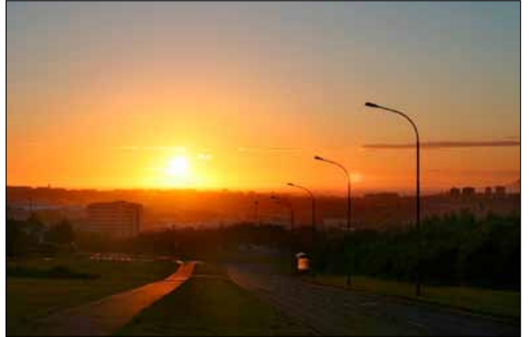
Sólarupprás í Breiðholti síðla hausts um svipað leyti og Breiðholtsdagar standa yfir.