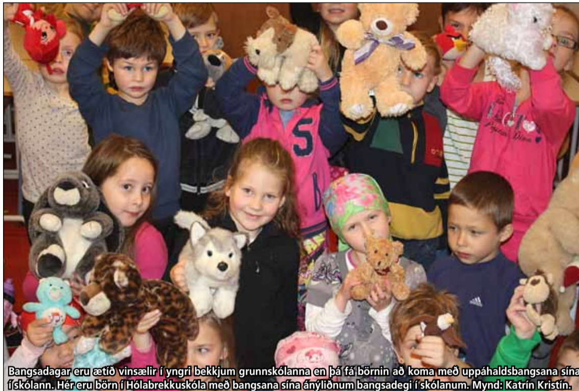
Bangsadagar eru ætíð vinsælir í yngri bekkjum grunnskólanna en þá fá börnin að koma með uppáhaldsbangsana sína í skólann. Hér eru börn í Hólabrekkuskóla með bangsana sína ányliðnum bangsadegi í skólanum.