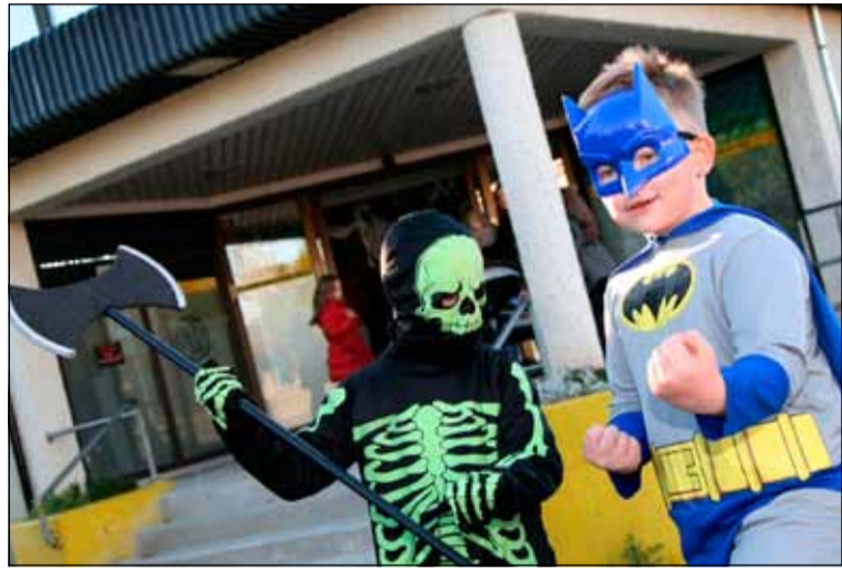
Græn beinagrind og leðurblökumaður fyrir framan Miðberg.

Draugar og nornir mættu þeim sem komu á Hrekkjavöku í Miðbergi en þar mátti hlusta á draugasögur, fara á nornakaffihús og skrifa í gegnum draugagöngin.