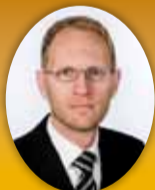
Frimann Andrésson útfararþjónusta