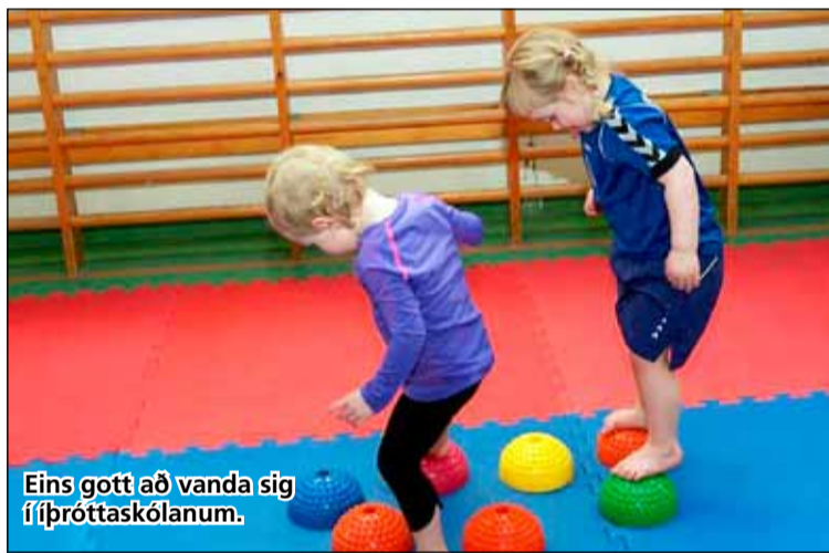
Eins gott að vanda sig í íþróttaskólanum.

Markmið skólans eru að efla hreyfiþroska og hreyfigetu, auka sjálfstraust og vellíðan, auka úthald og losa um umframorku,