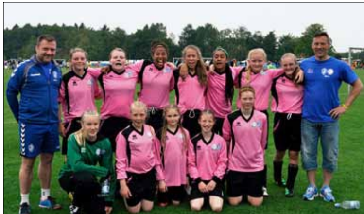
4. og 5. flokkur ÍR-Leiknis fór í ógleymanlega keppnisferð á knattspyrnumót til Danmerkur.

Það sem stóð hins vegar upp úr í þessari ferð var liðsheildin sem stelpurnar sköpuðu við kjör aðstæður til knattspyrnuíðkunar í Vildbjerg, flott og skemmtilegt mót í góðu veðri. Með jákvæðni og samheldni nutu stelpurnar sín á knattspyrnuvellingum og lögðu hvert liðið á fætur öðru. Ekki skemmdi heldur fyrir að hafa nokkuð stóran aðdáendahóp, skipaðan úrvals þjálfurum, foreldrum og