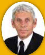
Guðmundur Baldvinsson útfararþjónusta