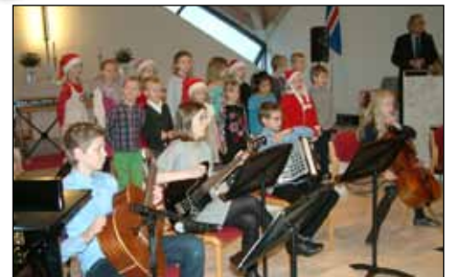
Hinir árvissu jólatónleikar Tónlistarskóla Seltjarnarness voru haldnir í Seltjarnarneskirkju laugardaginn 30. nóvember. Hæfileikarík börn á öllum aldri stigu á svið og léku af fingrum fram.