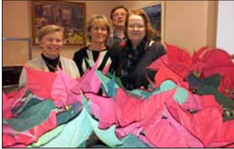
Starfsfólk á Bæjarskirkstofu Seltjarnarness tóku á móti sendingu af jólastjörnum.

Hvert sem litið er þá er jólaundirbúningur í fullum gangi. Nesfréttir kíktu við á nokkrum stöðum í bænum og fylgdist með jólaundirbúningnum og tók þátt í tónleikahaldi og fleirum viðburðum sem tengjast aðventunni.