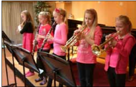
Nemendur í Tónlistarskóla Seltjarnarness halda sína jólatónleika í skólanum sem kemur öllum í sannkallað hátíðarskap.