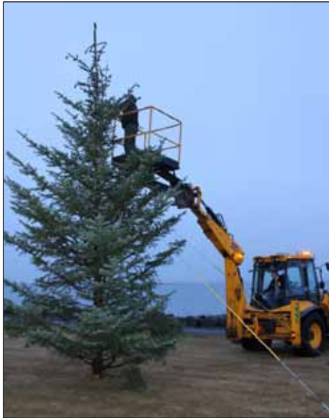
Árni Pétursson rafvirki sér um að koma ljósunum á réttan stað á jólatrénu við Norðurströndina.