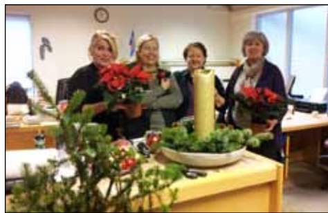
Það er líflegt um að litast á Bókasafni Seltjarnarness þegar líður að jólum. Auk þess að tína fram bækur um jólahald og föndurlöb af ýmsum toga þá kappkosta starfsfólkið við að gleðja gesti með fallegum skreytingum og blómum í anda jólanna.

HÁGÆÐI.IS HÚSAVIÐGERÐIR.IS FLÍSAÞAGNIR.IS