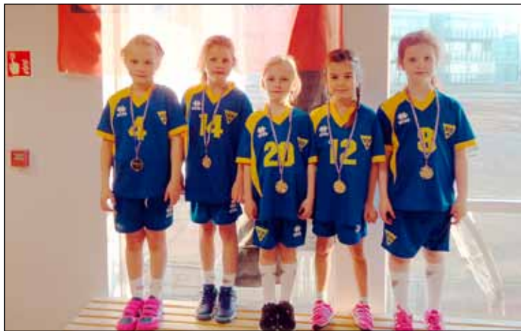
Stúlkur í 8. flokki Gróttu í handbolta.

Helgina 8. - 9. nóvember hélt Handknattleiksdeild Gróttu fyrsta mót hjá 8. flokki stúlkna og drengja í handknattleik. Það voru 450 börn sem mættu til okkar í Hertzhöllina.