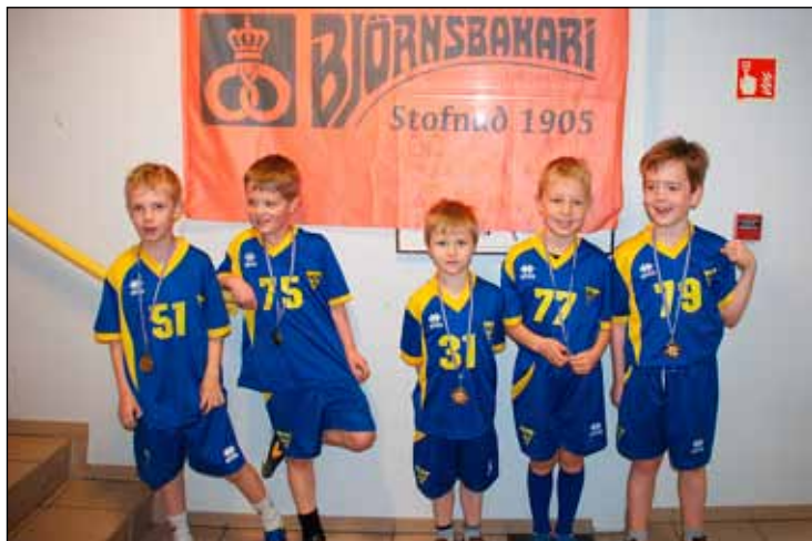
Drengir í 8. flokki Gróttu í handbolta.

Mótið gekk mjög vel fyrir sig. Gleðin skein úr andlitum keppenda og var mikið fjór í húsinu hjá okkur. Gaman var að sjá hvað margir mættu til að horfa á þessa frábæru keppendur. Sumir voru að keppa á sínu fyrsta handboltamóti. Vonandi halda þau áfram á þessari braut því framtíðin blasir við þeim. Í lokin fengu allir keppendur verðlaunapening og íspinna.