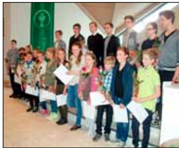
Frá útskrift Tónlistarskóla Seltjarnarness fyrir nokkru.

Með því móti verður komið til móts við þarfir nemenda skólans hvað nám og námsframvindu varðar og bættur sá skaði nemenda sem missir kennslu annars hefði í för með sér. Stjórnendur skólans munu ásamt kennurum sjá um skipulag þessarar kennslu, sem verður innt af hendi og að fullu lokið á vorönn 2015. Ekki kemur til