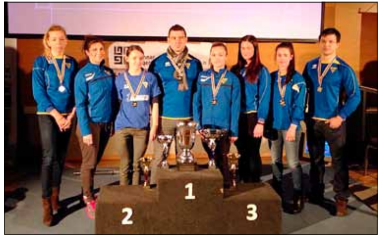
Glæsilegur hópur frá kraftlyfingadeild Gróttu á Íslandsmeistaramóti í bekkpressu.

Höfundur er fjármála- og efnahagsráðherra.