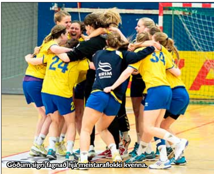
Góðum sigri fagnað hjá meistaraflokki kvenna.

Meistaraflokkar Gróttu í handknattleik hafa staðið í ströngu undanfarnar vikur. Meistaraflokkur kvenna leikur í N1-deildinni og hefur þegar þetta er skrifað náð flottum úrslitum frá áramótum. Liðið tapaði naumlega gegn ÍBV og Íslandsmeisturum Vals en unnu Hauka í deild og 16 liða úrslitum bikarsins. Liðið vann einnig Stjórnuna í frábærum leik.