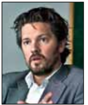
Dagur B. Eggertsson.