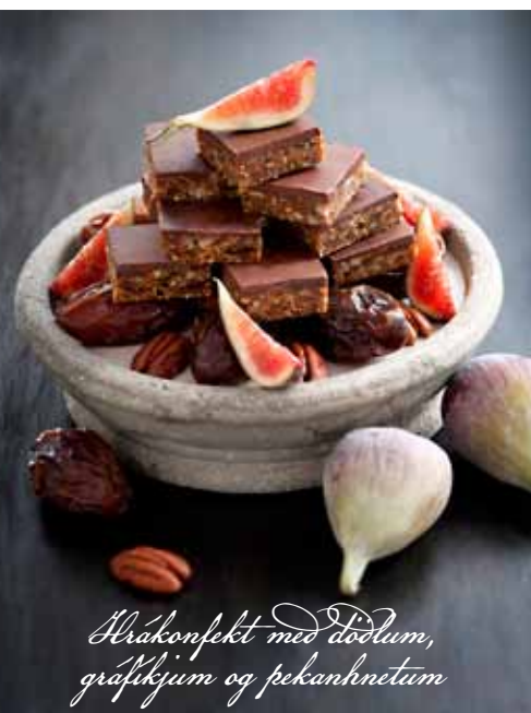
Þrákonfekt með dödum, gráfíkjum og pekanhnetum

Kókosbotn, rommykrem, súkkuladí-mousse, hjúpud með bananakaramellu