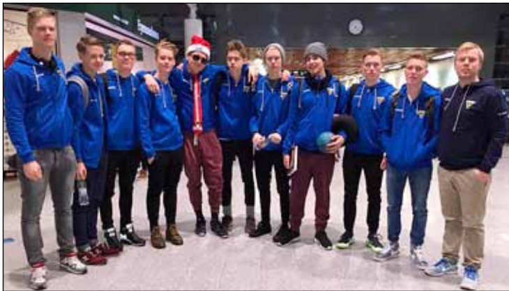
Gróttustrákarnir stóðu sig með þryði á Norden Cup.